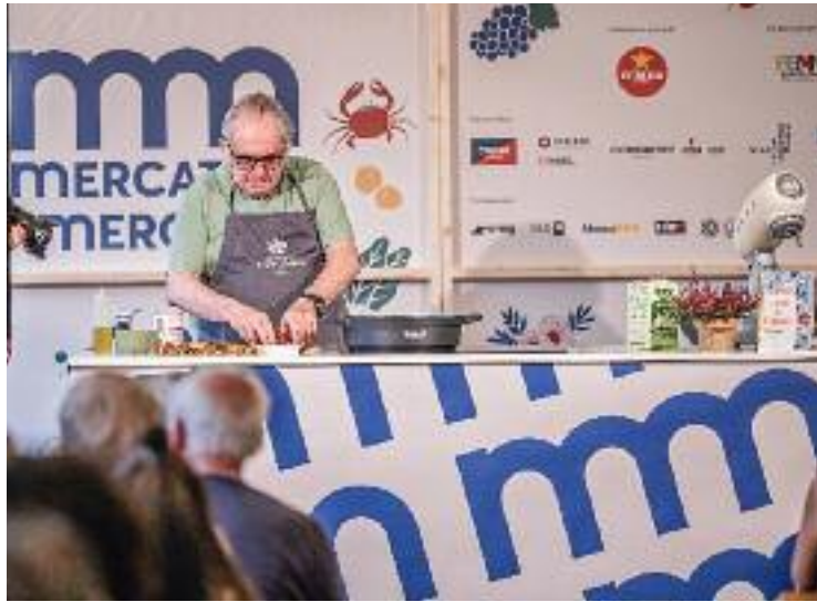
El Mercat de Mercats es farà a la plaça de Catalunya.

UNA FIRA PLENA DE PROPOSTES Així, la fira disposarà de diferents espais on es repartiran les diverses activitats. Les parades