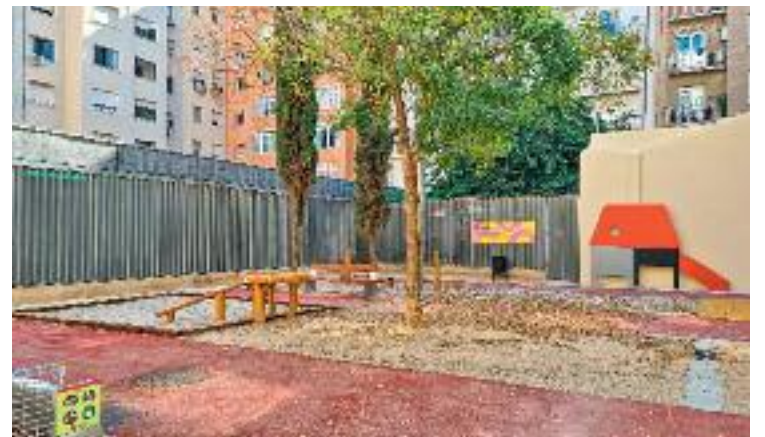
Els jardins de Carme Biada ja han reobert les portes.

El paviment, el mobiliari urbà i els arbres dels jardins també s'han renovat, tot sota un pressupost d'uns 400.000 euros.