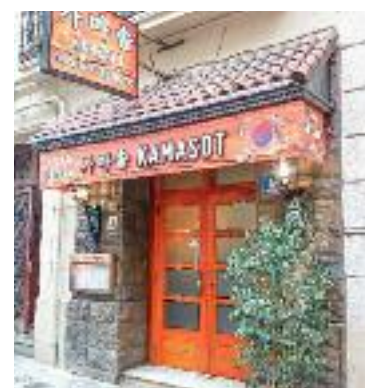
En Charbel treballant al Leana's, dos clients al Tiflis i l'entrada del Kamasot.

Una història semblant és la de la Nana, del restaurant georgià Tiflis (Consell de Cent, 487), que va obrir fa dos anys. Ella assegura que al principi la va sorprendre descobrir que hi havia força gent que ja coneixia la cuina del seu país, i la va fer feliç veure l'interès d'aquells que fins aleshores no la coneixien. "Es nota que hi ha ganes de tastar la gastronomia georgiana", assegura, per afegir que "totes les taules" demanen khinkali,