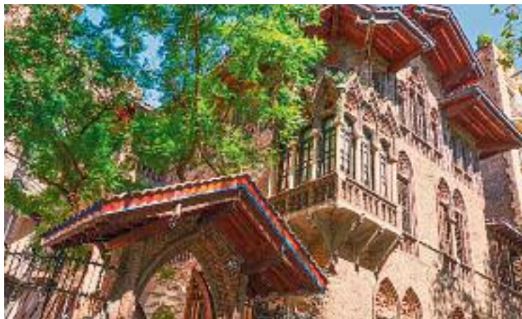
La Golferichs és un dels centres cívics que acull el cicle.

En aquest primer tast del cinquè ArgumentaBCN, es va reflexionar sobre la relació que existeix entre els diners o la manca d'aquests i el malestar emocional en la nostra societat. "Per què no som feliços encara