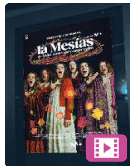
La mesías Javier Ambrossi i Javier Calvo