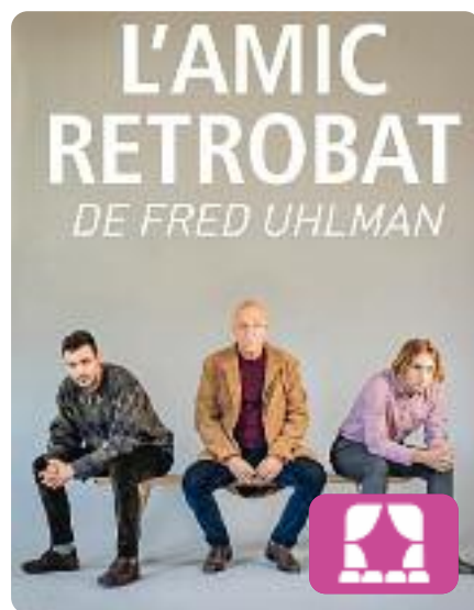
L'amic retrobat Fred Uhlman

L'amic retrobat relata a través de la veu d'un home adult, Hans Schwarz, fill d'una família jueva, la mateixa història d'amistat de fa més de tres dècades amb Konradin Von Hohenfels, fill d'una família aristocràtica de Suàbia. Els nois es coneixen a l'escola més famosa de Württemberg i inicien una intensa relació. Al Teatre Goya de Barcelona.