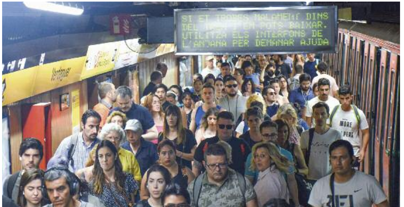
El metro és una infraestructura clau per a la mobilitat barcelonina i metropolitana.

En termes numèrics, el 2023 podria ser millor que el 2019. Com és possible si, segons diuen, encara no s'ha arribat a les xifres de turisme d'aleshores? Com és possible si teòricament