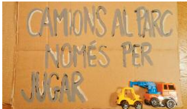
Una de les pancartes per a la protesta del 26 d'octubre. Foto cedida

Per la seva banda, els Comuns van presentar ahir un prec al govern municipal perquè eviti que durant "cinc anys" el parc de Joan Miró pateixi aquesta afectació.