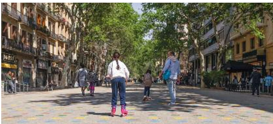
El comerç de Sant Antoni alerta de l'augment de negocis que han de tancar pel preu del lloguer.

Per la seva banda, Núñez considera que el preu del lloguer és el factor més important perquè "s'ha especulat amb la superilla", però