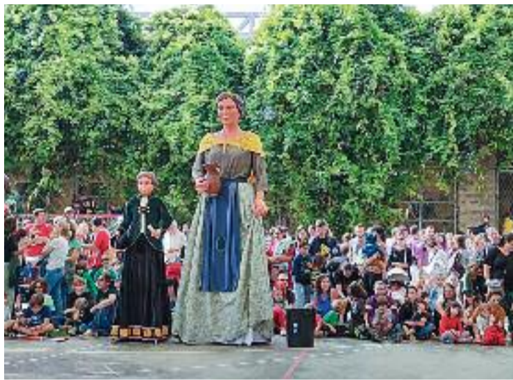
La Festa Major de l'Esquerra de l'Eixample ja és a punt.

Així doncs, les activitats tindran lloc en diferents escenaris del barri i estan adreçades a tots els públics. Tallers, activitats infantils i familiars, concerts, competicions esportives, espectacles, balls, xerrades i diverses mostres de comerç són alguns dels exemples que es podran gaudir a l'Esquerra de l'Eixample.