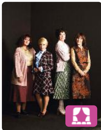
La dona fantasma T de Teatre

La dona fantasma gira al voltant de quatre mestres a finals dels anys setanta. Porten una vida intensa i melancòlica, marcada per la cura dels pares i dels fills, pels desenganys amorosos i pels desafiaments que els provoquen les seves alumnes. L'extraordinari irromp en aquesta quotidianitat esglaiadora: una dona fantasma. Al Teatre Romea de Barcelona.