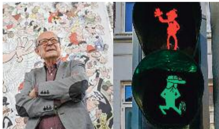
La proposta de semàfor amb Mortadelo y Filemón.