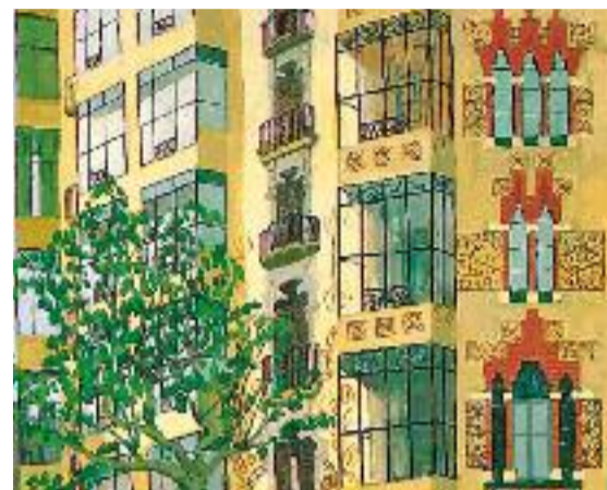
Les Cases Marfà (Ali Bei, 27-29) i la Casa Llopis Bofill (València, 339), retratades per Núria Llimona. Fotos cedides

tenir-los a casa. “I allà s'han quedat, passant de pares a fills”, lamenta. De fet, ell mateix no va tenir accés a cap original de l'artista mentre escrivia el llibre.