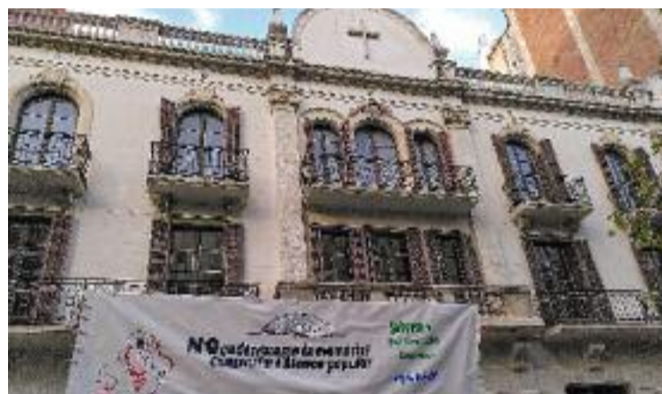
L'edifici d'Urgell, en una imatge d'arxiu.

fensa de l'immoble –que inclou prop d'una setantena d'entitats del barri i de la ciutat– considera que el resultat negatiu de la votació ha estat "una oportunitat perduda per recuperar la memòria cooperativa". La resolució, recorden, havia de servir per preservar íntegrament l'edifici i recuperar-lo per al barri. Per a ells, això implicava aturar l'actual cessió en dret de superfície a l'Hospital Clínic per part de l'Arquebisbat de Barcelona. Ara, tot i el resultat de la votació, deixen clar que "no defalliran".