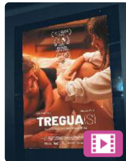
Tregua(s) Mario Hernández

L'Ara i l'Edu són amants des de fa una dècada, des que eren una actriu i un guionista novells. Al marge de les seves relacions "oficials", sempre troben un moment per estar junts, un oasi en les seves vides. Després d'un any sense veure's, es retroben en un festival de cinema, però ni tan sols aquesta treva està lliure de les mentides i nostàlgies de la vida real.