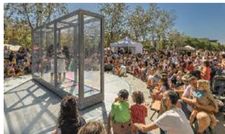
Un dels espectacles programats al parc de l'Estació del Nord.

Mallén, reconeix que cal “felicitar l'Ajuntament” per aquesta decisió. Segons Mallén, “ja feia temps” que el veïnat reclamava que es fessin activitats culturals al parc de l'Estació del Nord perquè “tornés a ser un parc per als veïns i no només per a gossos”. En aquest sentit, cal recordar que la presència de gossos sense lligar en aquest parc és una qüestió que ha despertat moltes crítiques al barri en els últims anys. Amb tot, el president de l'AV espera que hi hagi “més continguts al parc”.