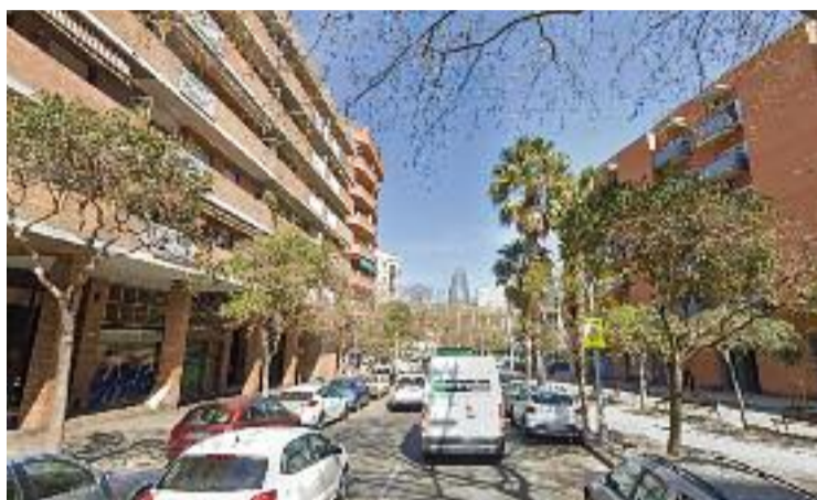
Casp travessa el Fort Pienc i la Dreta de l'Eixample.

Díaz comparteix aquesta queixa, però creu que hi ha més factors que han provocat aques-