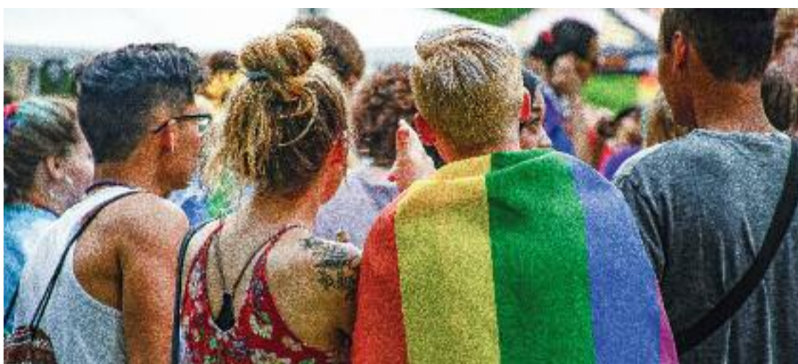
La 7a Setmana LGTBI+ de la Sagrada Família se celebra del 26 de setembre al 2 d'octubre.

Més enllà d'aquest context complicat, el cicle Nosaltres és un conjunt d'activitats per celebrar el col·lectiu LGTBI. Així doncs,