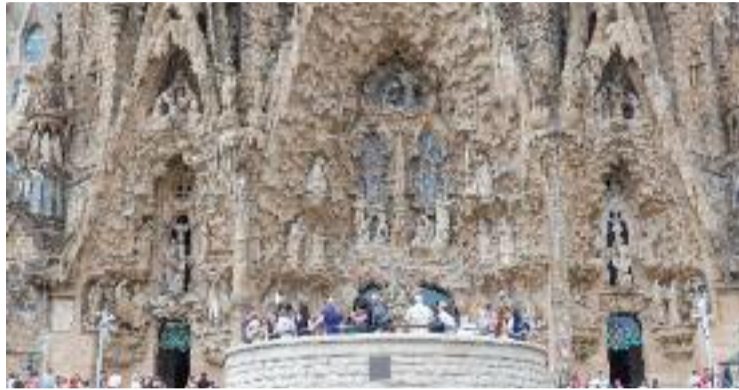
Turistes al voltant de la Sagrada Família, el juliol passat.

Tot i aquests progressos, la data de finalització del temple