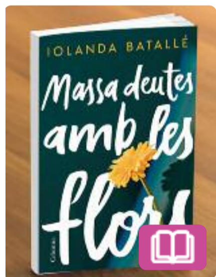
Massa deutes amb les flors Iolanda Batallé

Una dona en crisi s'instal·la en una casa a les muntanyes amb l'esperança de refer-se escrivint en solitud. No preveu, però, que les persones ferides es reconeixen i s'ajuden, i és així com serà acollida per una família després d'una vivència colpidora. Conversa rere conversa, l'escriptora reconstruirà una història familiar que és un cant d'amor a la vida al Pirineu.