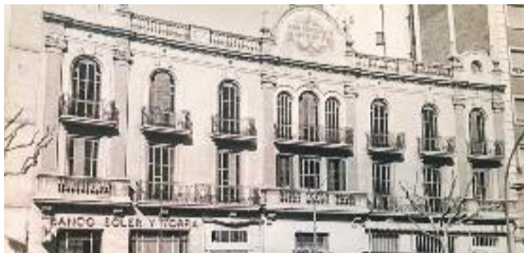
Imatge històrica de la façana d'Urgell, 176-180.

Cal recordar que aquest immoble, que va ser la seu de la Unió Cooperatista Barcelonesa durant el segle passat, va ser catalogat a principis d'any amb un