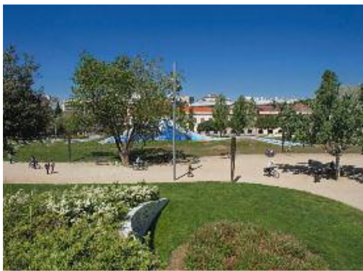
El parc de l'Estació del Nord acollirà Mercè Arts de Carrer.