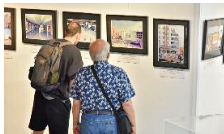
L'exposició 'De l'illa Fichet a l'illa Fort Pienc'.

Més enllà del projecte urbanístic, l'exposició repassa i destaca la lluita veïnal que va fer possible la creació d'aquells equipaments que el Fort Pienc necessitava amb urgència. La reivindicació del barri va agafar força als anys noranta i va culminar el 2003, ara fa vint anys.