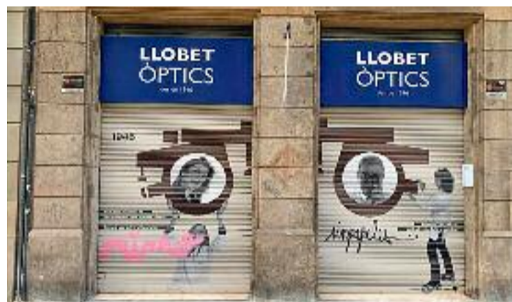
Una de les persianes amb història vandalitzada.