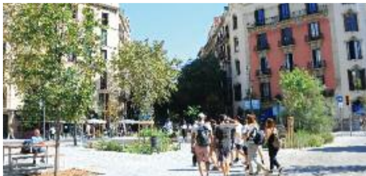
La cruïlla de Consell de Cent amb Balmes.

D'altra banda, la jutgessa que ha emès la sentència contra l'eix verd ha ofert ara una mediació entre Barcelona Oberta i l'Ajuntament per frenar-ne el desmantellament, segons va explicar dijous La Vanguardia . I és que cap de les dues parts vol que s'acabi revocant al complet la pacificació.