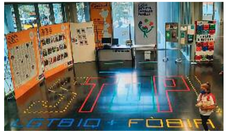
La fira d'entitats de l'edició de l'any passat.

Un dels espectacles més destacats de la setmana serà el monòleg de la periodista i humorista Ana Polo. Serà el pròxim 28 de setembre a la sala d'actes del centre cívic. Polo és una reconeguda humorista i és la impulsora del podcast Oye Polo, amb la també humorista Oye Sherman, a més de formar part de Radio Primavera Sound. Tot plegat, per divulgar la visibilitat del col·lectiu LGTBI+.