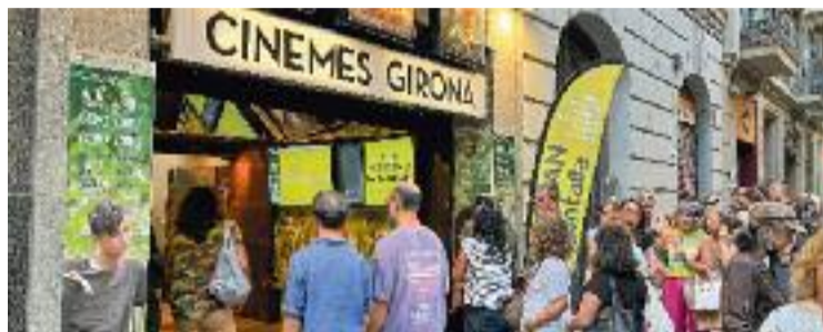
Cua per entrar a la multisala de la Dreta de l'Eixample.

Els Cinemes Girona, fundats el 2010, ofereixen aquest abonament a un preu especial des del 2013. En aquest últim any, l'espectadora que ha fet servir més l'abonament ha vist un total de 130 pel·lícules, de manera que ha pagat cinquanta cèntims per film. I hi ha una altra manera de veure-ho: "Si pensem en el preu normal de les entrades i el preu que ha aca-