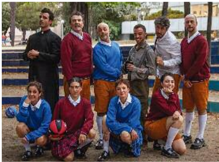
El parc de l'Estació del Nord acull teatre tot el juliol.

Així doncs, enguany Parking Shakespeare representa una versió de l'obra Ricard III , dirigida per Carla Torres. Van estrenar el format el 7 de juliol i encara s'allargaran fins al dia 30 d'aquest mateix mes. Les pròximes funcions seran cada dia del 20 al 24 de juliol, a les 19 h de la tarda, i del 27 al 30 en el mateix horari.