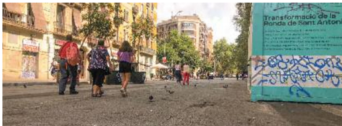
La imatge virtual del projecte de la ronda aprovat pels comuns.

En les últimes setmanes, després que es tornés a posar en qüestió l'execució del projecte aprovat