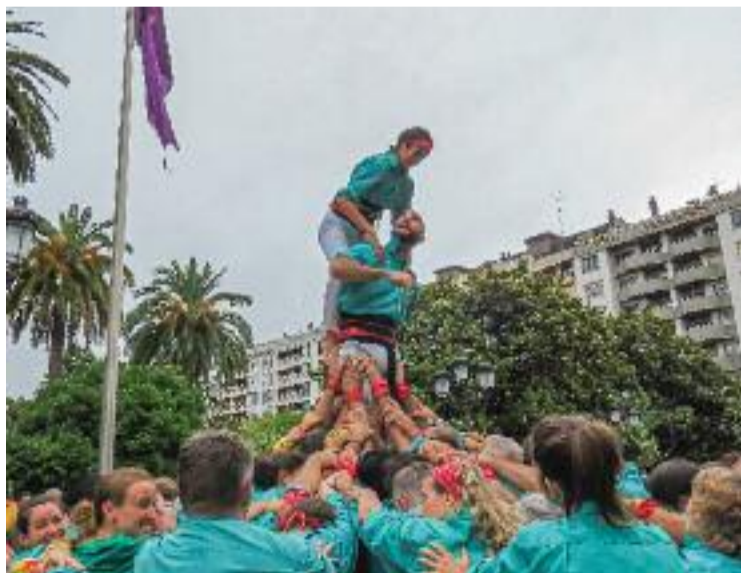
Els Castellers de Safa aixequen castells a Santurtzi.

Aquesta integrant de la colla castellera del barri explica que actuar fora de Catalunya "ha estat una experiència molt bona" i "una oportunitat per fer un intercanvi cultural". I és que Farré