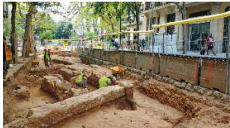
Les restes que han aparegut al carrer Girona.

Però el compromís dels Cinemes Girona amb la ciutadania no s'acaba al juliol. Durant tot l'any col·laboren amb escoles i casals i s'esforcen per ser "un eix del barri" i, en definitiva, "ser veïns".