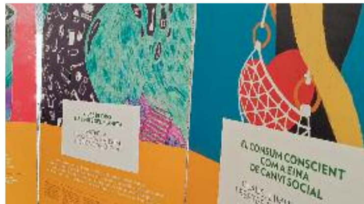
L'exposició alerta sobre el canvi climàtic.

destaca que els veïns de Santurtzi van estar molt contents de veure castells en directe, però insisteix a dir que "ho estaven sobretot per l'orgull que els va provocar veure una veïna seva fer-ho", en referència a la seva companya de colla basca.