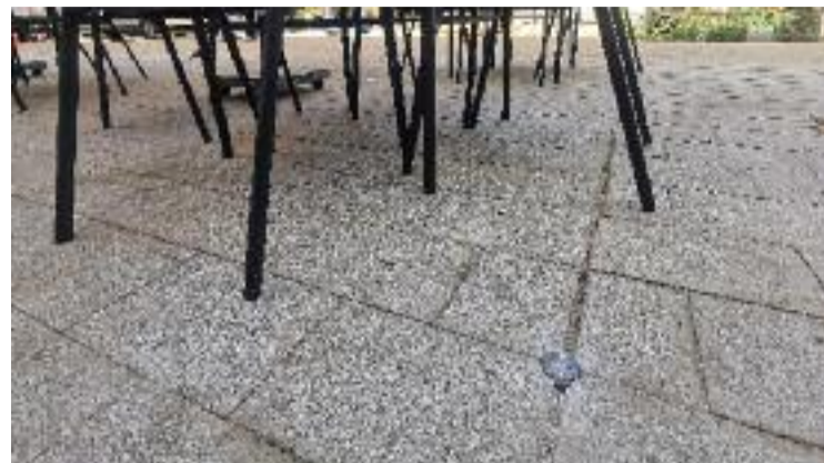
Una de les quatre xapes que limiten la terrassa d'un bar.

Des de la Xarxa d'Habitatge de l'Esquerra de l'Eixample van més enllà i es mostren del tot crítics amb la llei. “És una rentada de cara abans de les eleccions”, denuncien, per afegir que “mentre l'habitatge no deixi de ser un bé de mercat, no es complirà l'accés universal a una llar”.