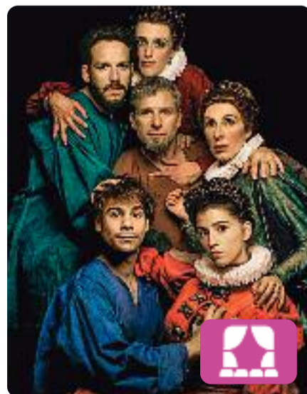
La tendresa Alfredo Sanzol

Una reina una mica maga i les seves dues filles viatgen en l'Armada Invencible, obligades per Felip II a casar-se en matrimonis de conveniència amb nobles anglesos després d'haver envaït Anglaterra. La reina Maragda odia els homes perquè li han robat la llibertat, i no permetrà que les seves filles tinguin el mateix destí.