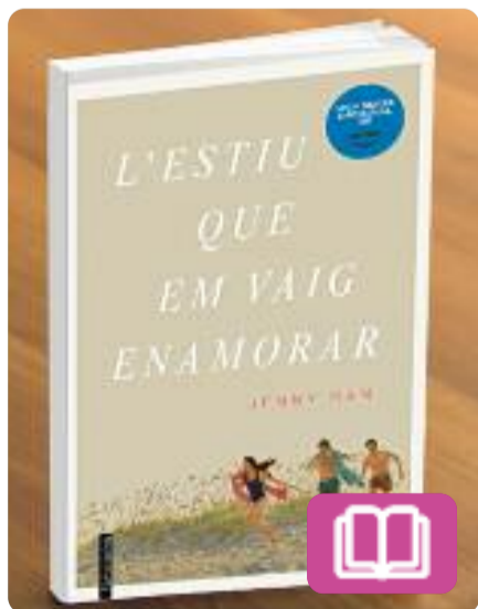
L'estiu que em vaig enamorar Jenny Han

La Belly mesura la vida en estius. Els hiverns només serveixen per comptar les setmanes que falten per arribar al mes de juny i marxar a la casa de la platja amb la Susannah, la millor amiga de la mare, i els seus fills, en Jeremiah i en Conrad. En Jeremiah és com un germà. En Conrad és el seu amor de sempre. Un amor impossible. Però aquest estiu no és com els altres.