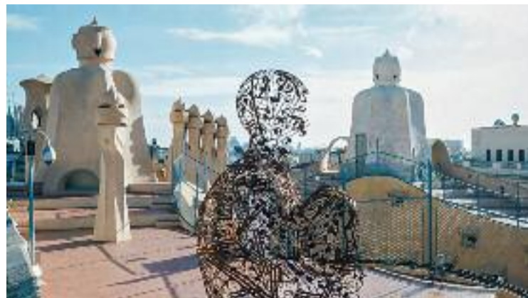
Una de les obres de Jaume Plensa instal·lada a la Pedrera.

Finalment, des de l'Ajuntament afirmen que per ara no els consta "res" sobre la finca en venda d'Aragó i que, en tot cas, en tindrien coneixement un cop hi haguessin un acord de compravenda.