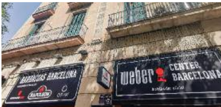
Detall dels edificis, al costat del Mercat de la Concepció.

Un membre de l'Associació de Veïns de la Sagrada Família va trobar l'anunci per casualitat a Idea-