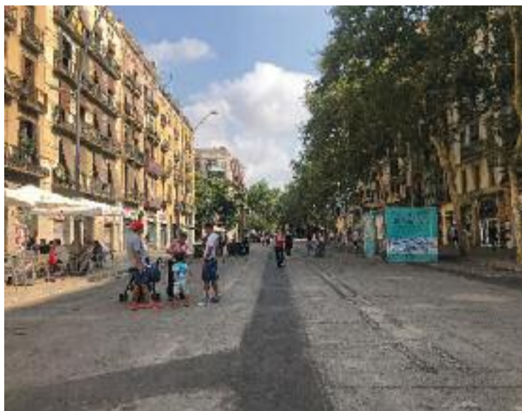
La ronda de Sant Antoni actualment.