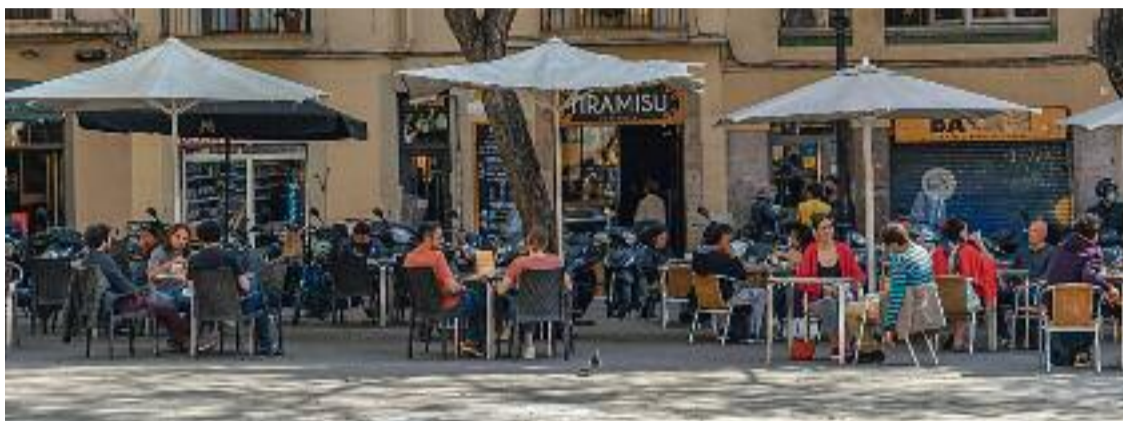
L'Ajuntament ha aprovat mesures per solucionar el conflicte del soroll de les terrasses.

La nova patrulla es mourà pel carrer d'Enric Granados i l'eix de Consell de Cent. En aquest sentit, l'Associació de Veïns de l'Esquerra de l'Eixample, a través d'un comunicat, explica que estan satisfets amb la reunió, però lamenten que les mesures no s'apliquin al carrer d'Aribau, ja que el consideren "un entorn igualment desbordat". A més, l'entitat veïnal afegeix que "està molt bé fer complir les normes, però algunes hau-