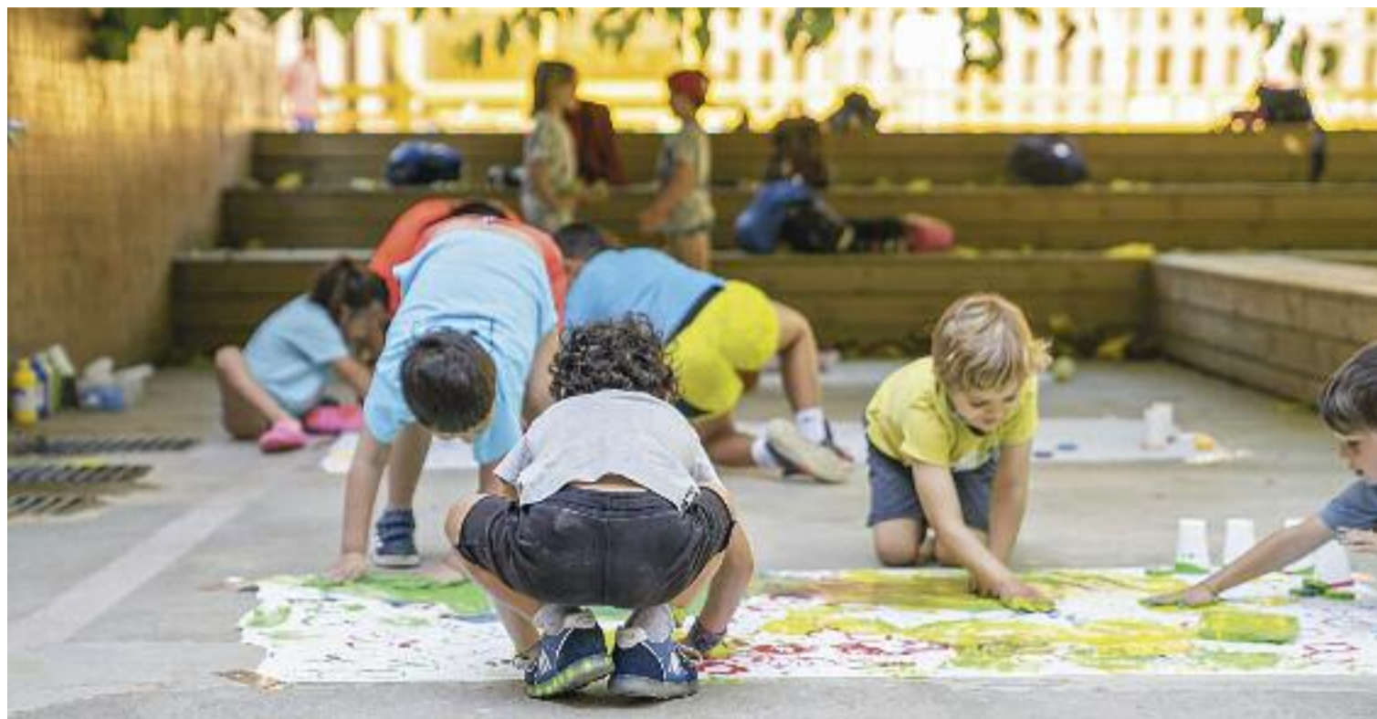
Els casals són la solució per omplir el buit que deixa l'escola durant l'estiu.

OFERTA PÚBLICA... ACCESSIBLE? Més enllà d'això, el problema que té l'oferta pública és que tampoc és accessible per a totes les but-