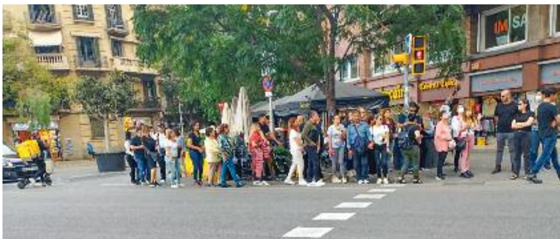
Diversos turistes, a tocar de la Sagrada Família.

És aquí on tots dos veïns coincideixen que el barri ha anat perdent la seva identitat. "Els comerços han canviat molt, abans hi havia el forn, la 'tocineria' i la