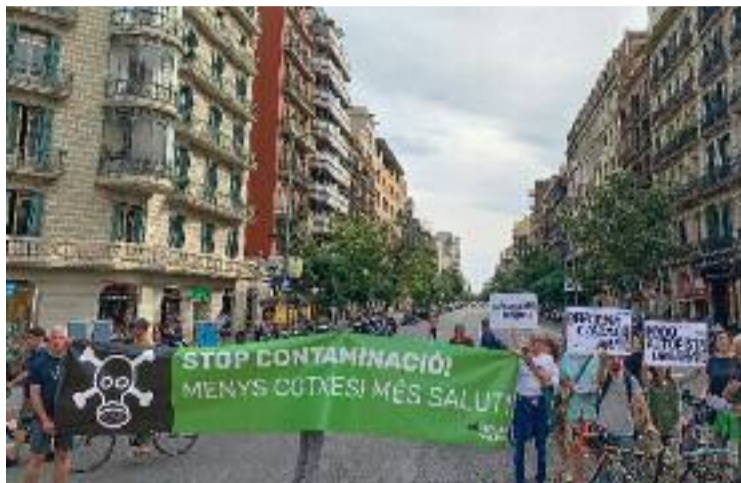
El tall de dilluns a la tarda al carrer Aragó.

"És l'hora que els veïns i veïnes recuperin el carrer on viuen i que el cotxe, principal prota-