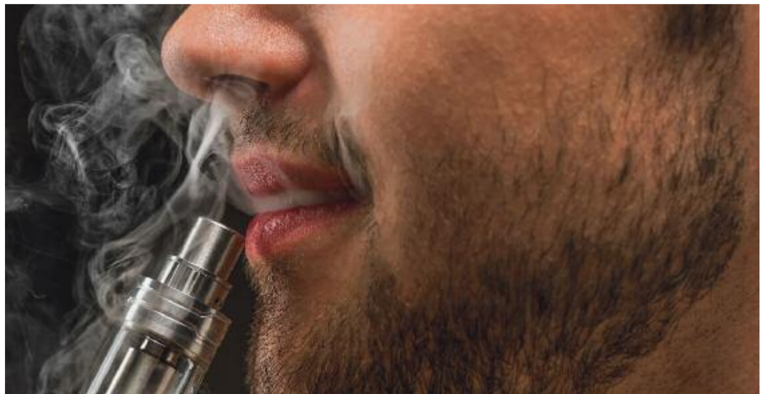
El consum de cigarretes electròniques ha augmentat entre els joves fins al punt de ser la porta d'entrada al tabac tradicional.

mador de tabac convencional, però fa uns mesos va començar a fumar vapes . "Una amiga en fuma i veus que fa bona olor, i em va venir de gust provar-ho", explica. Aquest jove relata que al principi consumia els que no tenen nicotina i sempre amb un ús recreatiu. "Ara no en faig un ús diari, però sí que en consumeixo unes tres nits a la setmana i intento no fer-ho mai de dia". Però finalment n'ha acabat comprant amb un 2% de nicotina. Tot i ser conscient dels components addictius, insisteix a definir el seu consum com el d'una catximba o pipes d'aigua.