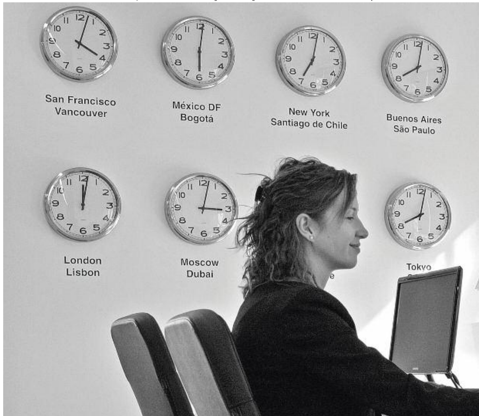
A Barcelona es calcula que hi ha uns 100.000 estrangers del nord global.