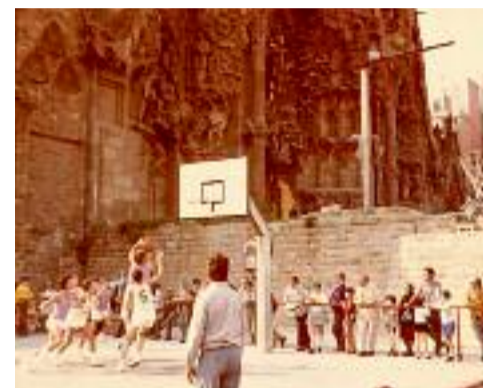
Dues imatges de l'antiga pista de bàsquet que hi havia als peus del temple.

aquells joves que van fer els primers partits al recinte del temple.