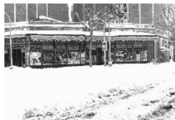
Dues imatges històriques dels magatzems La Esperanza capturades per un dels treballadors.

La Esperanza es va vendre la primera senyera després de la mort de Franco", assegura.