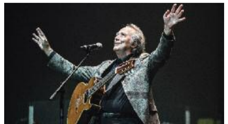
Serrat rebrà el Premi Alicia a la trajectòria.

Viñeta acaba explicant que per concloure la celebració d'aquest aniversari organitzaran un acte el pròxim mes de desembre.