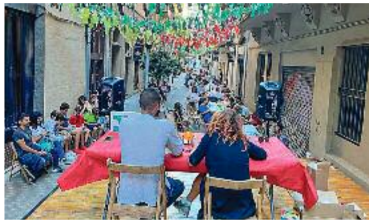
La festa és un clàssic de l'Esquerra de l'Eixample.

Amb tot, dissabte també hi va haver música en directe, però també activitats per als més petits. I finalment, per tancar la festa, el diumenge 11 l'associació va organitzar una paella i un bingo popular.