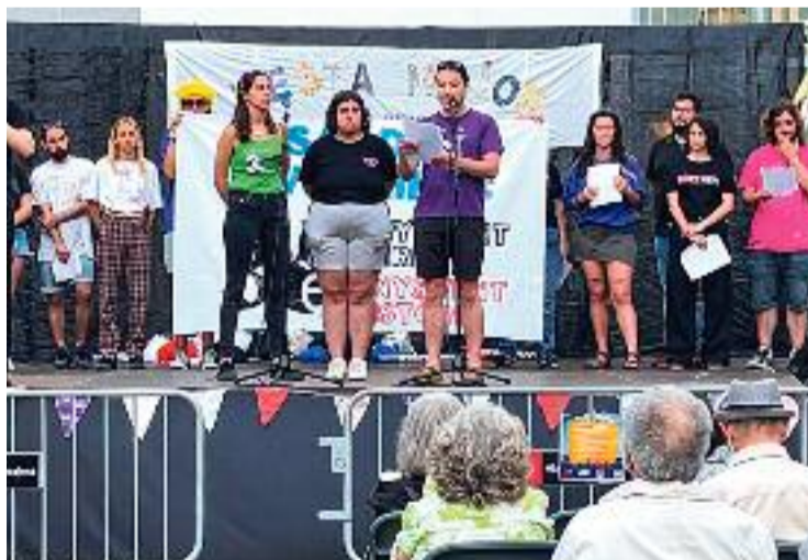
Membres del Casal de Joves Xiroc fent el pregó de Festa Major.

La Festa Major del Fort Pienc va començar el 8 de juny, però Viñeta explica que des del casal Xiroc proposen que comenci