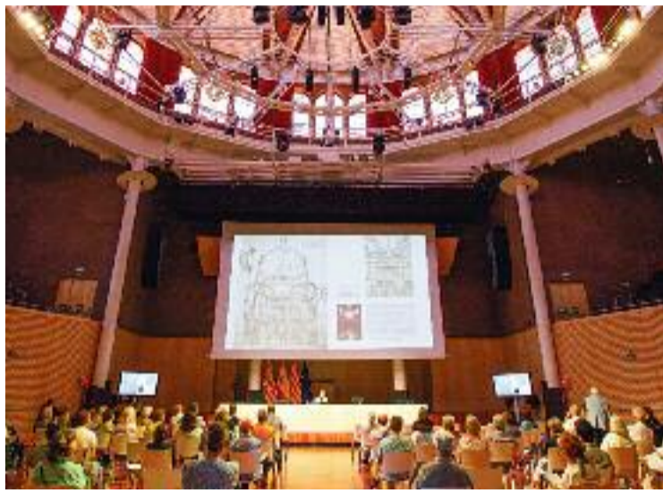
Un moment de la jornada de dissabte.