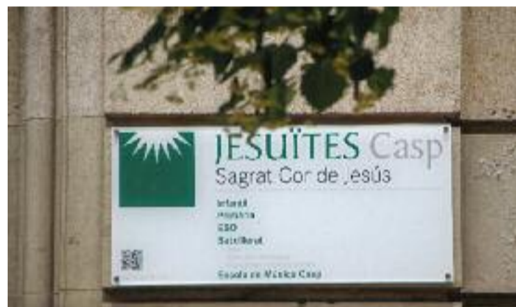
La placa del col·legi dels Jesuïtes de Casp.

Puiggròs també va anunciar que la institució ha descartat presentar-se com a acusació particular en els casos judicialitzats perquè, després d'assessorar-se, van concloure que seria "un acte de cara a la galeria".