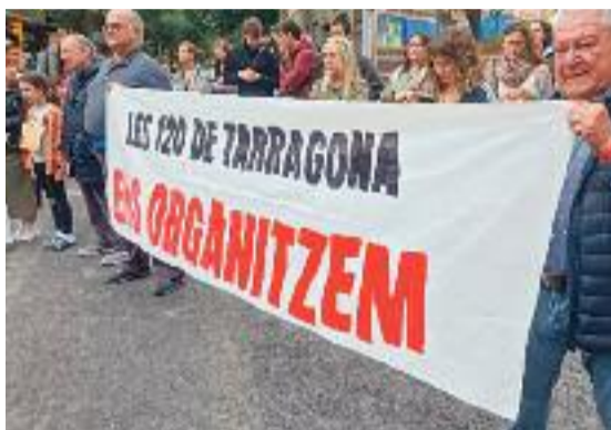
Una protesta dels veïns i un forat a la paret que haurien causat les obres dels pisos.

Per si no n'hi hagués prou, en Xavi subratlla que no saben fins quan s'allargarà aquesta situació. "Encara queden una pila de pisos amb llogaters, podrien trigar anys a reformar-los tots", diu, amb l'esperança que el degoteig d'expulsions i reformes s'aturi. En aquest sentit, confia que les administracions hi puguin fer alguna cosa. De fet, poc després que es fessin públiques les intencions de la propietat (la immobiliària Gallardo), l'Ajuntament va anunciar que retiraria la llicència turística a 69 dels