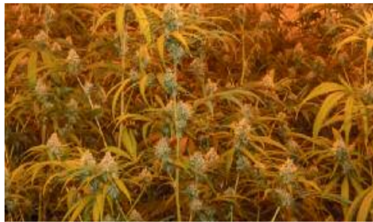
Una plantació de marihuana en una imatge d'arxiu.

Les drogues són un mal present al conjunt de la ciutat. Diumenge passat, sense anar més lluny, quatre persones van ser detingues a Horta-Guinardó per fabricar més de 66.000 l·laminadures i xocolatines amb cànnabis.