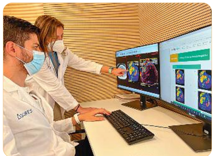
Dos enginyers biomèdics d'Ascires revisen els biomarcadors desenvolupats a la plataforma HepaTools.