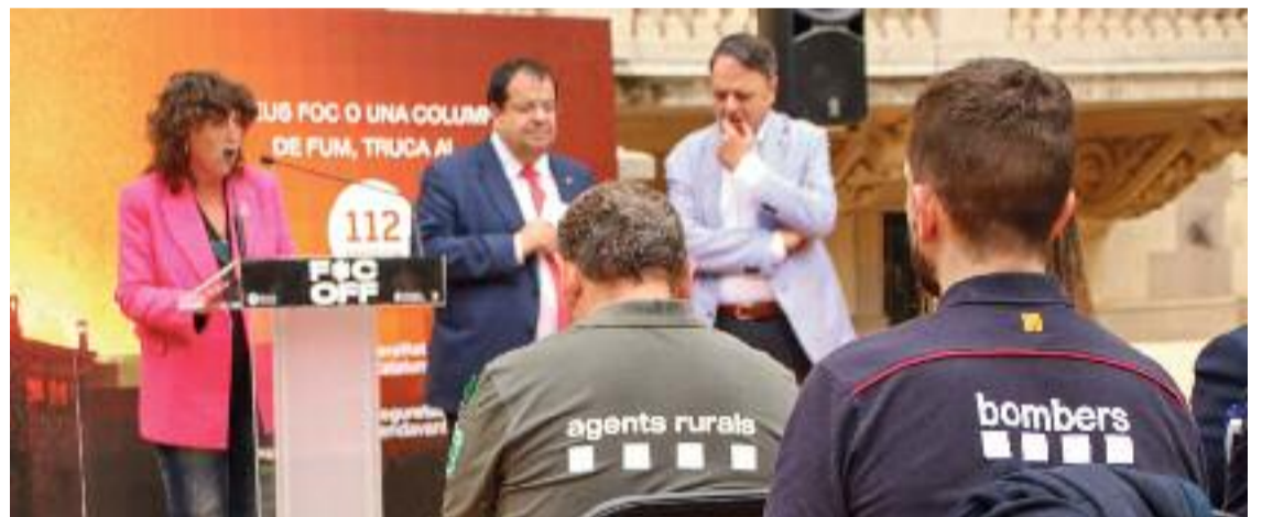
S'han reforçat els cossos que s'ocupen de l'extinció dels focs.