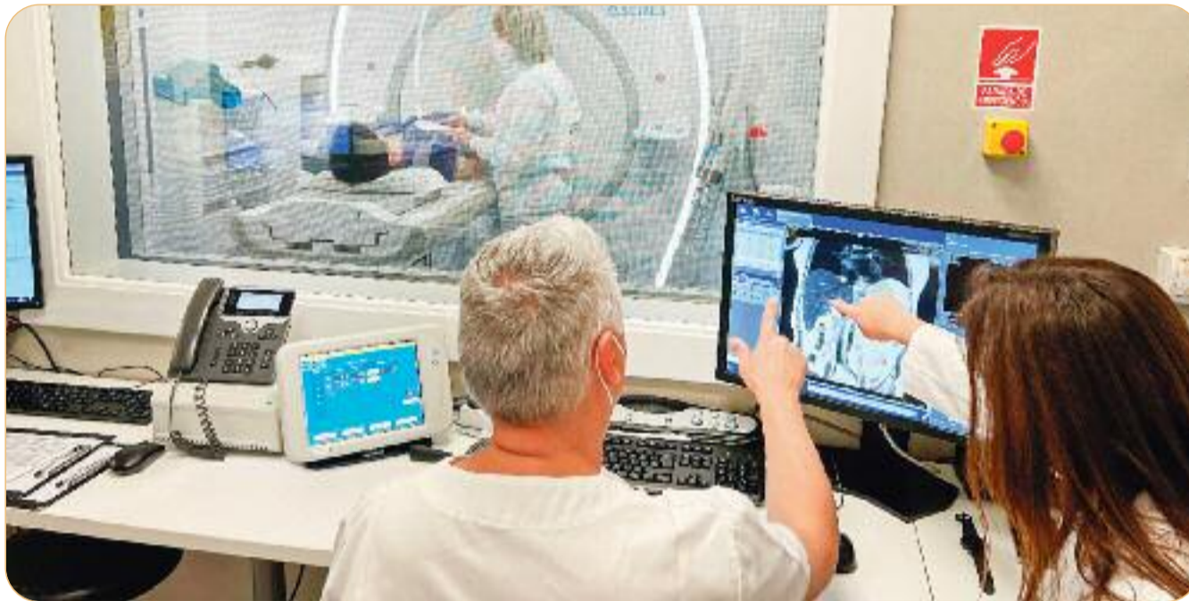
Cetir Ascires ha estat un dels primers centres a introduir l'elastografia per ressonància magnètica a Catalunya.

L'abús del menjar ràpid i el sedentarisme ja són la causa principal de cirrosi al nostre país, per sobre de l'alcohol