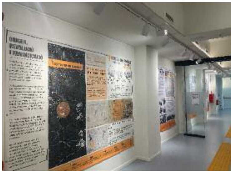
L'Ateneu El Poblet acollirà la jornada.

que s'allargarà fins a dos quarts de nou del vespre, s'adreçarà especialment al veïnat del barri. A través d'una representació teatral i diversos vídeos, es donaran a conèixer els projectes que ja du a terme el PDC. A partir d'aquí, els veïns i veïnes tindran l'oportunitat de fer preguntes, propostes i crítiques constructives.