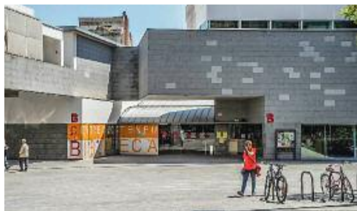
L'Illa d'equipaments Fort Pienc celebrarà els 20 anys de vida.

Un cop superat l'estiu, a partir de setembre, hi haurà el gruix de les activitats que han organitzat els equipaments. Des d'exposicions que expliquen tot el procés reivindicatiu per aconseguir els equipaments, fins a espectacles familiars de circ, tot passant per gimcanes familiars i l'acte institucional que servirà per tancar la celebració de les dues dècades de l'Illa Fort Pienc.