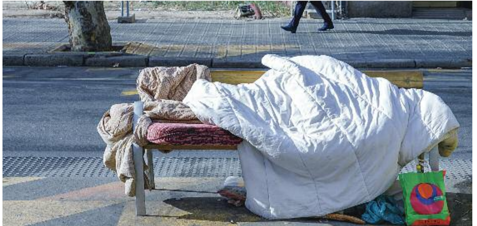
Més persones sense llar de les que ens pensem tenen feina.

“No et pots dutxar ni rentar la roba, i en una feina com la meva, que t'embrutes molt, això ho complica tot”, assenyala. És per aquest motiu que ell aprofita les dutxes que hi ha al centre obert de la Fundació Arrels, al carrer de la Riereta de Barcelona. Segons explica Laia Margalef, de l'equip d'acollida de la mateixa fundació, per a les persones que viuen al carrer i treballen, “els serveis higiènics són molt importants”. També ho és trobar un lloc on descansar si tenen feines físiques. “Com que la