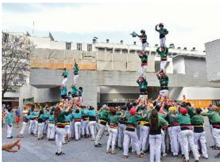
Diada castellera a la Festa Major de l'any passat.

De fet, l'Arxiu Històric del Fort Pienc és una de les entitats que ofereix una de les exposicions: Estació del Nord, més de 160 anys d'història . S'inaugurarà demà a les 19:30 h de la tarda i es podrà visitar del 8 de juliol al 21 del mateix mes.