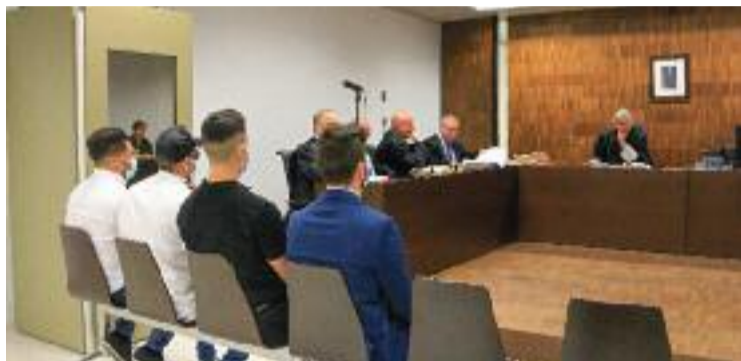
El judici als quatre acusats d'una agressió feixista.

El judici va començar ahir dimarts a la Ciutat de la Justícia. En la primera jornada, els acusats van negar formar part de grups neonazis. Un d'ells sí que va reconèixer