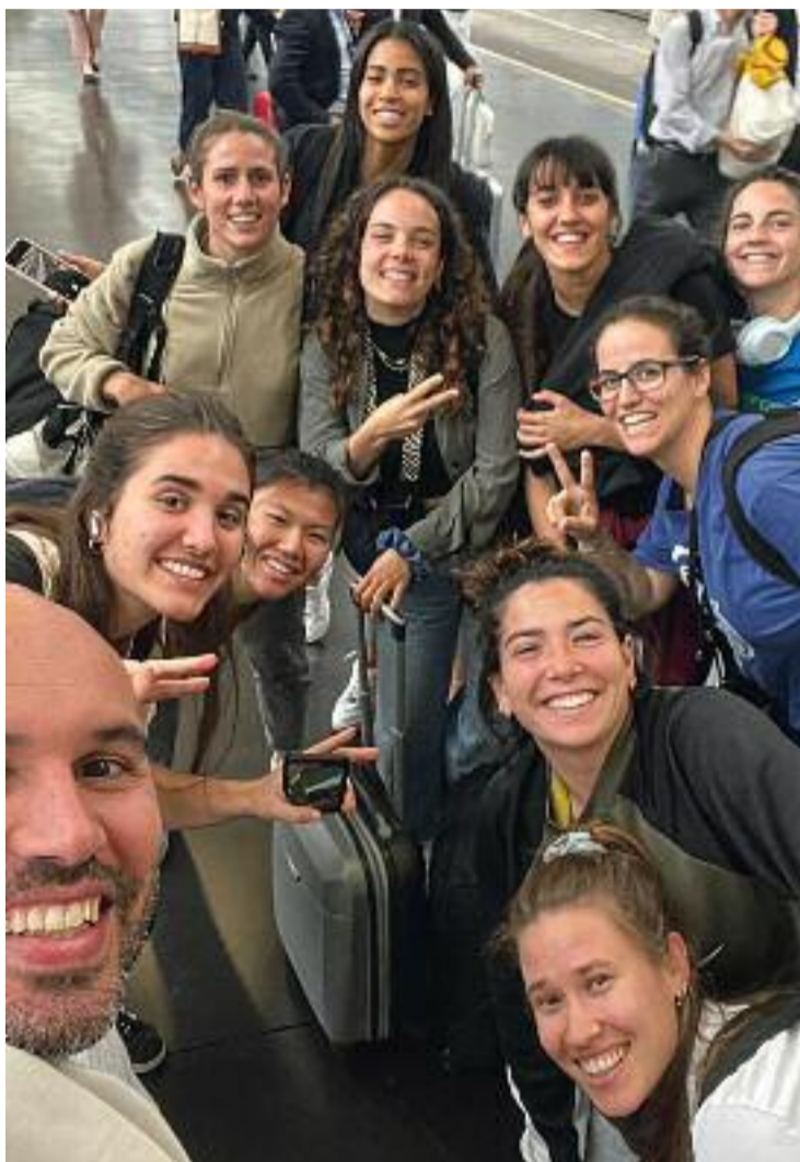
Gran part del CB Roser a l'estació d'Atocha.

Mirat no creu que perdessin l'últim partit en els últims minuts, sinó per "la suma dels petits errors", com la precipitació i les presses excessives,