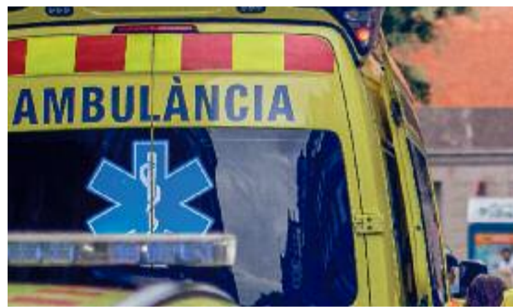
Una ambulància del SEM, en una imatge d'arxiu.