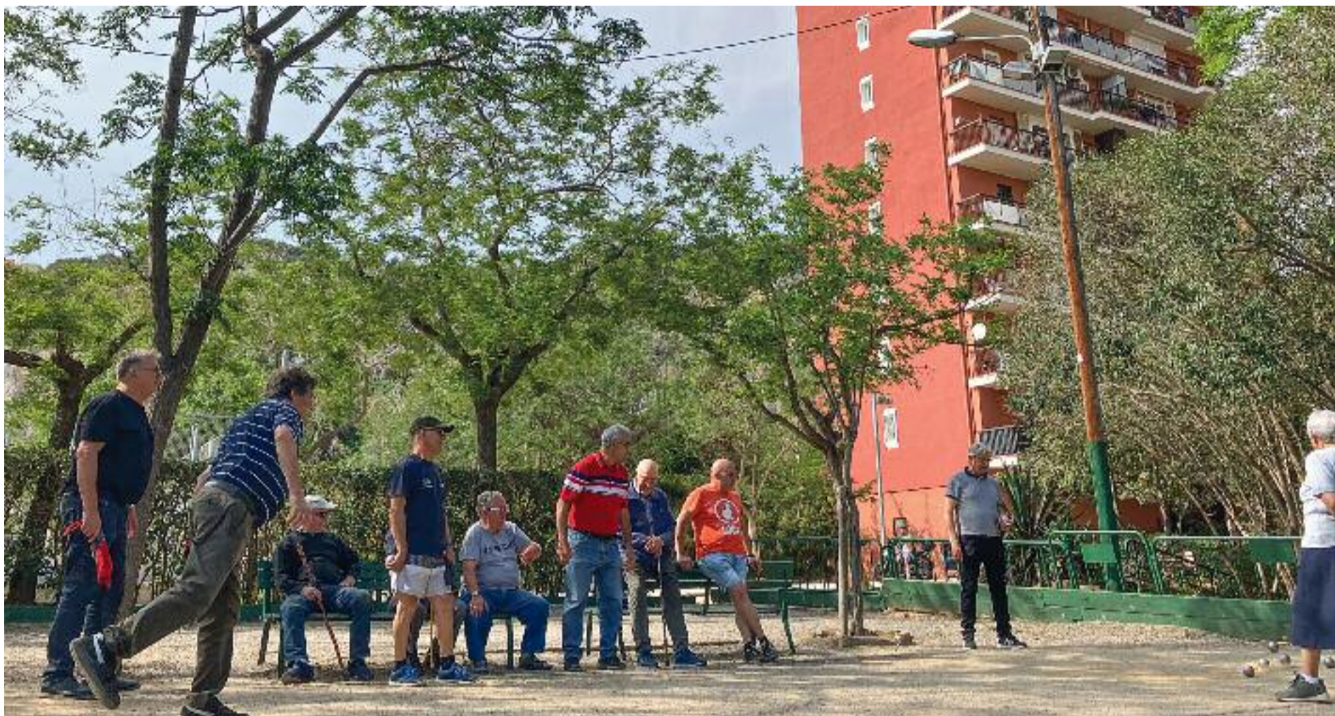
On hi havia camps i barraques a Can Baró ara hi ha pistes de petanca.