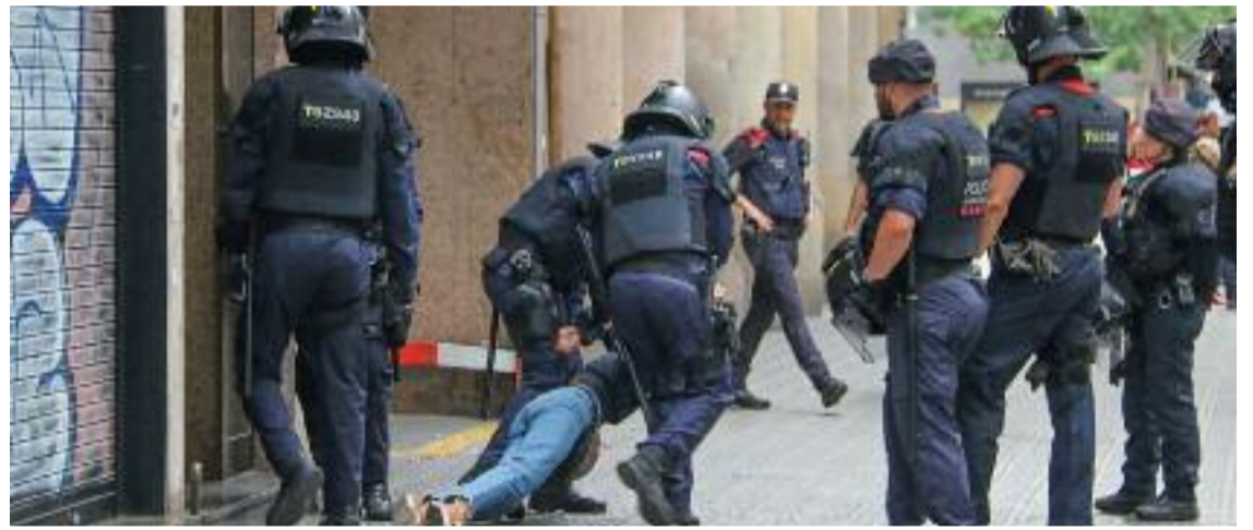
El desnonament va provocar tensió entre manifestants i la policia.