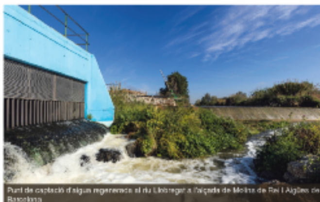
Punt de captació d'aigua regenerada al riu Llobregat a l'estació de Molins de Rei i Aigües de Barcelona

El canvi climàtic requereix respostes sostenibles. Calen solucions innovadores. És hora de dibuixar un futur on tenir aigua depengui més de nosaltres mateixos que del que cau del cel.