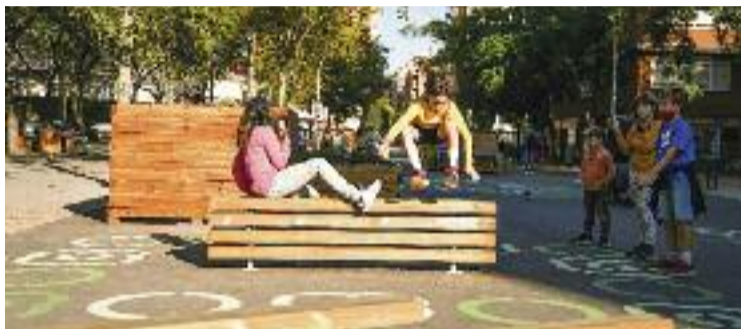
Un entorn escolar pacificat gràcies a 'Protegim les escoles'.

A la Sagrada Família hi ha diverses escoles incloses en aquest programa. Una d'elles, l'Escola dels Encants, està classificada com a "projecte anterior", és a dir, previ al 'Protegim les escoles'. L'Ajuntament considera que té un entorn escolar pacificat perquè el tram del carrer Cartagena al qual toca el seu pati va passar a ser per a vianants amb les obres de Glòries. Així ho explica l'Albert, pare d'un alumne d'aquesta escola, que creu que caldria anar més enllà i reduir el trànsit a Consell de Cent. "Amb la futura superilla, el carrer Consell de Cent serà de via-