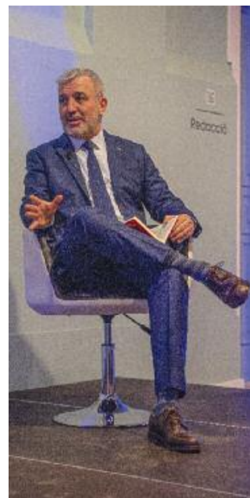
La sala de conferències de l'Espai Línia es va omplir per escoltar Jaume Collboni.