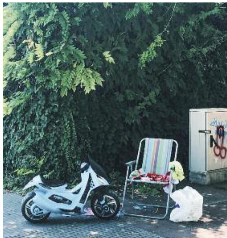
Un cartell promocional de l'exposició 'L'altra ciutat' i una de les fotografies que en forma part.

from l'altra ciutat" i les va convertir en la seva carta de presentació. "Vaig saludar aquests centres cívics des de l'altra ciu-