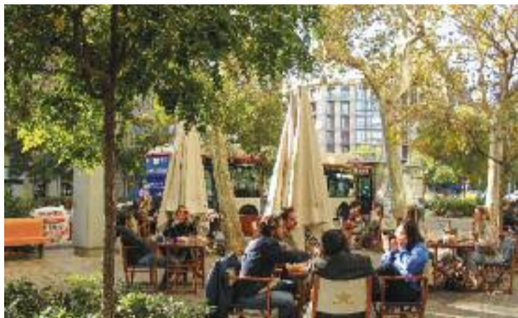
La terrassa d'un bar al districte de l'Eixample.

Tal com va argumentar la tercera tinenta d'alcaldia i regidora de Mobilitat, Laia Bonet, durant la comissió d'ahir, el canvi de parer dels socialistes s'ha produït perquè el document final "no s'ajusta" a l'acord pactat. "La regulació estricta només afectava onze carrers i ara s'ha ampliat a 37", va assegurar. Com a resposta, la segona tinenta d'alcaldia, Janet Sanz, va