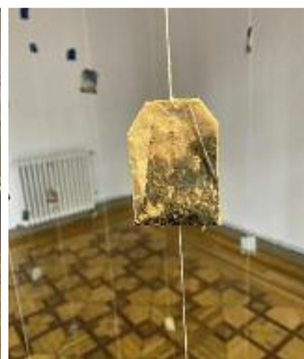
Dues imatges de l'exposició 'Nosaltres, interpretats per les flors'.