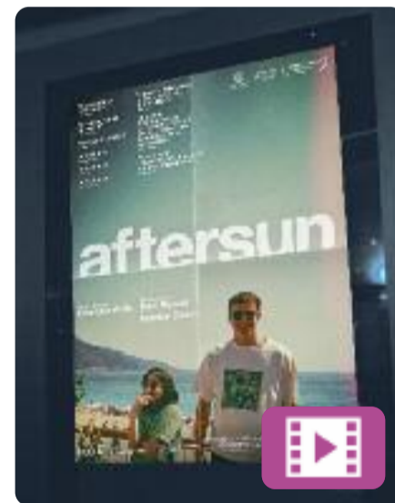
Aftersun Charlotte Wells

La Sophie reflexiona sobre l'alegria compartida i la melangia privada d'unes vacances que va fer amb el seu pare vint anys enrere. Els records reals i imaginaris omplen els espais entre les imatges mentre intenta reconciliar el pare que va conèixer amb l'home que no va conèixer. Aquesta pel·lícula de Charlotte Wells és considerada per alguns com la millor del 2022.