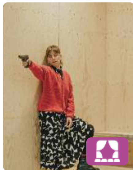
Hedda Gabler Hedda Gabler

El director Àlex Rigola trasllada la modernitat de Henrik Ibsen al nostre present per explorar les contradiccions d'aquest gran personatge femení que és Hedda Gabler. Una adaptació lliure del clàssic contemporani, considerat un dels primers textos de la dramàturgia moderna i llargament representat als escenaris del Lliure. Al Teatre Lliure de Montjuïc.