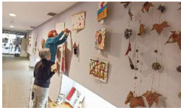
L'exposició 'Cuid'art', a l'Espai 210 del carrer Padilla.

La mostra s'emmarca en el programa Educart de Vincle i, tal com expliquen des de l'organització, està formada per "un seguit d'obres que reivindiquen la figura de les persones cuidadores no professionals". Vincle és una entitat que treballa per la inclusió social, el desenvolupament comunitari i l'atenció a col·lectius en risc de vulnerabilitat.