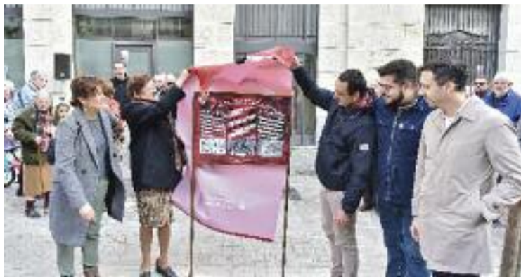
Un moment de la descoberta del faristol.

L'Arquebisbat va arribar a un acord amb l'Hospital Clínic el