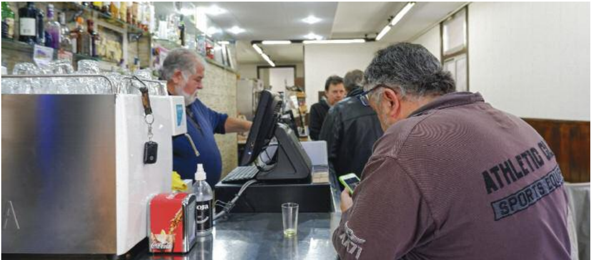
L'interior del bar La cuina del papi, al Camp de l'Arpa.