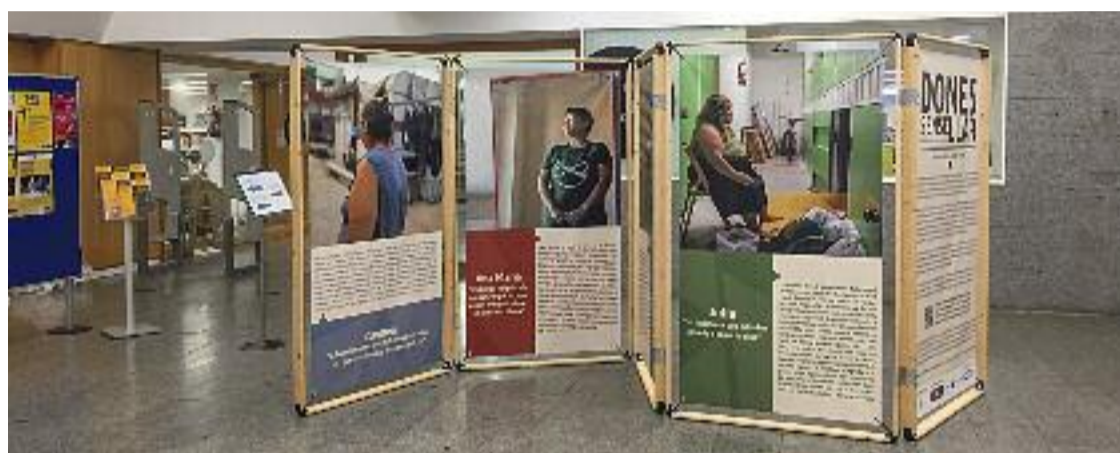
L'exposició 'Dones sense llar. Històries de supervivència'.

Tot i que la publicació del reportatge va ser la culminació de la recerca promoguda pel premi del consistori, Frontino no va voler que el projecte acabés allà. “Vaig pensar que encara hi havia