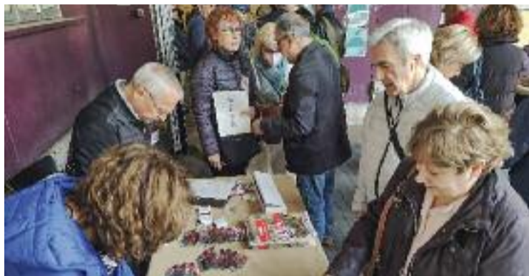
La primera convenció contra l'amiant, el 26 de novembre.