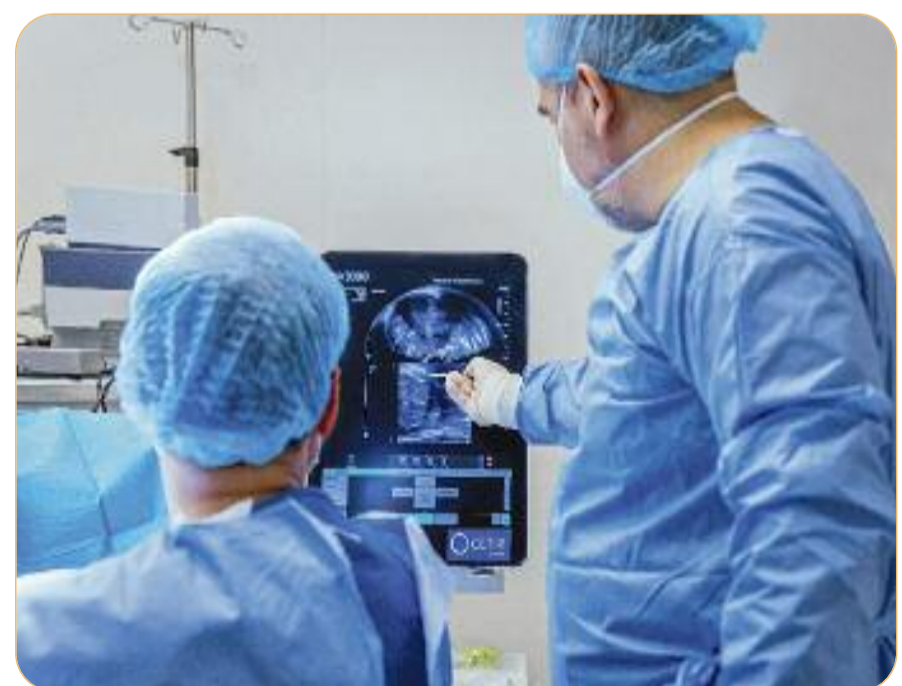
La nova modalitat de biòpsia es realitza per via transperineal, de manera que es minimitza el risc d'infecció.