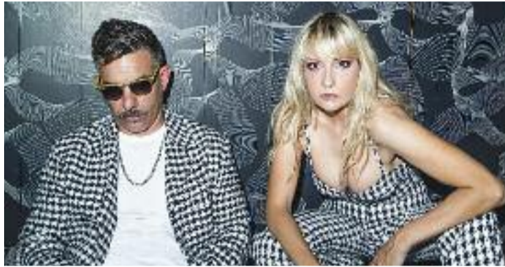
El grup Trezor, un dels impulsors del festival, hi actuarà.