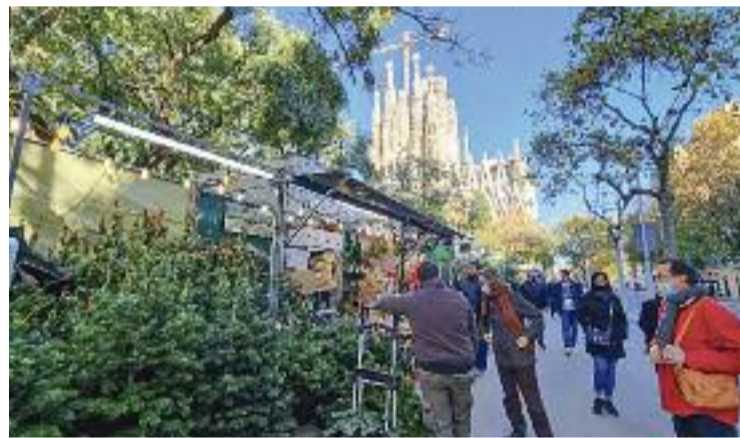
La Fira de Nadal de la Sagrada Família ha tornat.

El pregó d'inauguració de la Fira de Nadal es va fer diumenge i va ser la primera de la quinzena d'activitats programades en el marc d'aquesta activitat. Durant les properes setmanes hi haurà tallers, jocs, mostres d'art i altres propostes, pensades sobretot per a la canalla. Els adults, per la seva banda, podran comprar arbres i plantes, pessebres, menjar i regals a les diverses parades.