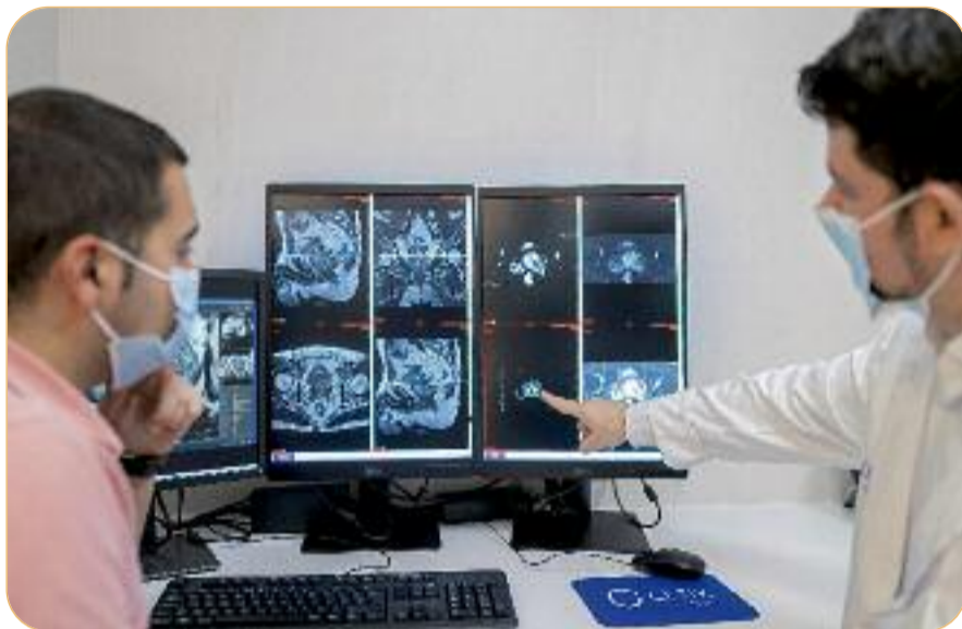
Un metge i un enginyer biomèdic planifiquen la biòpsia amb la fusió de RM i ecografia.

Permet un estudi complet de tota la glàndula i redueix els falsos negatius