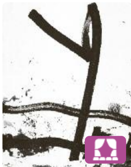
Yerma Federico García Lorca