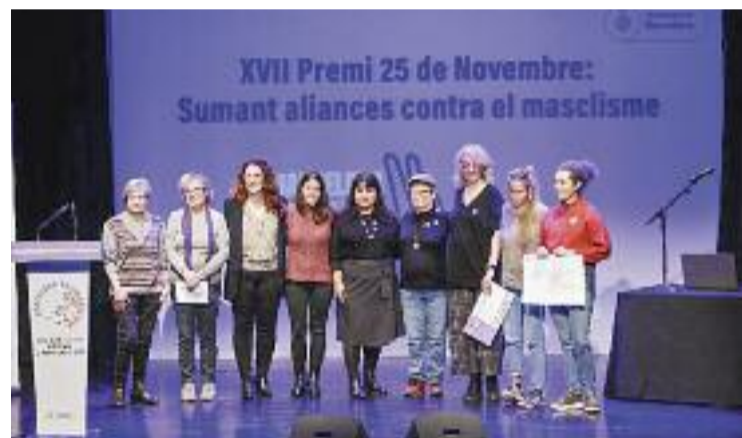
Les guanyadores del Premi 25N a l'acte d'entrega del guardó.

Aquesta idea ha estat mereixedora del Premi 25 de novembre en la seva dissetena edició, que duia com a lema Sumant aliances contra el masclisme . Com a entitat guanyadora del guardó, l'AV Sant Antoni rebrà 15.000 euros i suport municipal per poder desplegar el projecte Totes som punt lila i fer fora el masclisme del barri.