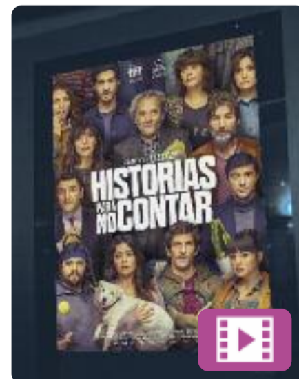
Historias para no contar Cesc Gay

Un repartiment de luxe per narrar situacions en què ens podem reconèixer, però que preferiríem no explicar. De fet, fins i tot preferiríem oblidar-les. Historias para no contar recull trobades inesperades, moments ridículs i decisions absurdes. En total, cinc històries amb una mirada àcida i compassiva a la incapacitat per governar les nostres emocions.