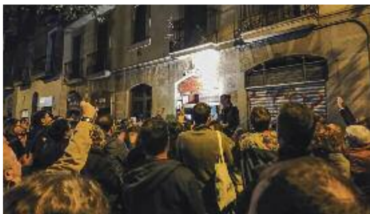
La concentració en defensa del Prize.