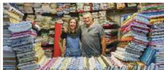
D'esquerra a dreta i de dalt a baix, la Joieria Mercè, Instal·lacions Barrachina, Mobles Latorre i Teixits Borbón.

ria sastreria i roba de vestir, i nosaltres ens hem reinventat amb teles per fer patchwork , roba de la llar o treballs manuals", explica. "Hem trobat el nostre lloc i ens funciona, estem contents", afegeix.