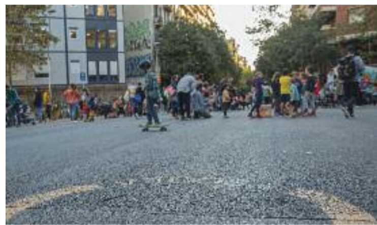
El tall a l'escola 9 Graons.

De fet, enguany les protestes seran temàtiques i la del passat dia 4 es va centrar a exigir més seguretat als entorns escolars. Per a les pròximes accions les exigències seran d'entorns més saludables i lliures de soroll.