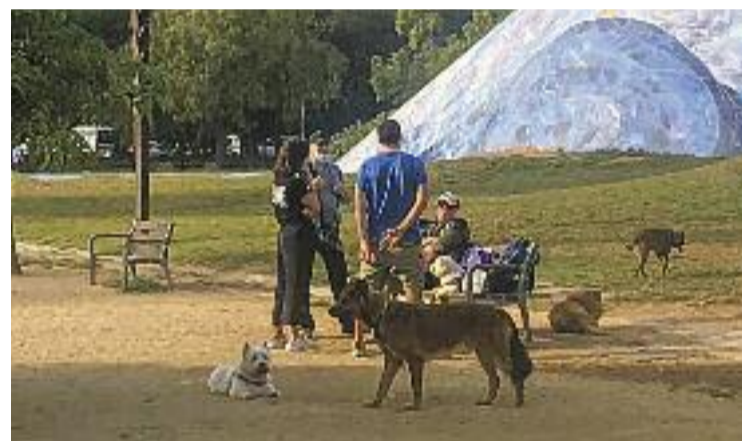
Gossos sense lligar al parc de l'Estació del Nord.