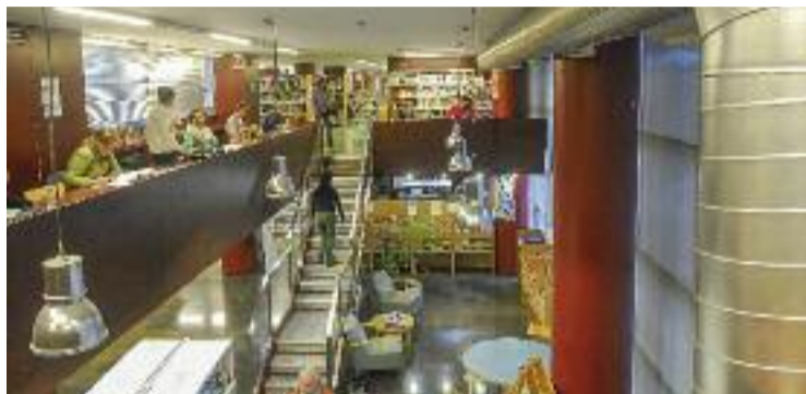
L'interior de la biblioteca, en una imatge d'arxiu.