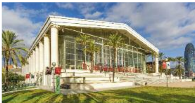
La plaça de les Arts, inclosa en el projecte de la superilla.