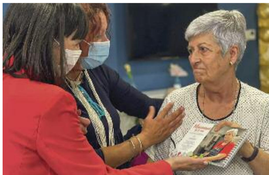
S'han recopilat receptes de tota la vida de les persones usuàries del centre per tal d'agrupar-les en un llibre.

► El simple record que va evocar una magdalena sucada en un te al protagonista de Por el camino de Swann va permetre a Marcel Proust escriure prop de 3.000 pàgines. I és que el gust, l'olfacte i també el tacte esperonen la memòria i, fins i tot, poden ajudar a alliberar records que pràcticament havíem enviat a l'oblit. En certa manera, aquest és l'esperit de Assaborint Records , una iniciativa que va posar en marxa la residència de gent gran CleceVitam Ceritania, a Cerdanyola del Vallès, amb motiu del Dia Internacional de les Persones Grans.