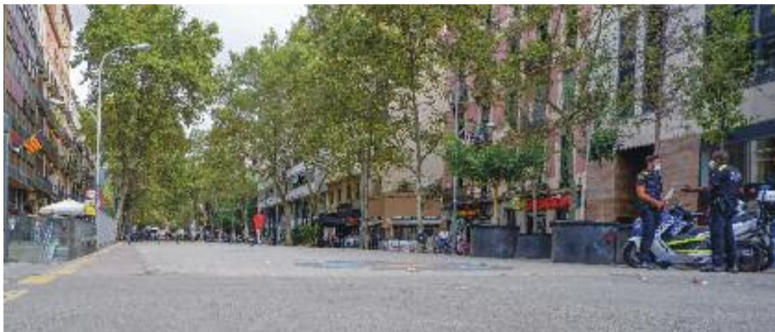
La reforma de la ronda s'ha d'enllestir el mandat que ve.

El desembre del 2018, la ronda es va recuperar per a ús veïnal després de nou anys d'acollir les carpes provisionals del Mercat de Sant Antoni. Aleshores es va adequar la llosa i es va fer una primera proposta de reurbanització. És aquí on van començar a aparèixer discrepàncies entre els veïns del barri. D'una banda, la Plataforma d'Afectats per la Llosa i el PSC, que forma part del govern municipal, defensen el projecte aprovat el 2018, que contemplava convertir la ronda en un eix verd i cívic on tinguessin cabuda vianants, bicicletes i transport públic. Ara la Plataforma d'Afectats ha tornat a criticar el disseny presentat, ja que considera que acabarà suposant