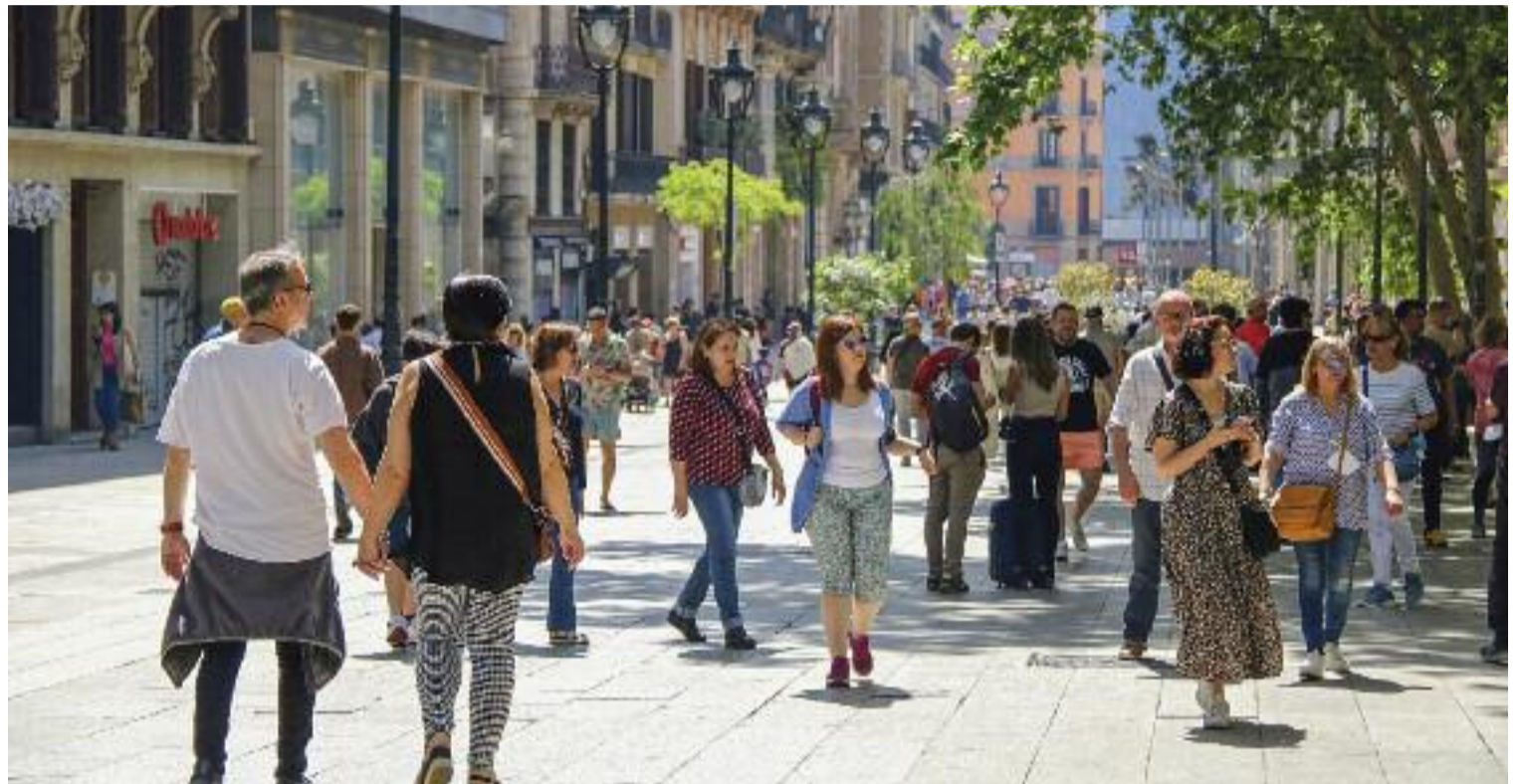
El català és la llengua minoritària entre els joves als deu districtes de Barceloba.