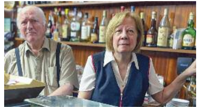
El Celler Montserrat compleix 50 anys.

El Celler Montserrat és un local reconegut per la qualitat del seu menjar, i que ha guanyat un premi a les tres edicions de la Ruta de Plat i Tapa de l'Esquerra de l'Eixample.