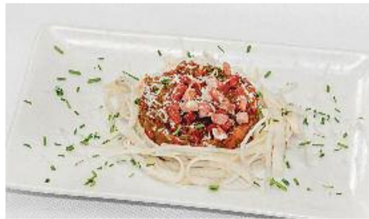
El Tapantoni ha tornat en el format de tardor.

El Tapantoni sempre és una bona oportunitat per descobrir bars i restaurants del barri. A més, durant els dies que dura la ruta, els consumidors podran votar la tapa o menú que més els hi agradi a través d'un formulari per optar a guanyar el premi de fins a 300 euros per gastar als comerços associats a Sant Antoni Comerç.