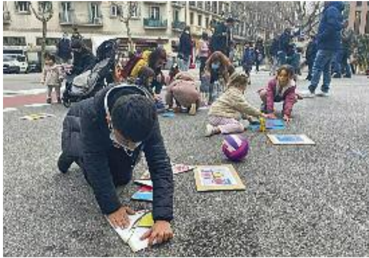
Entitats reclamen la pacificació del carrer Entença.

I és que la proposta de pacificar els entorns escolars del carrer Entença va ser la guanyadora dels pressupostos participatius. És per aquest motiu que el manifest signat per l'AMPA Joan Miró, l'AFI Entença, l'AFA Xirinacs, la Llar d'Infants Àgora i l'AVV Eixample Esquerra demana al consistori que "respecti el projecte seleccionat". I és que l'Ajuntament es va comprometre a reduir un carril de circulació per a vehicles per prioritzar la zona d'estada infantil entre els carrers de la Diputació i Consell de Cent. A més, el carrer Entença és una zona on passen 26.000 cotxes diaris, motiu pel qual les entitats