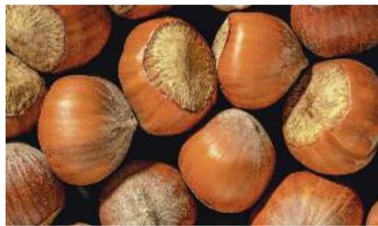
Hi haurà dues parades amb paperines de castanyes al barri.

Els clients que vulguin recollir les seves castanyes aquest dijous ho hauran de fer a Aragó, 317, mentre que els que ho vulguin fer divendres hauran d'anar a Bailèn, 38. L'horari de tots dos llocs serà de deu del matí a sis de la tarda.