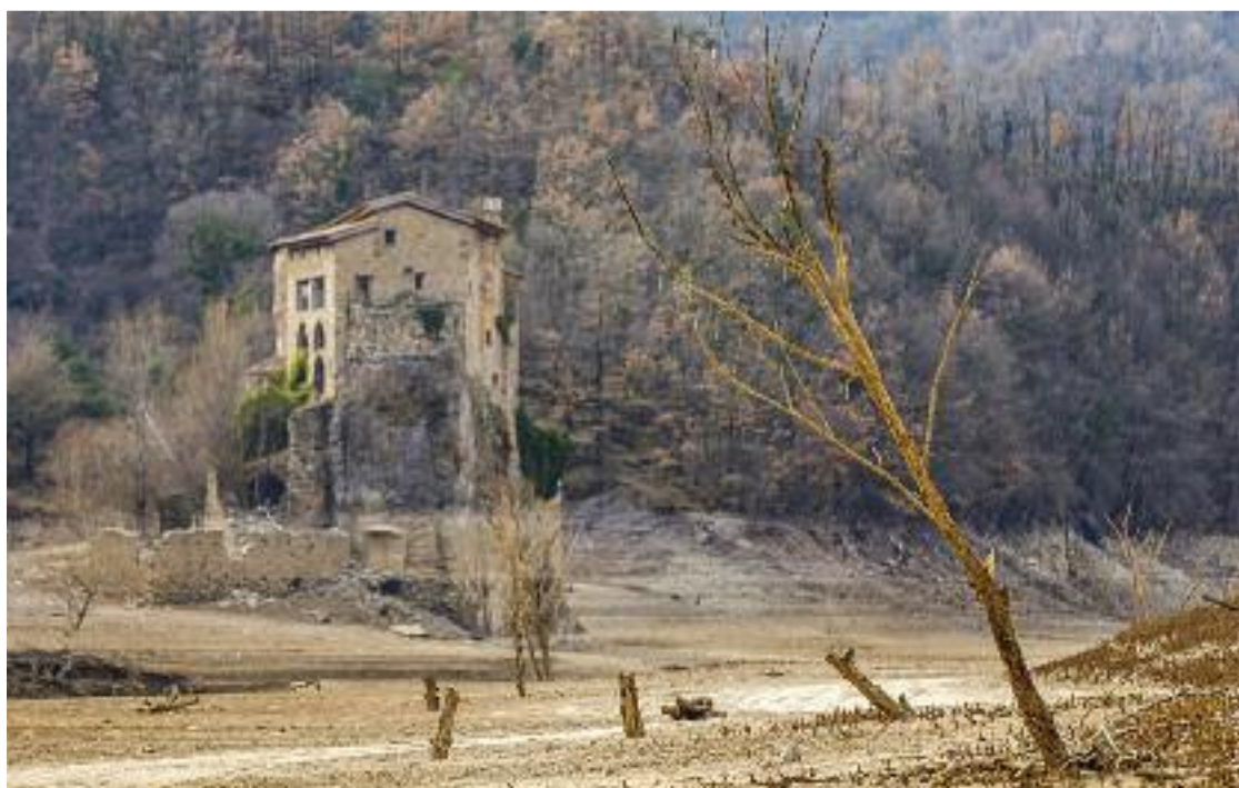
El pantà de la Baells (Berguedà) evidencia la manca de pluges dels darrers mesos.

El canvi climàtic ens aboca a tots a col·laborar. Cada gest compta.