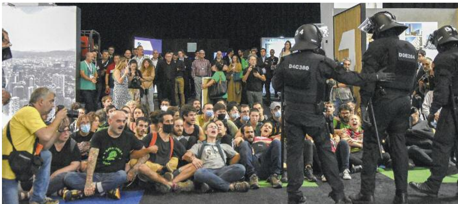
La protesta que hi va haver a la Fira de Barcelona en la inauguració de The District, el dia 19.