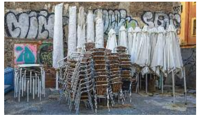
Les terrasses d'Enric Granados encara no tanquen abans.

Els organitzadors de la concentració també demanen que es retirin les terrasses ampliades arran de la pandèmia que no han estat consolidades, que es redueixi l'horari dels locals d'oci nocturn i que es controlin i se sancionin els establiments que no compleixin les normes, entre d'altres.