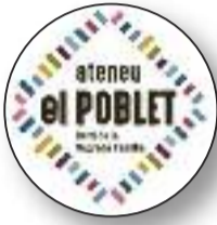
Ateneu El Poblet

L'Ateneu El Poblet va acollir dilluns una conferència organitzada per la Comissió Memòria Històrica El Poblet sobre l'ingrés de l'escriptor George Orwell a l'Hospital de Sant Pau, després de quedar ferit a la Guerra Civil espanyola.