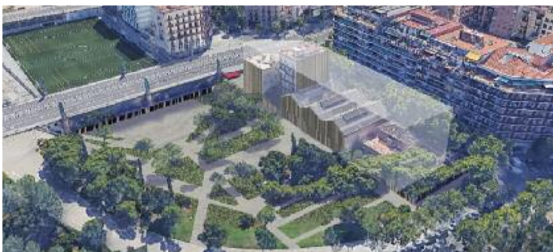
Un render de com serà l'entorn de la Casa Grogga en el futur.

aquesta suposada manca de diàleg entre Districte i entitats veïnals no és excepcional. "Tenim un problema amb el Districte: hi ha poca comunicació", lamenta. En aquest sentit, assenyala el fet que l'Eixample ha tingut cinc regidors en sis anys, una conjuntura que creu que ha estat perjudicial.