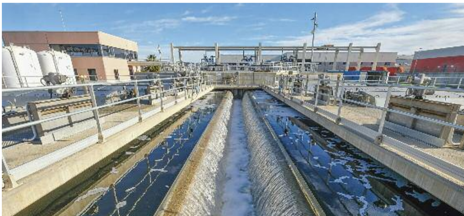
L'aigua regenerada, com la que s'obté a la depuradora del Baix Llobregat, és clau per a la resiliència de les ciutats.

Això inclou la implementació de plaques solars i pèrgoles de captació fotovoltaica a les instal·lacions de la companyia, així com la valorització dels fangs (un residu ric en matèria orgànica) generats a les estacions de depuració d'aigua, per transformar-los en ecocombustibles com el biogàs. Tres d'aquestes instal·lacions uti-