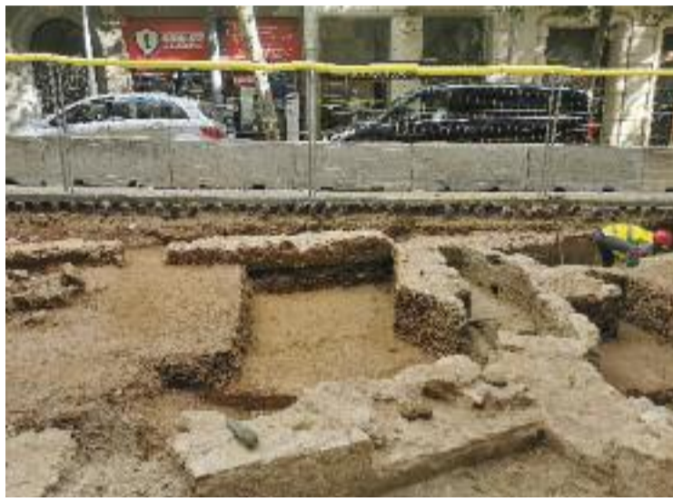
L'antiga masia, a la confluència de Girona amb Diagonal.

Tal com ha informat l'Ajuntament, es tracta de "diverses estructures que per ara s'inter-