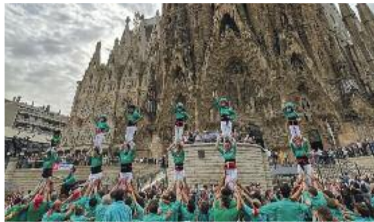
La diada castellera, davant de la Sagrada Família.

Durant la diada de diumenge hi va haver un accident lleu entre els Castellers de la Vila de Gràcia. Vuit membres de l'entitat van ser traslladats als hospitals de Sant Pau i Dos de Maig “per prevenció”, tal com van dir des de la colla amfitriona. Totes dues colles lamenten “l'alarmisme” que, segons ells, van crear els mitjans.