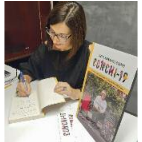
Dues imatges de la presentació del llibre ‘Conchi-19’, a la Biblioteca Sofia Barat.

exemple, la Nuria del llibre també és treballadora social, però ho és d'una residència de la Dreta de l'Eixample. “Volia que es veiés la importància d'aquesta professió i alhora plasmar el dia a dia a les residències en aquell moment”, recorda, motiu pel qual va parlar amb treballadores de geriàtrics i personal sanitari.