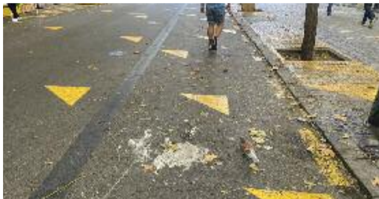
L'estat de la superilla preocupa els veïns.