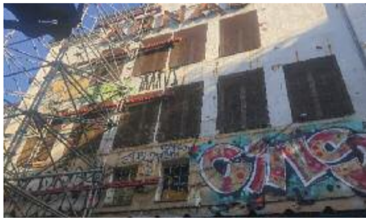
L'edifici està molt deteriorat des de fa temps.

Des del 2018 hi ha un projecte aprovat, però, arran de la pandèmia, la inversió d'11,6 milions d'euros va quedar congelada. Des de l'Assemblea Teatre Arnau es mostren decebuts amb la situació i tenen clar que la partida econòmica no s'aprovarà definitivament fins passades les eleccions municipals del 2023.