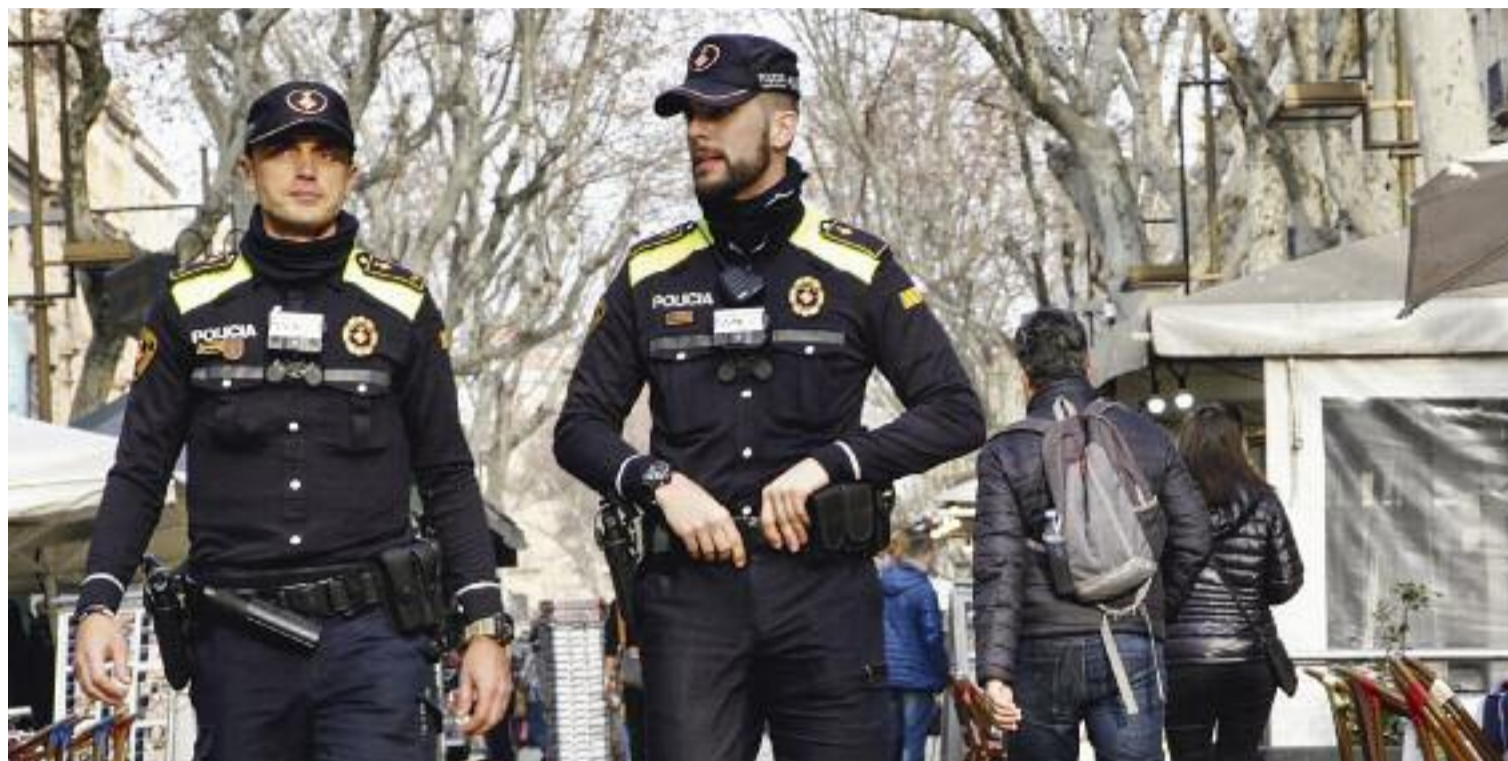
Dos agents, amb les càmeres situades a la zona del pit.

Més enllà de les característiques tècniques, a mitjans de setembre, la Sindicatura de Greuges de Barcelona, en la presentació del seu darrer informe sobre la Guàrdia Urbana, va valorar molt positivament la introducció de les càmeres al cos policial. "D'ençà que s'han introduït les càmeres s'ha reduït el nombre de queixes de la ciutadania cap a la policia",