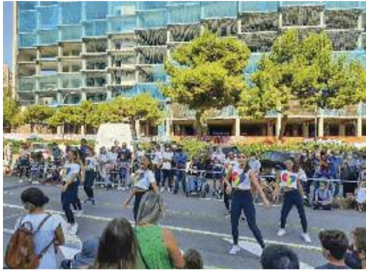
Un dels moments de la festa de l'any passat.

Per començar la festa grossa amb bon humor, l'associació veïnal ha escollit tota una estrella per fer el pregó: la cupletista Brigitta Lamoure, l'alter ego de David Cano. "És el primer barri que compta amb mi com a