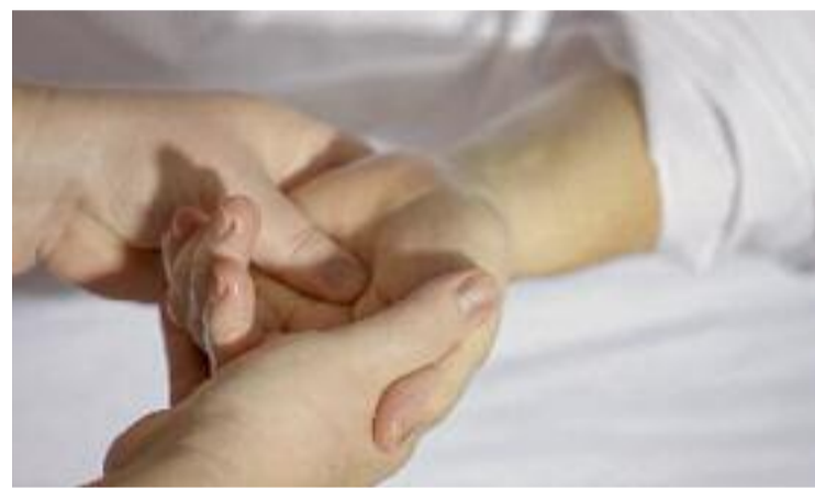
Entre les activitats hi ha una sessió dedicada als massatges.

A més, com a novetat, Coreixample ha organitzat un sorteig d'un cap de setmana saludable a l'Empordà. Hi poden optar tots els participants a qualsevol de les activitats programades en el marc de la Setmana de la Salut i inclou dues nits a una masia, un tast de vins i un vol amb avioneta.