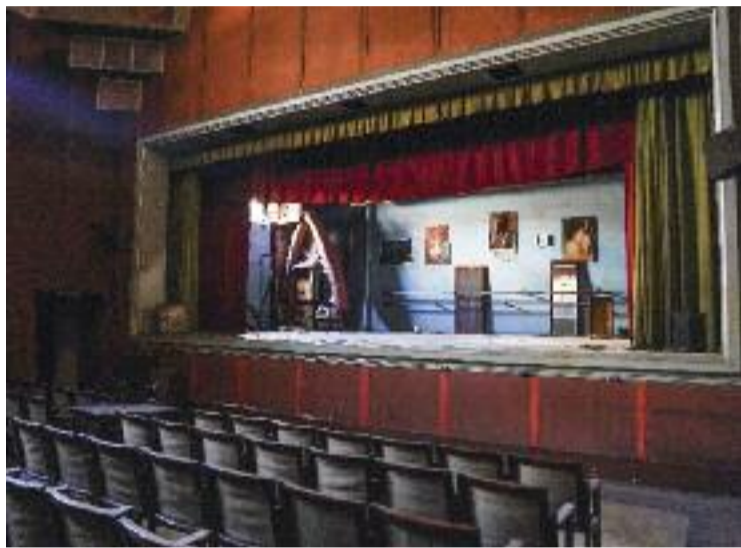
El teatre que hi ha a l'interior del temple del carrer Bailèn.

L'Ajuntament va adquirir aquest edifici històric del carrer Bailèn el juliol del 2020, després d'anys de lluita veïnal per recuperar-lo com a equipament per al barri. El mateix any, els veïns van presentar una proposta a la plataforma decidim.barcelona per convertir-lo en un ateneu, però no va ser acceptada perquè l'Ajuntament considerava que calia obrir un procés de participació ciutadana per decidir-ne els usos. Dos anys més tard, aquest procés encara no s'ha obert i l'eufòria del principi està deixant pas a la impaciència.