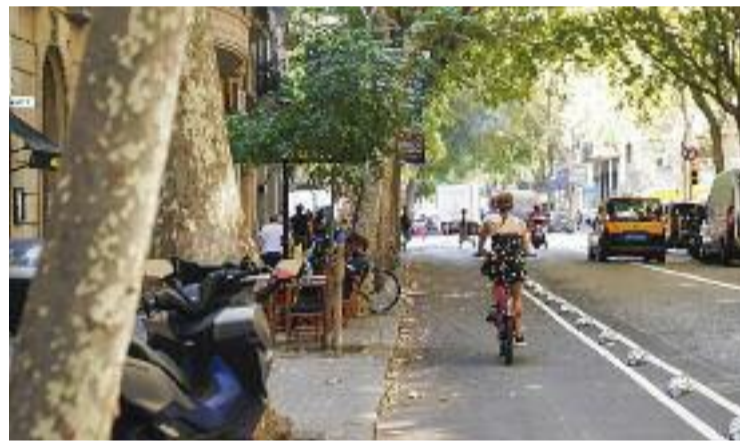
El carril bici de Manso, entre Comte Borrell i el Paral·lel.

"Inicialment, aquest carril s'havia pensat com a temporalment bidireccional, però les entitats van demanar que fos unidireccional i, com que la configuració del carrer ho permetia, va passar a ser d'un únic sentit, mantenint l'amplada". Aquesta és l'explicació que ha donat l'Ajuntament davant els dubtes (i diverses crítiques) que ha generat l'estrena del carril bici del carrer Manso, que, per altra banda, té tots els números per convertir-se en un dels preferits dels ciclistes barcelonins.