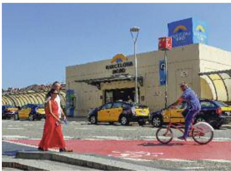
La reforma de l'Estació del Nord va acabar a finals de 2021.

Precisament, les línies amb destinacions internacionals són les que han experimentat un creixement més destacable: han registrat un 32% més d'expedi-