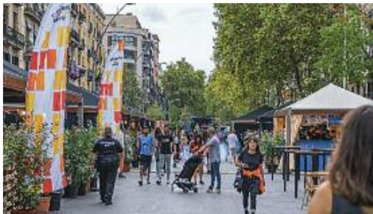
L'activitat Terra i Gust, a la ronda Sant Antoni.

Per la seva banda, el comissionat d'Economia Social, Desenvolupament Local i Política Alimentària, Álvaro Porro, defensa el paper de l'Ajuntament i recorda que es tractava d'un "esdeveniment de ciutat relacionat amb la restauració sostenible, no d'un esdeveniment de barri". Tot i això, admet l'error de no haver-ho comunicat als comerciants abans, motiu pel qual es van disculpar amb ells i van oferir sumar-se a l'activitat a alguns comerços que encaixaven amb la temàtica, com la cerveseria Bar-na Brew (Parlament, 45).