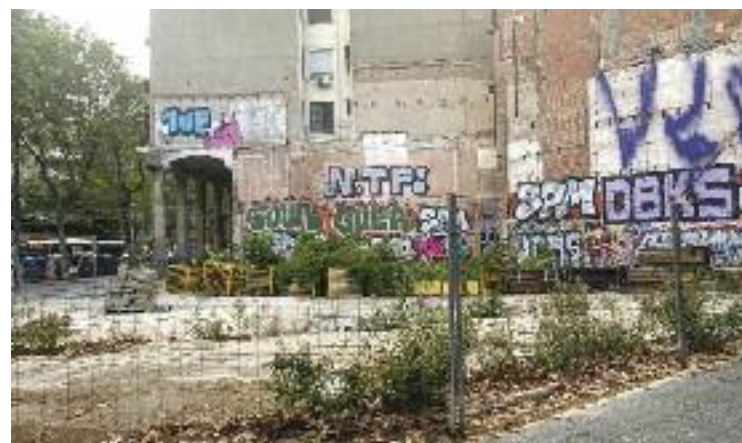
El solar de l'antic teatre Talia, al Paral·lel.

Amb tot, aprofitaran l'Audiència Pública d'aquest dijous per resoldre aquesta incògnita.