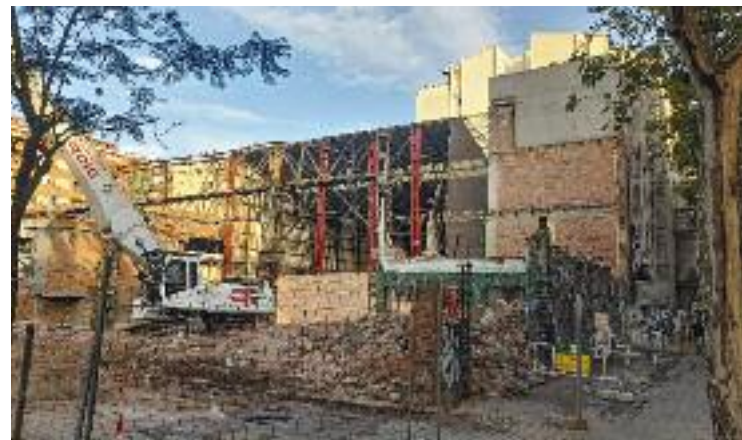
Una imatge recent de les obres.

Cal recordar, però, que el personal mèdic del centre ja va alertar fa uns mesos que el futur CAP pot quedar petit d'entrada. A banda, calculen que, com a mínim fins al 2026, no estarà a punt.