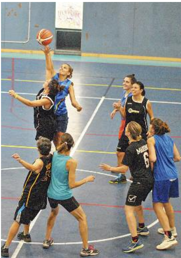
Un partit de bàsquet d'una edició passada.

"No tot és esport ni competició a Panterports, que tam-