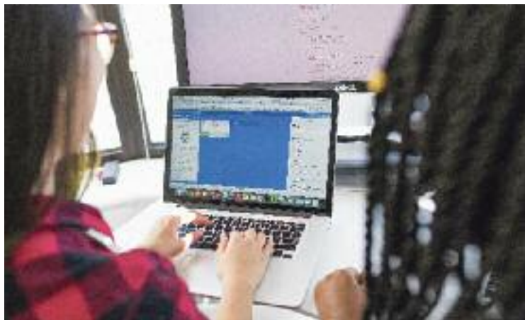
El Casal Transformadors manté aquest curs l'espai de tràmits.

Fins ara, els usuaris que acudien cada dimarts a l'espai de tràmits (havent demanat cita prèviament, això sí) rebien ajuda directa dels voluntaris per fer el procediment en línia que necessites-