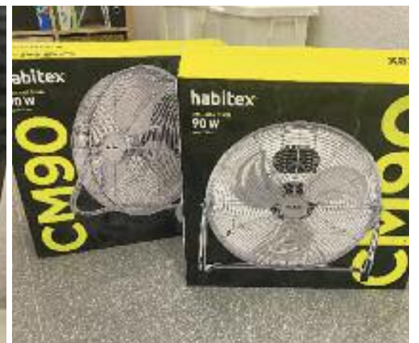
El termòmetre d'una aula de l'Escola Auró a 40 graus i els ventiladors que hi ha fet arribar Educació.

sostenible" i, de fet, han fet un registre de temperatures per enviar-lo a Riscos Laborals.