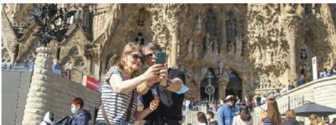
Turistes a la Sagrada Família, en una imatge d'arxiu.

Ara bé, Calzado confessa que li sap greu que els agents "només cridin l'atenció als turistes" i no als veïns que ocupen les voreres senceres en zones molt concorregudes. "Per què només se'ls exigeix això a ells? Són qui ens dona de menjar: Barcelona sense el turis-