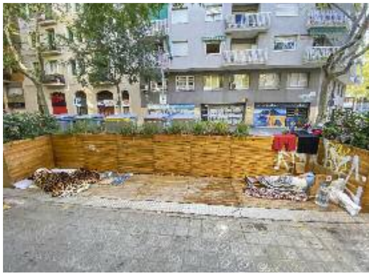
L'espai pacificat de l'Escola Aldana, a l'agost.