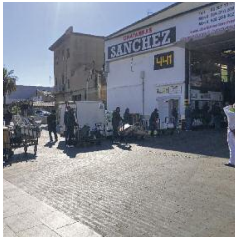
Els ferrovellers recullen la ferralla per posteriorment poder-la vendre.

bricació de productes automobilitats Aratubo, hi ha diferents motius que ho expliquen. La covid ha suposat un encariment dels productes que s'utilitzen a la indústria. La reducció del consum durant l'any 2021 va anar aparellada amb una reducció de la producció, i això va fer augmentar el preu de les matèries primeres. De retruc també va créixer el mercat de la ferralla.