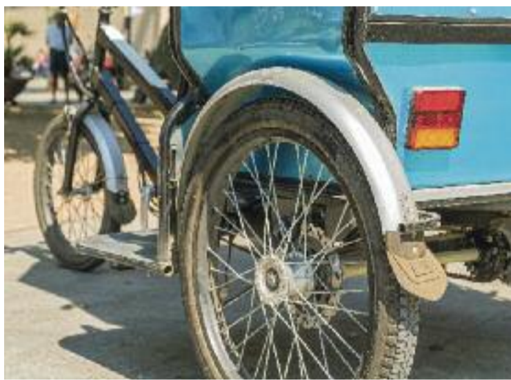
El consistori vol prohibir els bicitaxis els mesos de més turisme.

“alleugerir l'ocupació de l'espai públic” i, en definitiva, trobar un “equilibri” entre la vida quotidiana dels veïns i el turisme.