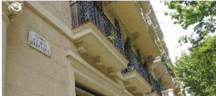
Els veïns confirmen que hi ha més soroll del permès a la nit.

“Han sigut molts anys de predicar en el desert, però per fi