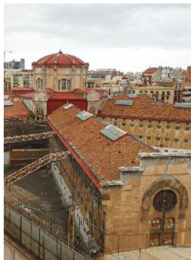
El futur del Masriera, la ronda Sant Antoni o la Model, problemes de barri que la coordinadora de l'Eixample vol abordar.