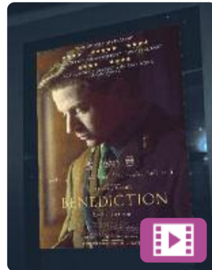
Benediction Terence Davies

Siegfried Sassoon va ser un home complex que va sobreviure a la Primera Guerra Mundial i va ser condecorat per la seva valentia. Va escriure poesia inspirant-se en el que havia viscut i va ser idolatrat a Londres. Va mantenir relacions amb diversos homes mentre intentava acceptar la seva homosexualitat i va intentar buscar respostes en el matrimoni i la religió.