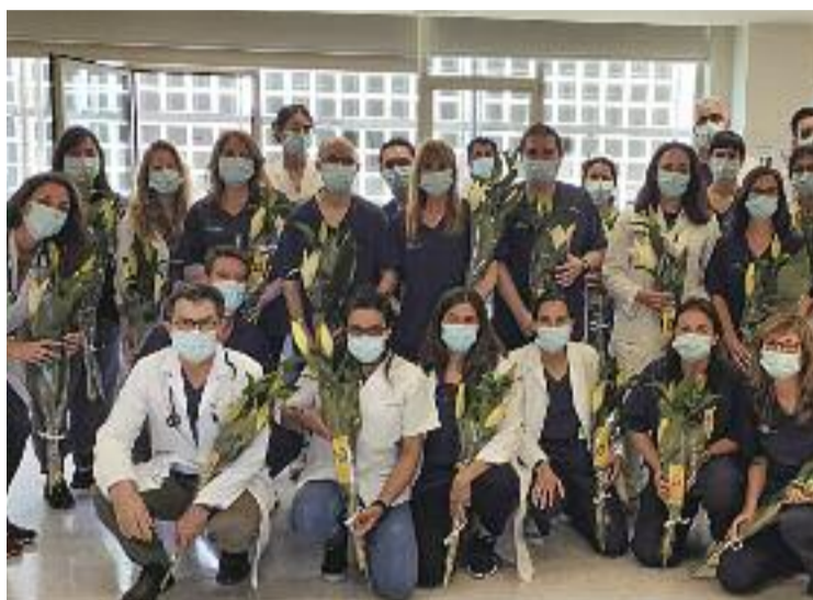
Part del personal del CAP, en una imatge d'arxiu.

D'altra banda, Zamora admet que, arran de l'esclat de la pandèmia, es van veure obligats a aturar gran part de la seva tasca relacionada amb la investi-