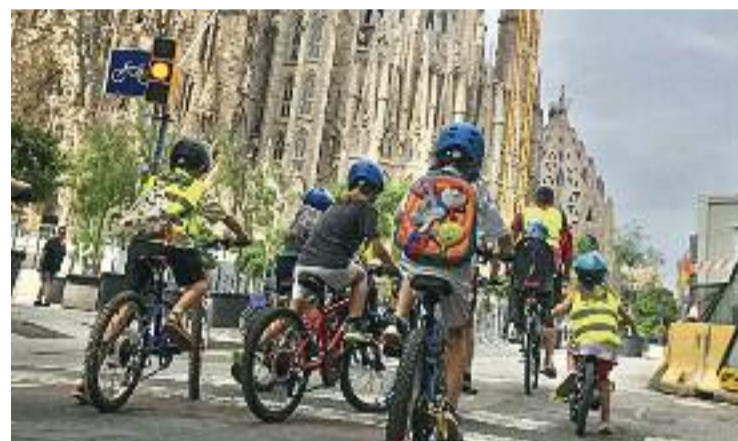
Imatge d'arxiu del bicibús de Sagrada Família.

Pel que fa a les peticions per a la resta de línies del bicibús, destaca la de l'acompanyament diari de la Guàrdia Urbana per a la línia de Sant Antoni, la de reduir la velocitat a 30 km/h a Aragó i València per millorar la línia de Consell de Cent o la d'eliminar un carril de circulació de cotxes al carrer Mallorca per afavorir la línia de Letamendi. També van demanar crear nous carrils bici a Padilla i Independència, en aquest cas per a la línia Diagonal.