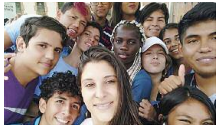
Un grup de joves del programa.

Arran de l'esclat de la guerra a Ucraïna, aquest projecte s'ha ampliat per arribar també als refugiats ucraïnesos que han vingut a la ciutat en els últims mesos, buscant asil i fugint del conflicte. Així doncs, aquesta vegada ‘A l'estiu, Barcelona t'acull’ va més enllà dels nois i noies que acaben de passar pel reagrupament familiar.