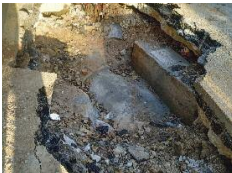
Una canonada apareguda durant la primera fase de les obres.