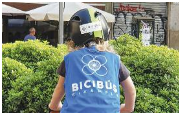
Un infant participant en un bicibús.

L'èxit d'aquesta proposta nascuda a l'Eixample per fomentar la mobilitat sostenible i segura per als infants no té aturador. "El bicibús no para de créixer!", celebraven fa uns dies des de Bicibús Eixample a Twitter, quan anunciaven la futura línia del Fort Pienc. I el cert és que no només creix al districte i a la ciutat, sinó arreu de Catalunya i més enllà.