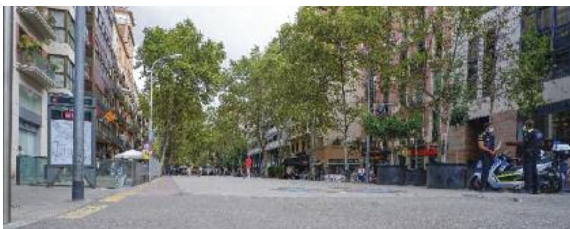
La retirada de la llosa de la ronda està prevista per al novembre.

Sigui com sigui, Caballé intueix que el procés de participa-