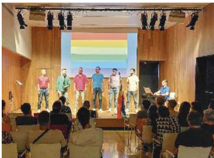
Un moment de l'acte 'Cantem amb orgull'.

CULTURA ▶ Les cançons són molt més que música, són referents amb els quals tothom es pot sentir identificat i part del món. És per això que és important que el Casal Transformadors acollís el dijous passat l'acte 'Cantem amb orgull', que va anar a càrrec del cor de veus masculines Ensamblats. Tal com expliquen des d'Ensamblats, l'acte va consistir a convidar a tothom qui volgués a pujar a l'escenari per cantar i recitar cançons i poemes LGTBI que, d'alguna manera, els haguessin marcat o haguessin representat un fet important en les seves vides.