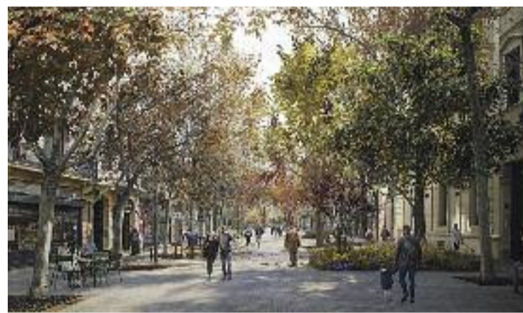
La configuració del trànsit canviarà per sempre.

Aquesta configuració del trànsit és la que tindran de manera definitiva els quatre eixos verds de la superilla quan siguin una realitat i hagin transformat el districte. També és la que fa anys que funciona a les superilles del Poblenou i Sant Antoni.