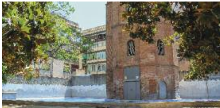
La platja de l'Eixample era a la Torre de les Aigües.

Per part seva, des de l'Associació de Veïns de la Dreta de l'Eixample reconeixen que el veïnat no veu amb bons ulls no tenir cap piscina. Alhora, però, són cons-