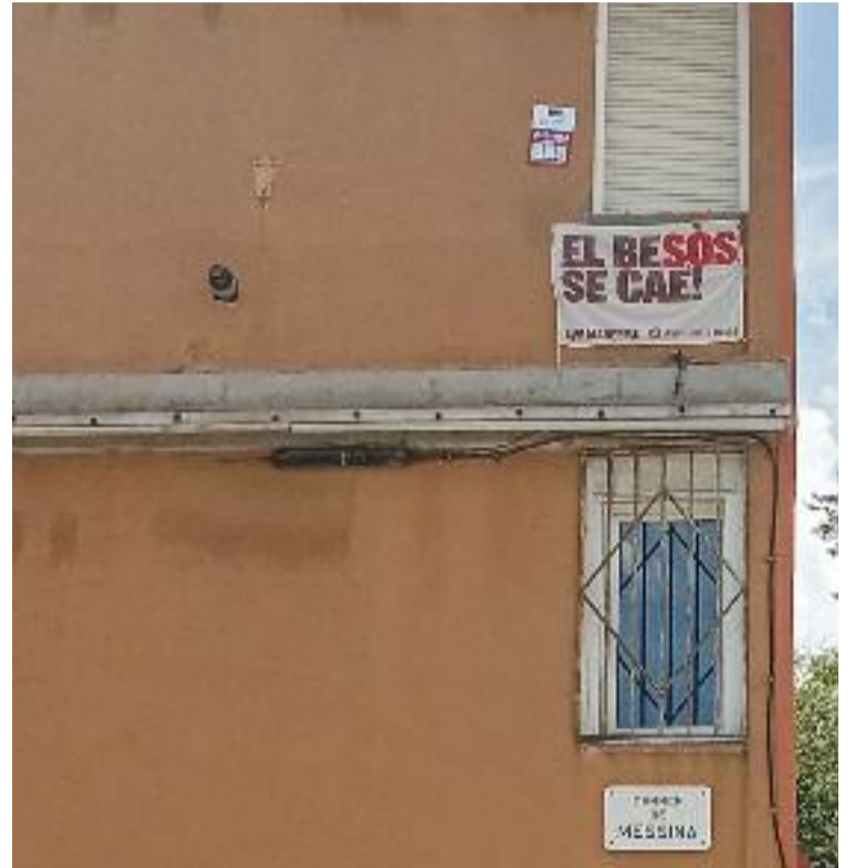
El barri del Besòs i el Maresme és un dels llocs de la ciutat on hi ha pisos amb més mal estat.