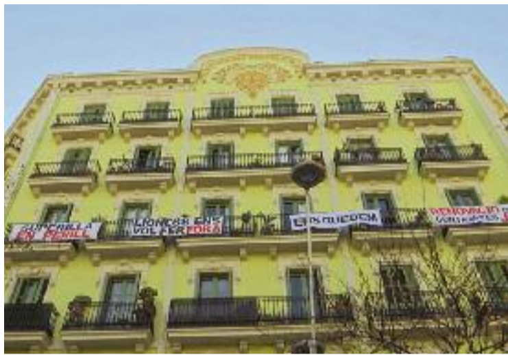
La propietat vol negociar amb els veïns.