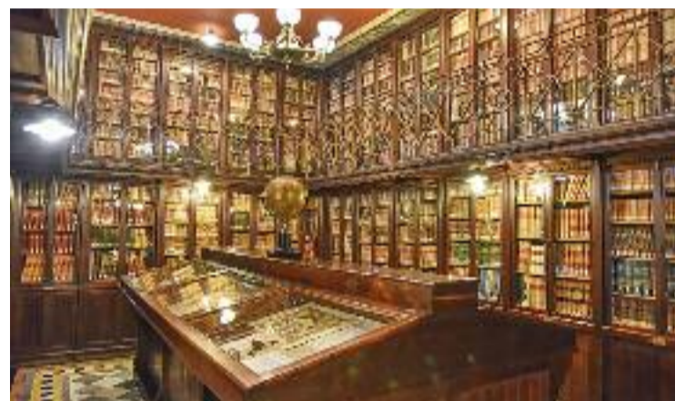
La biblioteca té 125 anys d'història.

La idea és explicar en aquests recorreguts la història de la biblioteca des que va ser fundada el 1895. Com que cap edifici, equipament ni racó de la ciutat és aliè al seu entorn ni als canvis socials, es relaciona la seva història amb els moviments socials que van tenir lloc a la Barcelona de finals del segle XIX i del XX. A més, també es poden trepitjar totes les sales històriques de la biblioteca i conèixer la col·lecció més gran de l'Espanya dedicada al detectiu de ficció Sherlock Holmes.