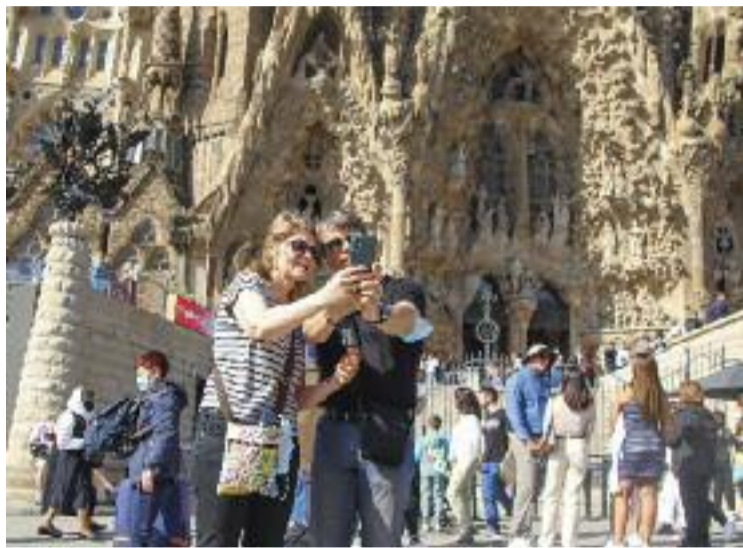
El turisme ha tornat amb força al barri.

“El problema no és que els grups que van amb guies oficials siguin de màxim 15 persones – com a Ciutat Vella– o de 30 – com a la resta de la ciutat i a Sagrada Família–, sinó que ni els guies oficials ni els no oficials els demanin ocupar menys espai de les voreres”, recalca Mercadal. A més, alerta que els grups de creueristes poden superar les 30 persones. Aquesta situació, afegeix, es veu agreujada per les ampliacions de terrasses de bars fetes durant la pandèmia. En tot el barri, recorda, només