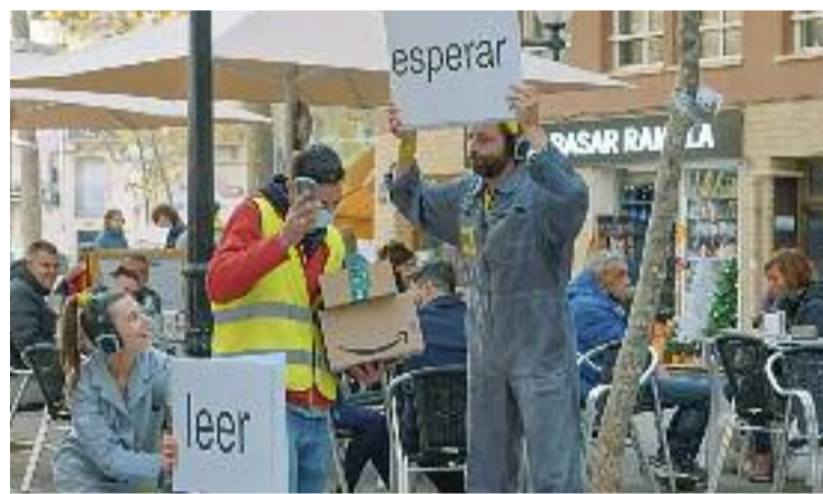
Eléctrico 28 seran els protagonistes el 12 de juliol.