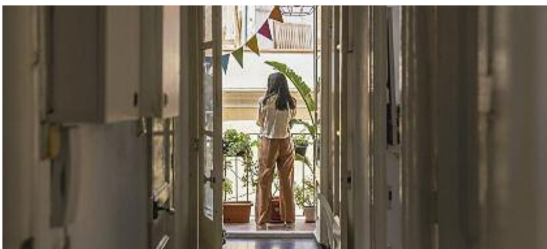
Un de cada tres joves d'entre 16 i 24 anys se sent sol.

En aquest sentit, diu López, que és Doctor en Psicologia, hi ha casos de persones que poden arribar a substituir les relacions físiques "presencials" per interaccions a les xarxes socials. "Llavors és quan es converteixen en una presó, un engany o una trampa", afirma. Aquest comportament pot tenir diferents orígens. Un d'ells és sentir benestar sense exposar-se als riscos que tenen les relacions en el món real. "Es pot evitar, per exemple, que es fixin en la imatge d'un mateix o una situació en la qual no se sap què dir", diu López.