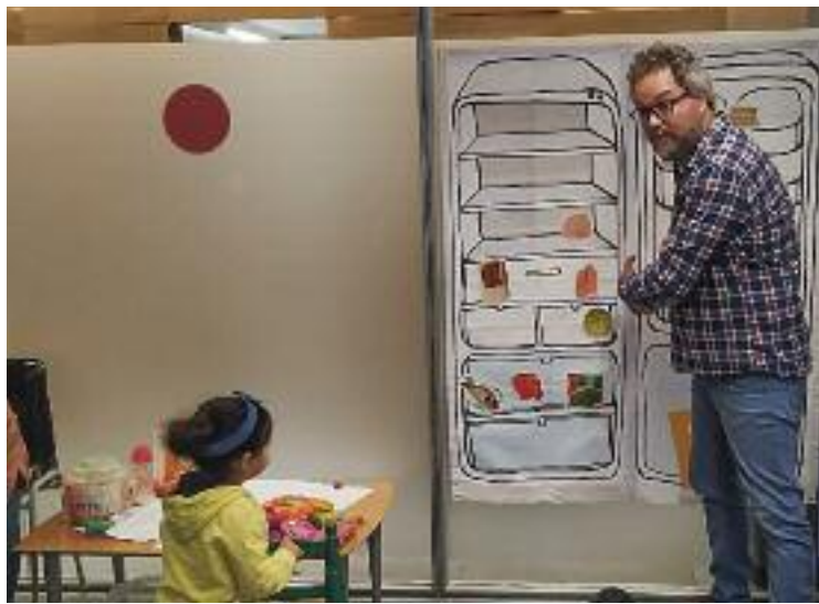
La presentació del Bon Reaprofit.