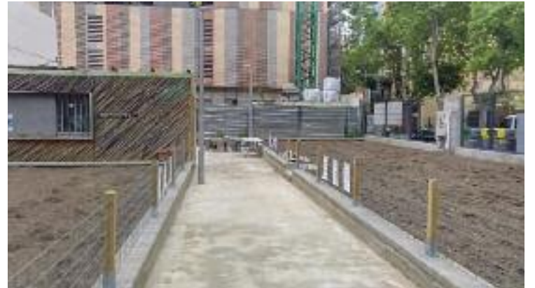
Les obres van començar l'octubre passat i han acabat ara.

Des de Lioness Inversions lamenten "l'actitud intransigent" del Sindicat, a qui acusen de voler "mediatitzar una actuació que, des de bon inici, s'ha fet estrictament sota el marc legal vigent".