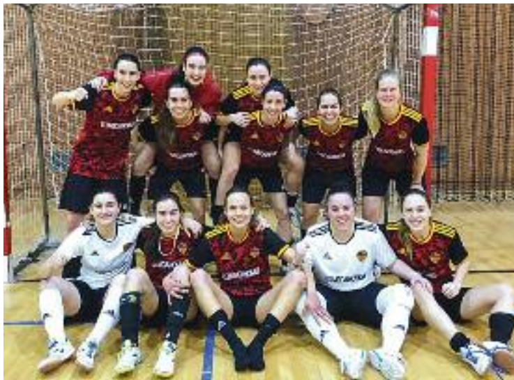
El CFS Eixample, després d'un partit.

Dues jornades abans del final de la primera volta, i just després de la cinquena derrota, contra el CN Caldes, el CFS Eixample va passar una altra mala ratxa. Continuava tenint un bloqueig en