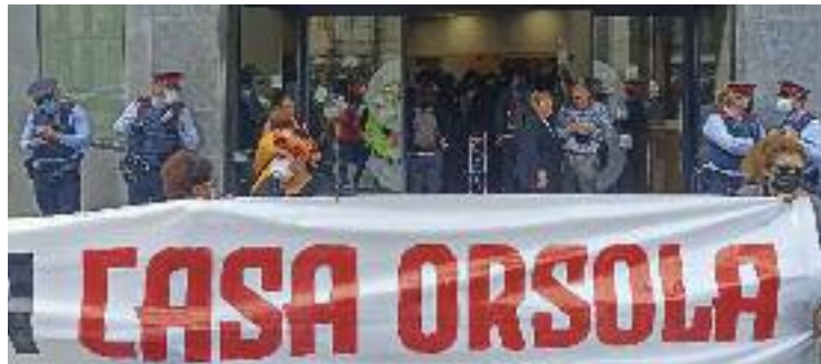
Dimecres van ocupar la seu de la propietat.

La trobada que s'hauria d'haver produït dijous al matí era la proposta que el fons Lioness Inversions, propietari de la Casa Orsola, havia fet als llogaters el dia anterior a canvi que marxessin de la seu de l'empresa, que havia estat ocupada per un centenar de persones en senyal de protesta. L'objectiu dels activistes i llogaters que havien ocupat l'oficina era negociar la renovació dels contractes de lloguer dels veïns d'aquesta finca, situada al xamfrà del número