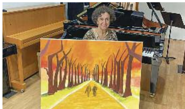
La botiga Audenis participa en la 22a Mostra d'Art Jove.