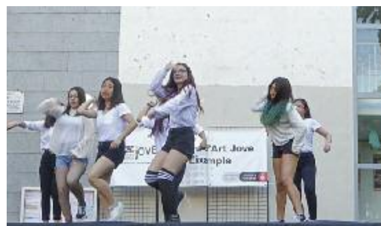
Joves ballant K-pop a la plaça Fort Pienc.

A més, la proposta va comptar amb la col·laboració i la presència de Korea en Barcelona, una entitat que difon la cultura coreana a la ciutat i que va instal·lar una parada a la plaça Fort Pienc per oferir als curiosos una targeta amb el seu nom escrit en coreà.