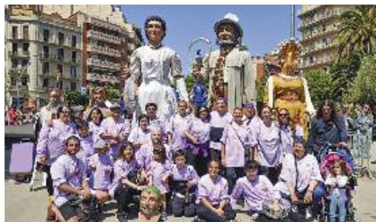
La diada gegantera.

Benach també valora la "bona predisposició i col·laboració" de veïns i entitats, i posa d'exemple el sopar popular, que s'havia de fer al carrer Marina i a última hora es va traslladar a l'Ateneu pel vent i la previsió de pluja.