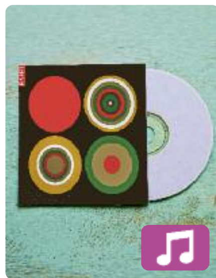
1963 Els Pets

Els Pets han publicat el seu tretzè àlbum, 1963 (RGB), "un disc sense colorants", on toquen "només els membres del grup, en una aposta austera amb poca instrumentalització", ha explicat el cantant de la banda, Lluís Gavaldà, en una entrevista a l'ACN. El mític grup de Constantí considera que amb aquest nou treball han retornat a la seva essència.