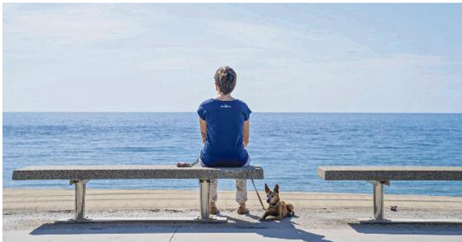
El Consell de Col·legis Veterinaris de Catalunya té registrats 174.111 gossos vivint a Barcelona.

L'Ajuntament justifica aquestes prohibicions, diu Coll, principalment per preservar la biodiversitat dels espais. Des del seu punt de vista, però, no és una posició coherent, ja que els animals que van lligats no tenen per què malmetre més la biodiversitat que qualsevol persona. "La cosa no hauria de ser entrar als espais verds amb animals o sense, sinó saber estar-hi amb aquests", recalca. Els jardins del Turó Park, afegeix, és un dels casos en els quals es va fer servir "l'excusa" d'evitar la