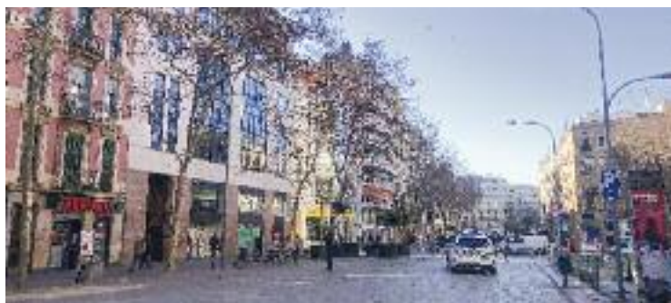
La llosa de la ronda ha estat motiu de queixes veïnals.