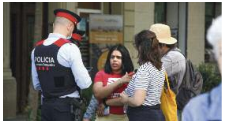
La veïna desnonada parlant amb les autoritats.

La setmana passada hi va haver una trobada entre entitats i Districte per fer balanç del funcionament de la superilla de Sant Antoni. Entre altres coses, es va parlar del nou horari de càrrega i descàrrega (de 9.30 a 16.00 hores) o de la necessitat de tenir una senyalització més clara i més presència d'agents cívics.