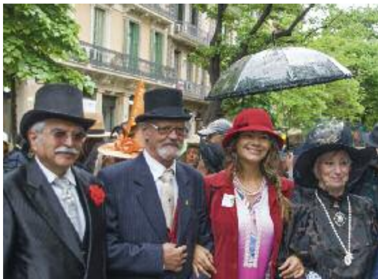
Una imatge de l'edició de 2019.