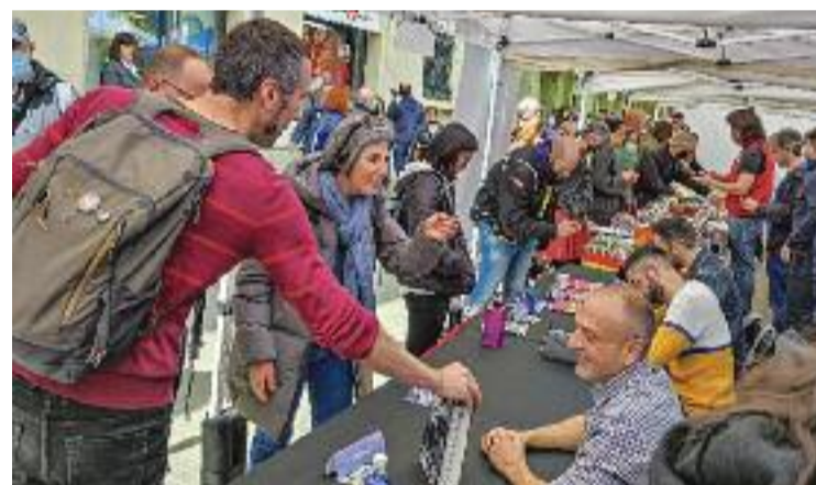
Un moment de la diada a la parada de Norma Comics.

D'altra banda, a Puig li resulta impossible dir si el manga ha guanyat pes en les darreres diades, ja que afirma que "el gran augment" s'ha produït en el darrer "any i pico". Del que sí que està segur és que aquesta major popularitat ha estat conseqüència de la pandèmia, que ha fet que "més gent s'hagi quedat a casa mirant sèries" i de la gran quantitat de sèries i pel·lícules d'anime que Netflix ha pujat a la plataforma. "El manga està atraient molta gent jove, esperem que continuï així", diu.