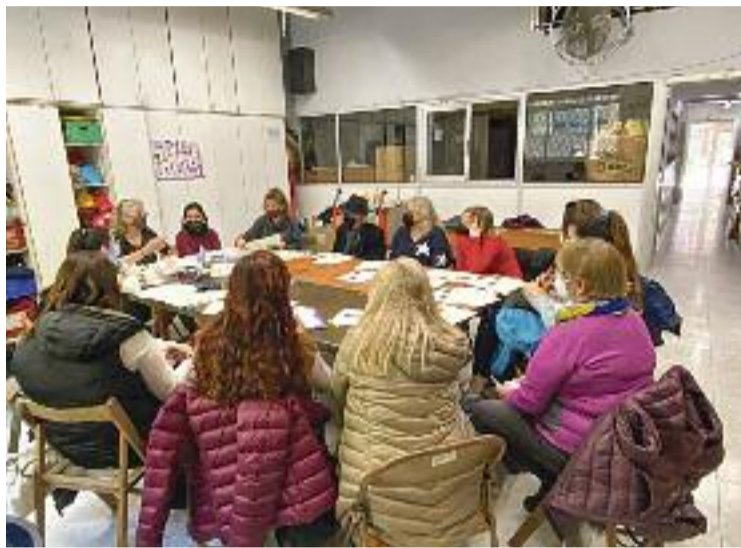
Una reunió de la preparació del projecte.

L'objectiu, assenyala, és formar en atenció a la violència masclista la xarxa d'equipaments, entitats i comerços de Sant Antoni perquè puguin atendre dones que pateixen violència, sigui en detectar que la pateixen o després que aquestes hagin demanat ajuda. Abans, però, indica, la idea és escollir quins seran aquests espais, els quals s'anomenaran punts liles, preguntant a diverses dones on anirien en una situació així. Això no és tot. Un altre re-