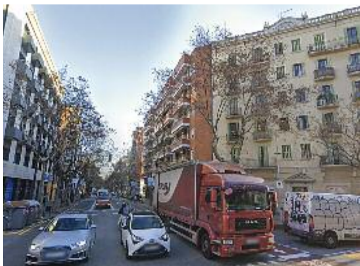
El trànsit augmentarà a Mallorca amb Castillejos.

Al mateix temps, però, els estudis asseguren que aquests augments del trànsit no suposaran un increment de la congestió que l'Eixample pateix a