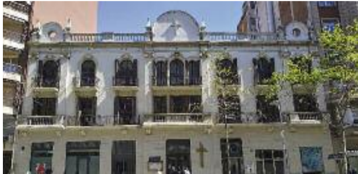
Una imatge actual de l'edifici.

Tal com explica el sociòleg i antropòleg estudiós del cooperativisme obrer, Marc Dalmau, l'edifici el van construir el 1931 els integrants de la cooperatista i va ser escenari del gran poder que va