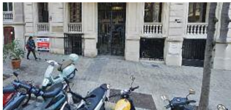
El local està situat al número 144 del carrer Bruc.