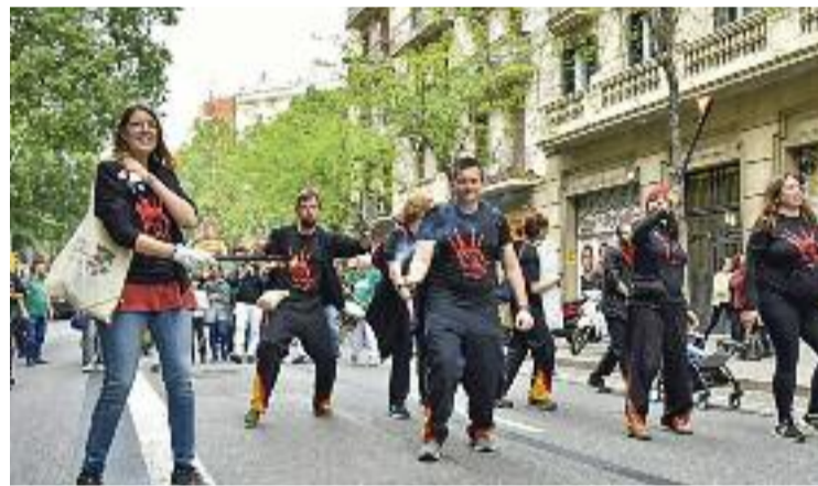
Un moment de la cercavila de la Festa Major.