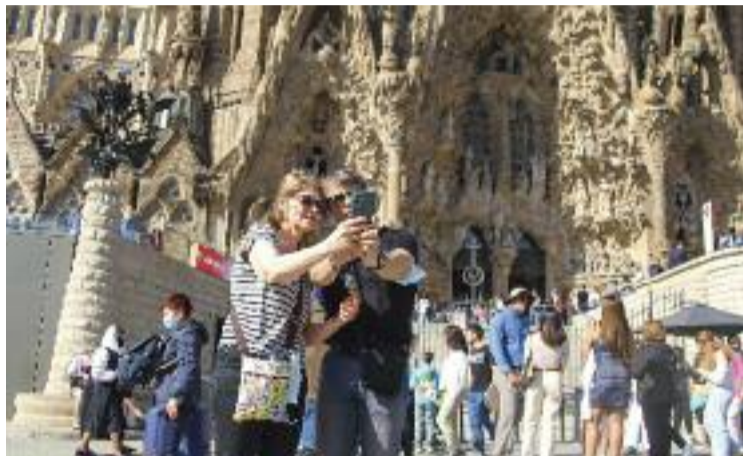
Turistes al barri durant la passada Setmana Santa.

Davant d'aquesta realitat, és clau trobar maneres de millorar la convivència entre el turisme i el veïnat, la qual cosa, afirma, es vol