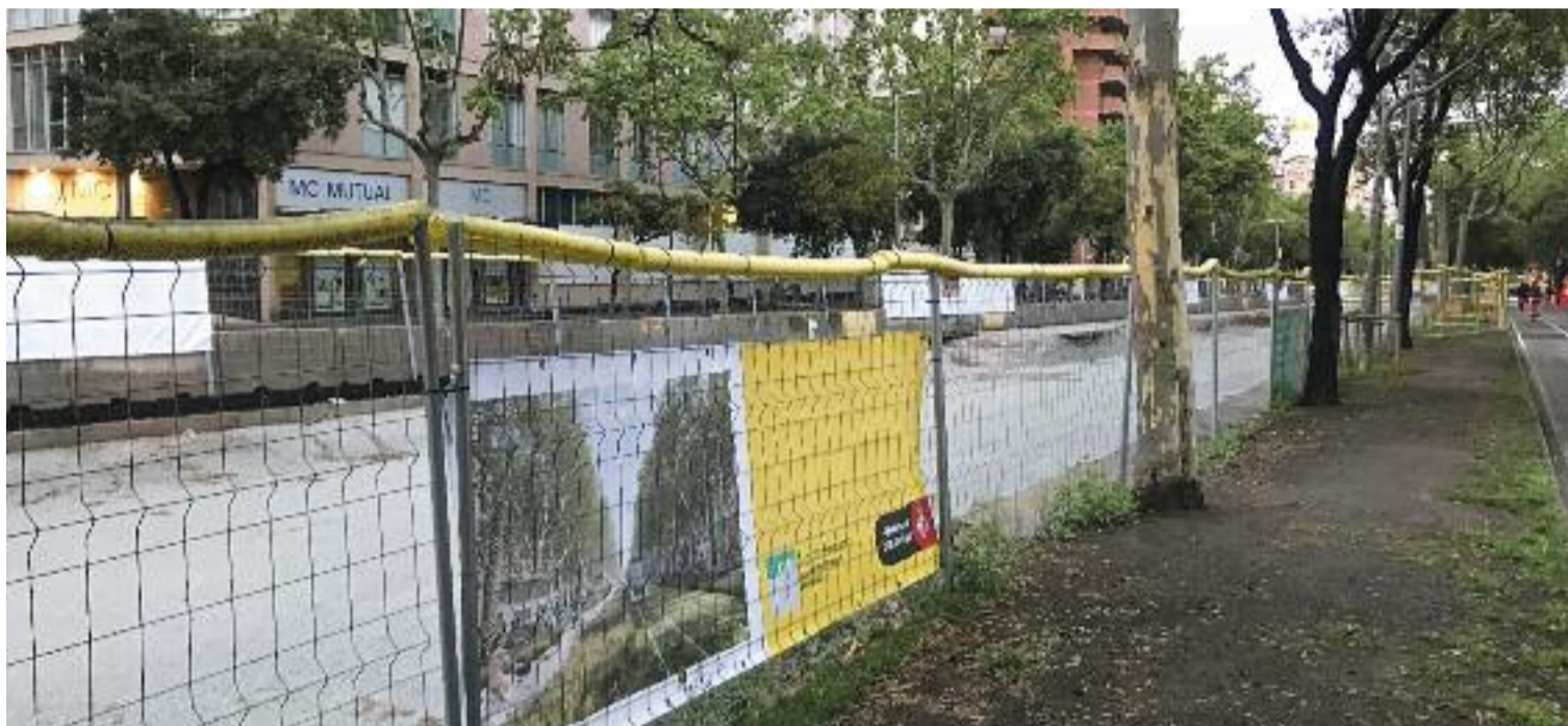
La del Tramvia és una de les obres més importants del final del segon mandat d'Ada Colau.

El nombre de projectes que han arrencat el darrer any no deixa lloc a dubtes. Tal com ha pogut