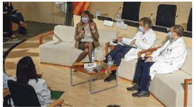
Un moment de la presentació del llibre.

que el va presentar divendres passat a l'Hospital Clínic. A Cascán, explica, li agradaria que les seves pàgines ajudessin a recordar les bones intencions que tant persones van demostrar tenir al principi de la pandèmia. “Hem de recordar com ens ajudàvem. No podem perdre aquella solidaritat”, afirma. Paral·lelament, insisteix, en aquells moments totes les persones van lluitar d'alguna manera, fos des de dins o fora d'un centre sanitari. “Un exemple són les persones que fabricaven material de protecció per als sanitaris”, destaca.