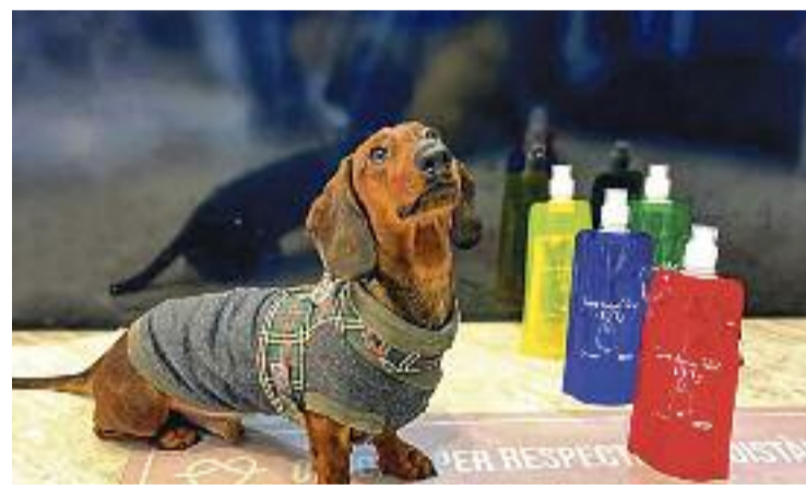
Ja s'han repartit 5.000 ampolles.

Tot i que la presència dels gossos a la ciutat és un tema que a vegades pot generar algun conflicte, amb aquesta campanya està passant tot el contrari. La resposta dels botiguers i dels clients, afegeix Arias, està sent molt bona. "La gent demana les ampolles i valora molt positivament la iniciativa", assenyala satisfet de contribuir a reduir la presència d'aquest acompanyant incòmode dels gossos.