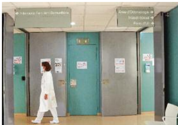
Fa setmanes que no es registren els casos lleus.

El que no queda clar, però, és si ara hi ha més o menys casos que al mes de març. Els canvis en la manera de comptar-los, reconeix, fan que no es pugui saber. Tot i això, afegeix, té la percepció "subjectiva" que s'atenen menys persones de risc —les úniques a les quals es fan proves—. Pel que fa a la relaxació de les mesures, Martínez ho viu de manera "positiva" personalment. "Veig bé no sortir de casa amb tensió o no ha-