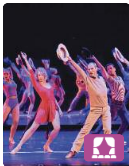
A Chorus Line Antonio Banderas

Un dels musicals més importants de tots els temps, inspirador, apassionant i amb un cos de ball espectacular. En un teatre buit, en un escenari nu, s'hi fa el càsting per a un nou musical de Broadway. Per a un grup de ballarins, és el moment de la seva vida, l'oportunitat per fer el que sempre havien somiat en gran: ballar. Al teatre Tívoli de Barcelona.