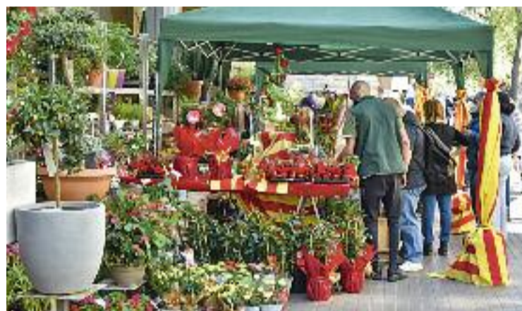
Hi haurà 300 parades arreu de la ciutat.

Hi haurà venda de llibres i flors i firmes de llibres en diferents carrers de la superilla, tot i que el passeig de Gràcia serà el punt on tindran més presència. Per part seva, les associacions i les entitats s'instal·laran a la rambla Catalunya. D'altra banda, pels qui vulguin gaudir de Sant Jordi abans de la diada, és important saber que demà i divendres els comerços de flors i llibres ja podran muntar les parades a davant de les seves botigues. Això vol dir que demà en alguns carrers ja es respiraran aires de Sant Jordi.