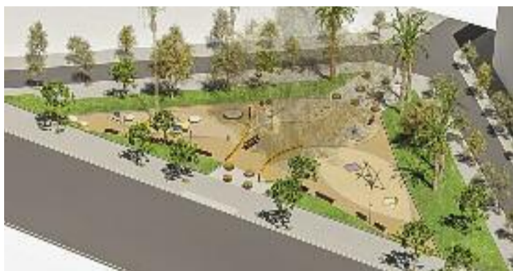
El disseny del projecte de la plaça del Doctor Letamendi.

Un altre dels projectes previstos és la pacificació de tres xamfrans del carrer Aragó, que es troben a les cruïlles que hi ha amb els carrers Viladomat, Entença i Comte Urgell, on es faran reformes basades en l'urbanisme tàctic. Per a Vey, en aquest cas la mesura també és bona, però