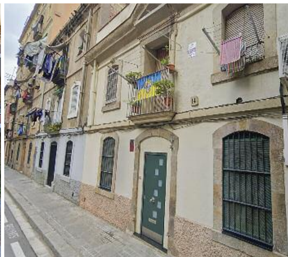
Al carrer Valero (esquerra), a Sant Gervasi, hi ha pisos de més de 230 metres quadrats i al carrer Alcanar (la Barceloneta) hi ha alguns dels pisos més petits de la ciutat.