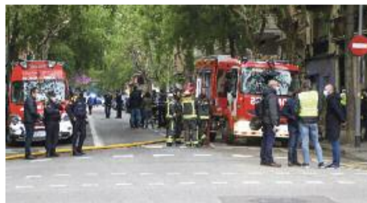
Els Bombers treballant en l'extinció del foc.

L'explosió va afectar fins a vuit finques, però especialment, és clar, l'edifici on hi ha el bar. Sobre aquest bloc del carrer València, l'Ajuntament estima que no serà habitable durant un temps llarg. "És un procés de mesos", va dir el cap de guàrdia dels Bombers de Barcelona, Víctor Molinet, tal com recull l'ACN.