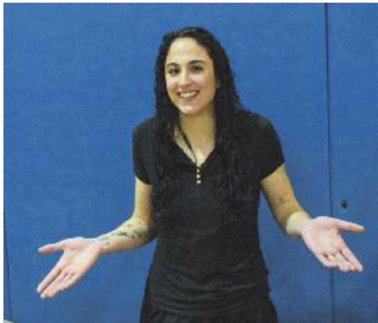
Gili, jugadora del GEiEG Bàsquet, al Pavelló Almeda.

De petita jugava a futbol i quan plovia no podia entrenar-se, i anava al pavelló a veure les pràctiques de bàsquet dels seus