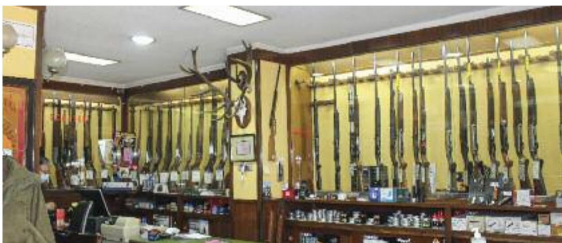
L'Armeria Izquierdo marxarà a l'Hospitalet en aproximadament sis mesos.

L'Armeria Izquierdo va néixer el 1909, quan els avis del marit de Casals van obrir les portes d'aquest local. Més d'un segle després, indica, moltes armeries han tancat a Barcelona. Ara es venen menys productes per caçar o practicar el tir de precisió que durant els anys vuitanta. Una de les raons que hi ha darrere d'aquests fets, recalca Casals, és que amb el pas dels anys sempre hi ha canvis de mentali-