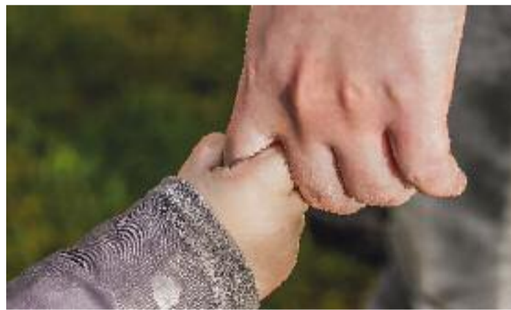
Les sessions s'adrecen a famílies amb fills de 0 a 6 anys.

L'accés a aquesta formació és gratuït, però les places són limitades, de manera que cal inscriure-s'hi prèviament per correu.