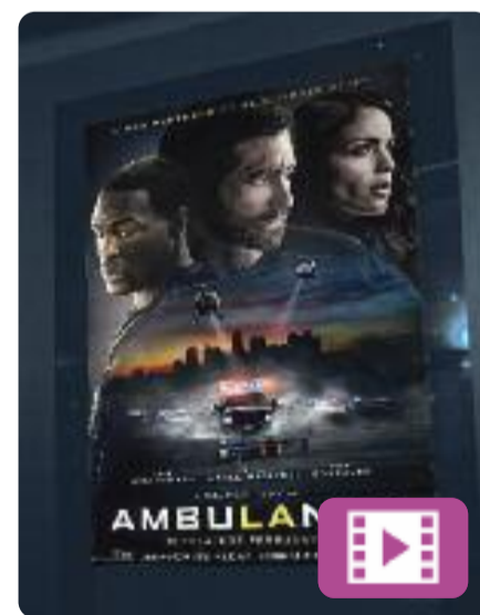
Ambulance Michael Bay

En un acte desesperat per aconseguir diners per pagar els deutes mèdics de la seva dona, el veterà Will Sharp recorre a l'única persona a la qual sap que no hauria de recórrer: el seu germà adoptiu Danny. Ell li oferirà participar en el robatori més gran de la història de la ciutat. Quan la fugida s'esguerra, tots dos segrestaran una ambulància que porta un policia ferit.