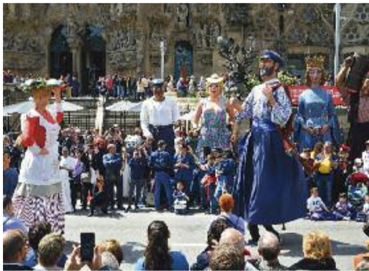
Les colles de cultura popular tornaran a sortir al carrer.