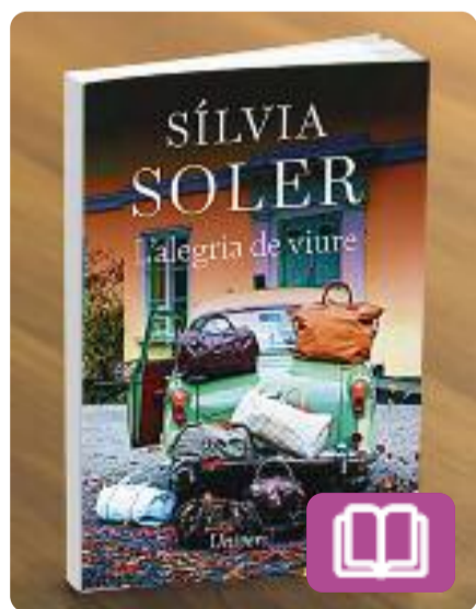
L'alegria de viure Sílvia Soler

Decididament optimista i activa practicant de la joie de vivre , Sílvia Soler recull en aquest volum deliciós un seguit d'estampes llamineres, plenes de sal de mar i de llum d'estiu. Les cases on ha viscut, les persones que ha conegut, els records plaents de la memòria particular que configuren un mapa personal que és el seu però que podria molt bé ser el nostre.