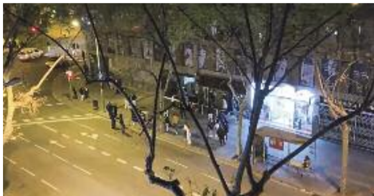
Els veïns denuncien molèsties contínues.