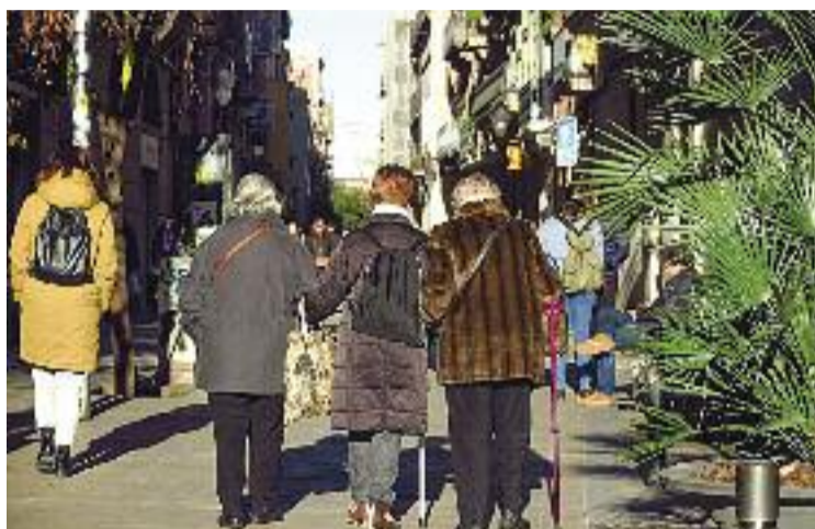
VilaVeïna s'adreça sobretot a col·lectius vulnerables.

SERVEIS ▶ El projecte municipal VilaVeïna arribarà a la Dreta de l'Eixample de cara a l'hivern d'aquest 2022, en un equipament públic encara a concretar, tal com es va anunciar durant el Consell de Barri del 24 de març. VilaVeïna, que es va crear el mes de maig de l'any passat, ja s'ha desplegat com a prova pilot a quatre barris de la ciutat i el maig d'aquest any s'ampliarà a sis barris més. Segons l'Ajuntament, és una iniciativa "pionera" que té l'objectiu de "donar suport a les persones que cuiden i a les que necessiten ser cuidades".