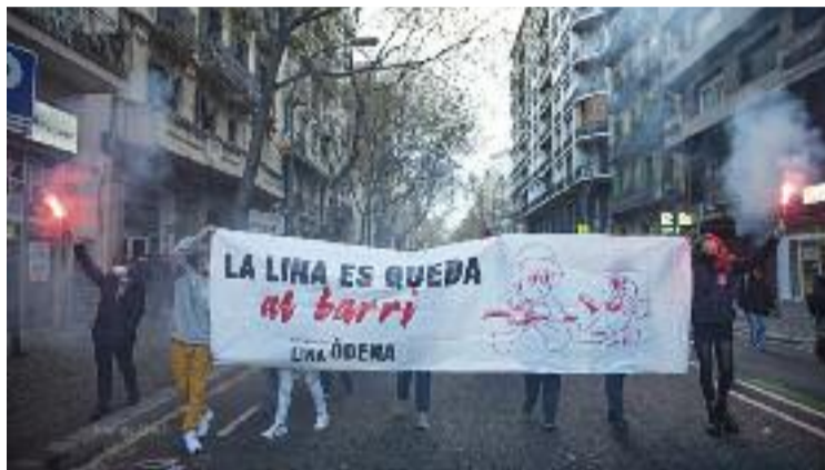
Una manifestació en defensa del casal, fa un any.

Sense especificar-ne la ubicació, asseguren que el local que han trobat "està situat al centre del barri, té un lloguer assequible i una distribució de l'espai adequada". L'han hagut de buscar pel seu compte perquè, se-