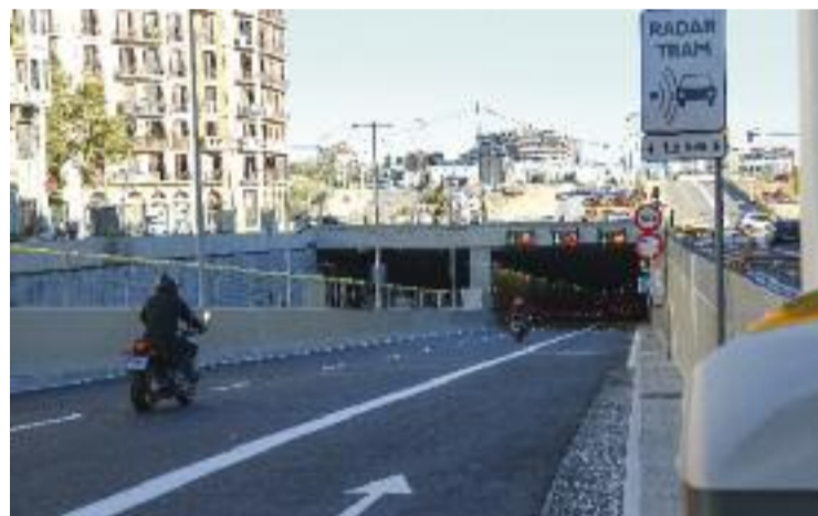
Al novembre es va obrir el túnel en sentit Besòs.

El consistori ha calculat que des de l'enderroc de l'anella viària el trànsit privat ha passat de 95.000 vehicles diaris (45.000 en sentit Llobregat i 50.000 en sentit Besòs) a 78.000 (43.000 i 35.000).