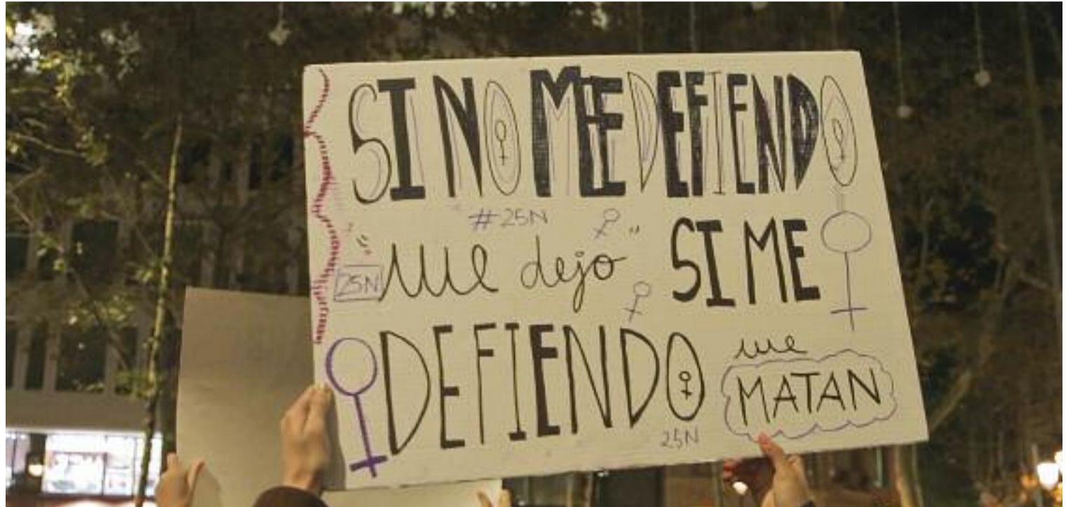
Una pancarta en una manifestació del 25N que apareix al documental 'Jo sí que et crec'.