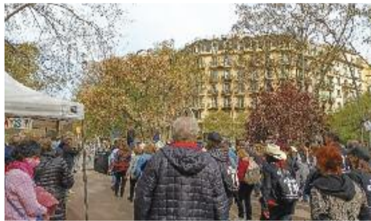
La Mostra de Comerç va aplegar molta gent.