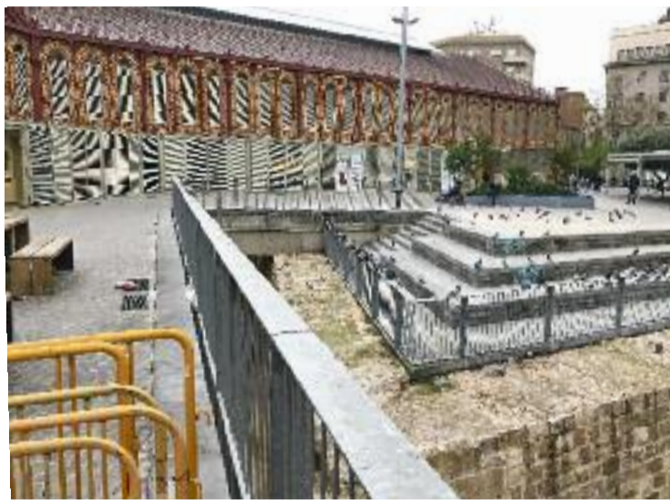
Des del mercat demanen més neteja a l'exterior.