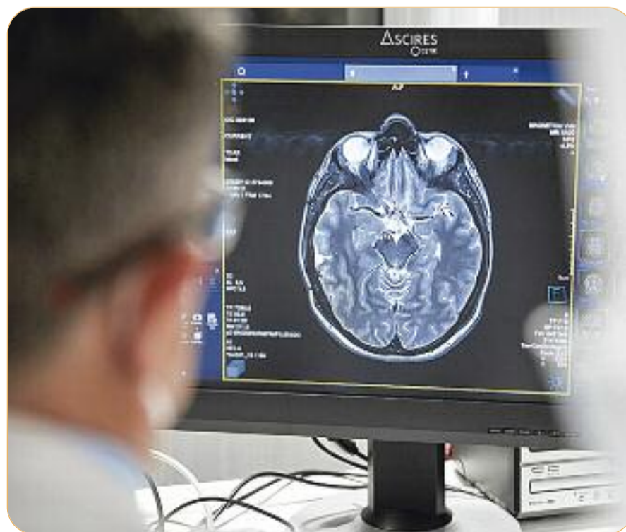
Permet cercar i unificar la informació de la imatge mèdica amb les dades provinents dels informes clínics