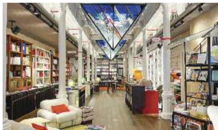
La nova llibreria Finestres, al 250 del carrer Diputació.

D'altra banda, Ortega destaca i celebra que el carrer Diputació estigui "cada cop més viu": "Fa uns anys hi havia poca cosa i ara, en canvi, té molta més vida".