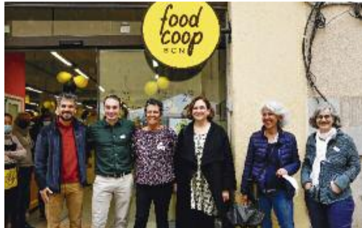
L'alcaldesa Ada Colau va assistir a l'acte.

El nou supermercat es va posar en marxa a principis de febrer amb 450 socis, i ara ja supera els 500. Es tracta d'un negoci pioner a la ciutat, on els clients són els socis de la cooperativa i, com a tal, decideixen quins productes s'ofereixen i n'assumeixen algunes tasques en torns de tres hores cada quatre setmanes. La iniciativa, que es va començar a gestar fa uns quatre anys, ha comptat amb l'ajuda de l'Ajuntament, que hi ha aportat més de 200.000 euros en subvencions.