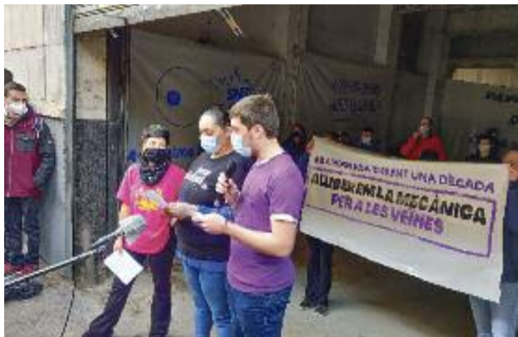
L'espai es va estrenar el desembre de 2020.

Aquesta última entitat ha fet servir l'espai ocupat per repartir menjar que, d'una altra manera, hauria acabat a les escombraries. “Feia anys que aquest local estava abandonat i vam haver de netejar-lo molt, però tot i això no era l'espai més higiènic amb què podíem comptar”, diuen des