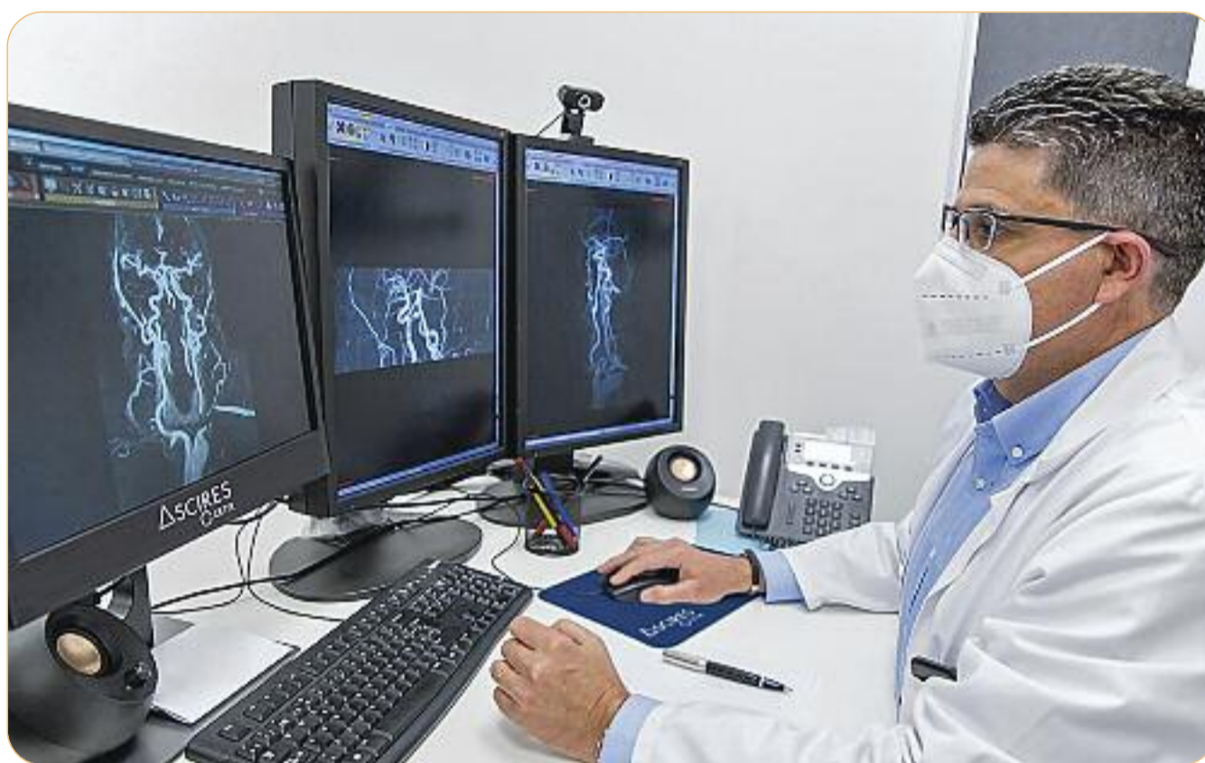
Des de la neurologia o la cardiologia fins a l'àmbit oncològic, és possible emprar aDELAIDE amb qualsevol malaltia diagnosticable per imatge

El projecte, que té el suport de la Unió Europea, està liderat per l'equip mèdic de Cetir Ascires