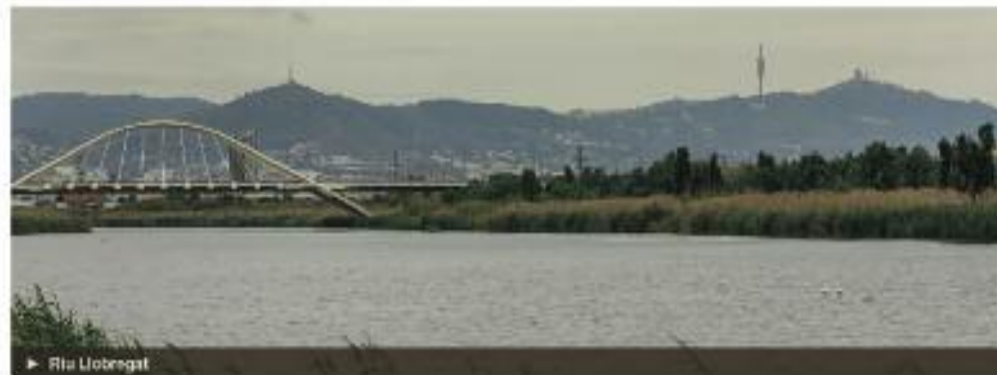
► Riu Llobregat

L'escalfament global, la capacitat limitada dels rius i els aqüífers, junt amb l'increment de la demanda d'aigua per l'augment de la població, dibuixen un escenari de gran estrès hídric que requereix respostes urgents a l'alçada de la planta potabilitzadora de Sant Joan Despí. L'Agència Catalana de l'Aigua (ACA) ha activat la prealerta per sequera a la regió de Barcelona i es podrien començar a decretar