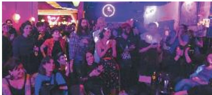
Clients durant un espectacle al bar.

Més enllà de reivindicar símbols de lluita, el més important que aporta aquest bar, apunta, és que hi ha lloc per a totes les identitats LGTBI. Abans, afegeix, el més habitual a Barcelona era trobar, per un costat, espais per a homes gais i dones lesbianes per l'altre. Ni les dues parts es barrejaven gaire ni hi havia massa llocs