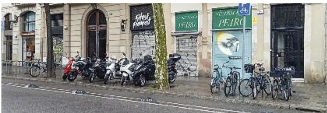
S'ha frenat l'obertura de nous comerços de restauració i orientats al turisme.