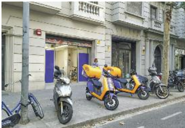
El supermercat va obrir a l'octubre.

El que sí que és una novetat és que l'Ajuntament va prohibir fa pocs dies que s'obrin nous supermercats fantasma a la ciutat i només permetrà que s'instal·lin macrocuines en sòl industrial. Així ho estableix el nou pla d'usos per regular aquesta activitat, que es va aprovar inicialment. La nova re-