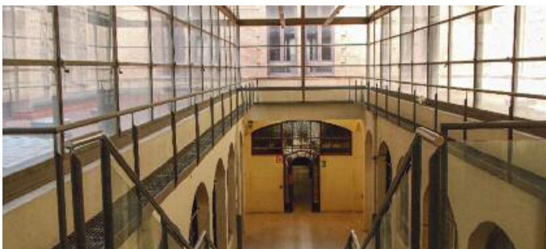
Un dels edificis de l'Escola Industrial que es transformaran amb el nou projecte.