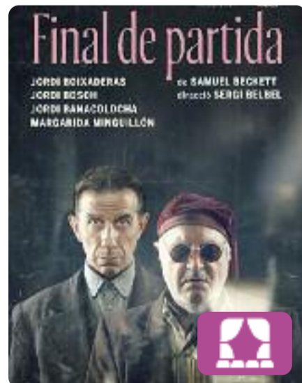
Final de partida Samuel Beckett

Confinats a una habitació, un invàlid cec i el seu servent, coix i hiperactiu, passen el temps i discuteixen. Els vells pares del cec, que viuen en dos cubells d'escombraries, els acompanyen. Malgrat les adversitats, tot plegat és "un pur joc en què no es parla d'enigmes i de solucions". Sergi Belbel dirigeix aquest clàssic de Beckett. Al teatre Romea de Barcelona.