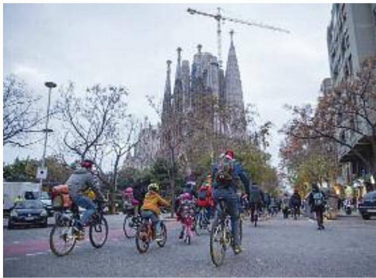
Sortida prèvia a la posada en marxa del bicibús.

Els projectes que desafien l'ordre establert persegueixen grans objectius, i aquest no és una excepció. Tal com recalca Hurtado, un d'ells és donar als infants més autonomia en moure's i l'oportunitat d'anar en bicicleta amb una seguretat que di-