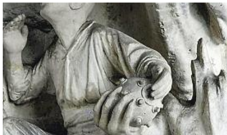
Un dimoni donant a un obrer la bomba d'Orsini.

El vincle entre el tràgic succeís i l'escultura és el motiu pel qual la Sagrada Família l'exhibirà a mitjans d'abril en el marc de la iniciativa 'Museus i el Liceu: Una història compartida'. El seu propòsit és commemorar el 175 aniversari del Liceu a partir d'exhibicions de peces de museus de tota Catalunya per reconstruir entre totes la història del teatre. D'aquesta manera tothom qui vulgui podrà recordar el que no s'hauria d'oblidar mai.