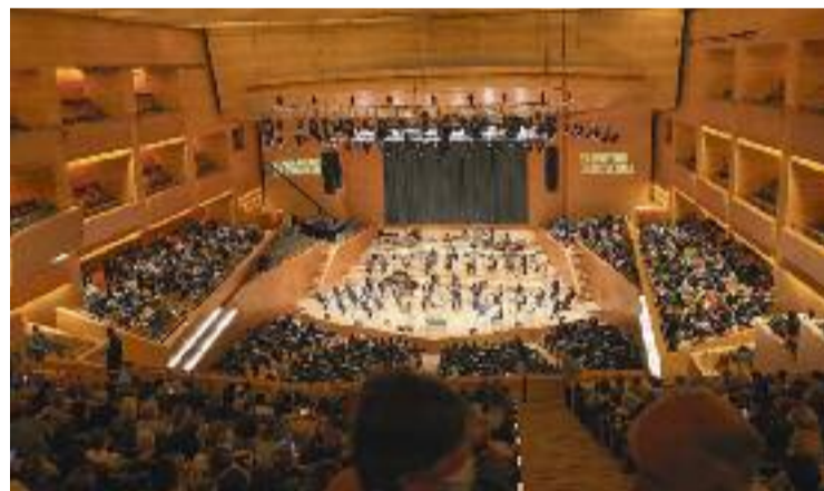
El concert serà el pròxim 30 de març.