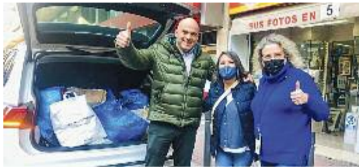
12 comerços associats han participat en la recollida de material.

Encara hi ha més. Fa pocs dies, Som Sant Antoni també va començar a enviar productes a dones i nadons refugiats en hotels de la ciutat. "La majoria arriba sense res", recorda.