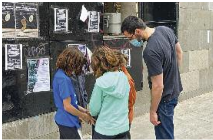
Alumnes fent la lectura dels comptadors.

Cada divendres, els alumnes de 4t fan la lectura dels comptadors, acompanyats del conserge, i comparen el consum del març