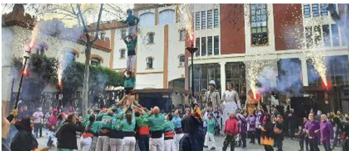
Un dels primers actes per celebrar el 20è aniversari, a l'Antiga Fàbrica Estrella Damm.

OPTIMISME PER FER-NE 20 MÉS Malgrat tot, Villegas es mostra optimista amb el futur dels Castellers de la Sagrada Família: "La colla ja ha passat per moments baixos i s'ha recuperat", afirma, i afegeix que últimament s'hi han sumat nous integrants.