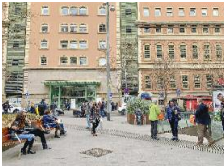
Aquest dimecres al migdia es fa la descoberta de la placa.

La tria del nom per batejar la plaça neix d'una proposta de la