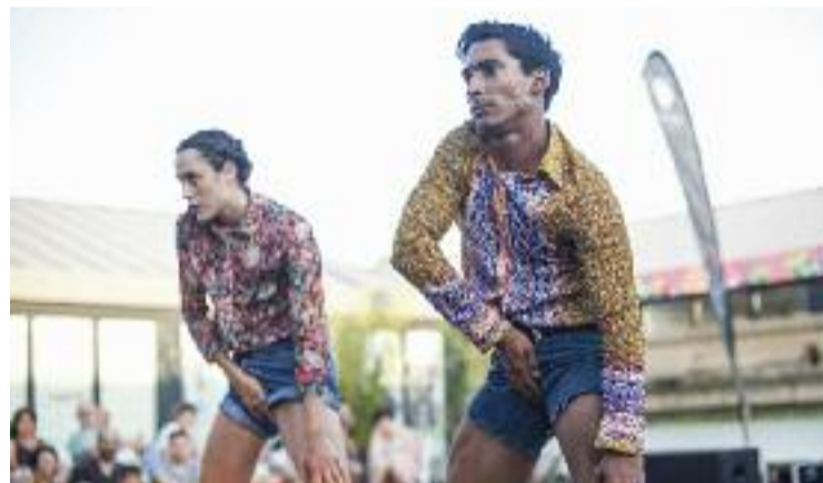
'Out of the Blue', un dels xous programats al centre.

D'altra banda, aquesta edició del Dansa Metropolitana arriba a quatre centres cívics barcelonins més: Zona Nord, Teixonera, Barceloneta i Carmel.