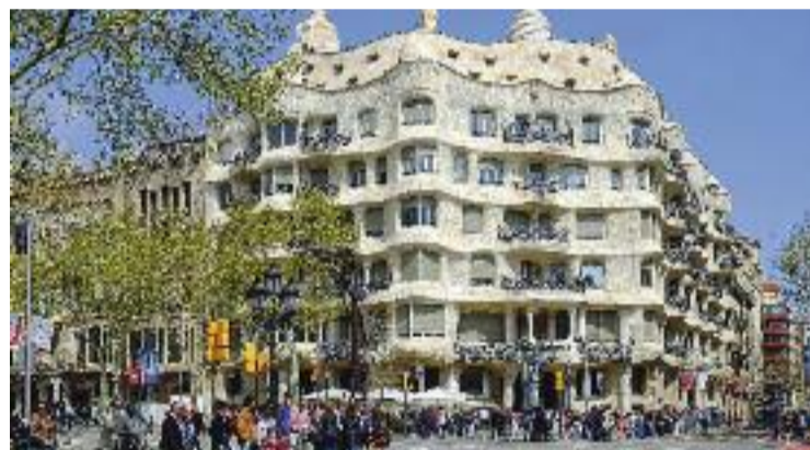
La Pedrera, un dels grans atractius turístics.

Des del Districte recorden que l'Eixample, com que és una de les zones amb més afluència turística, és un lloc "idoni per testar eines i solucions innovadores que fomentin un turisme més sostenible i que ajudin a superar els desafiaments que el turisme suposa per a la ciutat".