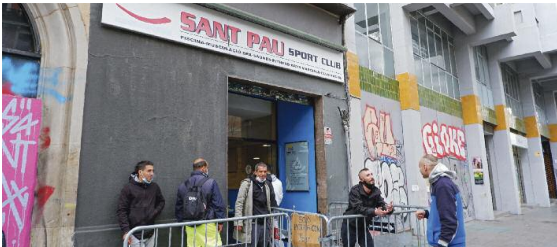
Usuaris fent cua al Gimnàs Social Sant Pau.