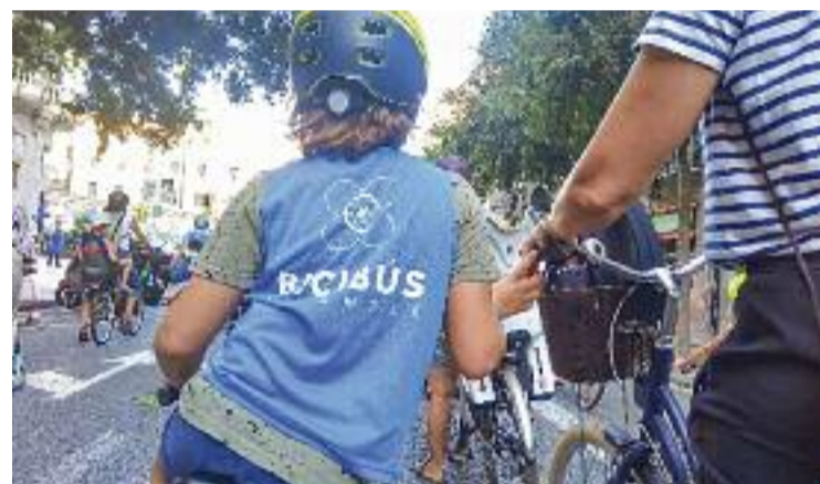
Es tracta del guardó del Dia Mundial de la Bicicleta.

Aquesta proposta de mobilitat alternativa per anar a l'escola va sorgir de les AFA dels col·legis Joan Miró, Entença i Xirriac i l'associació Camí Amic de l'Esquerra de l'Eixample i Sant Antoni, amb el suport de l'Ajuntament. El seu èxit ha estat tan gran que ja arriba a cinc districtes de la ciutat i compta amb set línies diferents.