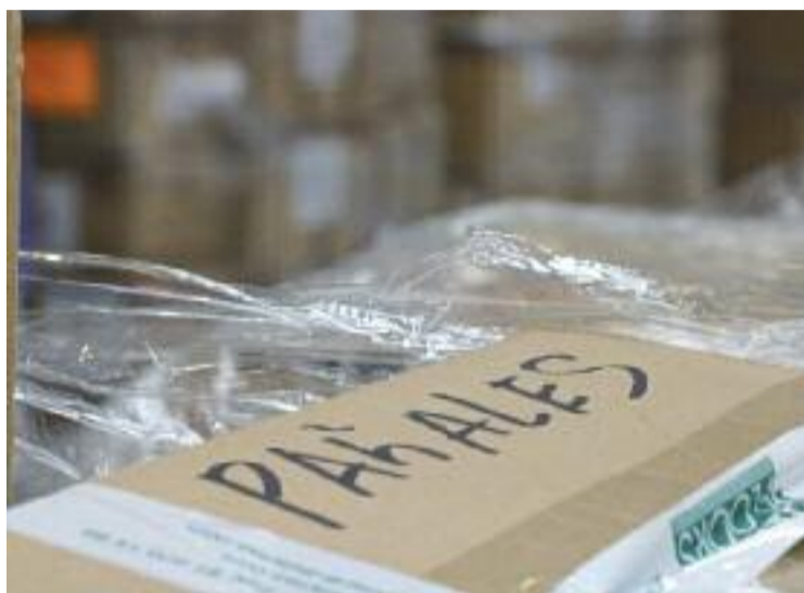
Una caixa amb ajuda per a Ucraïna, en una imatge d'arxiu.

"Hem cregut que era necessari fer alguna cosa per ajudar aquestes persones, i ens hem posat a disposició de l'associació Sonrisas de Ucrania", explica el president de Cor Eixample, Xavier Llobet, que detalla que tenen tot el sistema de transport preparat per fer arribar el material al seu destí. "Primer vam parlar amb els socis, vam deixar enllestir tot el tema logístic i vam contactar amb l'ONG", detalla