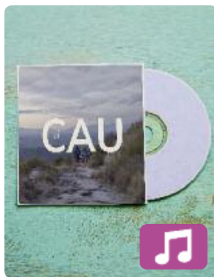
El Cau Josep Thió

Josep Thió, membre del mític grup Sopa de Cabra, ha publicat un nou disc, El Cau , que és la banda sonora de la pel·lícula homònima. Es tracta d'un film que parla sobre l'agrupament escolta (és a dir, el cau) de Salt i la lluita dels seus membres per aconseguir la inclusió real dels joves immigrants del municipi. Thió ha posat música a aquesta història.