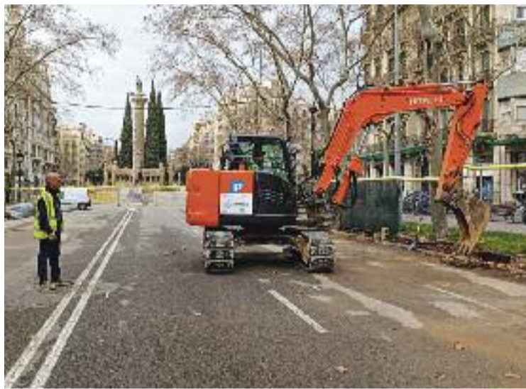
Les obres van començar dilluns passat.

El que també evidenciarà la posada en marxa d'aquestes obres són les repercussions que tindrà durant les pròximes setmanes en la mobilitat d'alguns punts del barri de la Sagrada Família. Per una part, en el tram de l'avinguda Diagonal entre els carrers Castillejos i Marina, es tallarà un carril en cada sentit de circulació i també es retiraran places d'aparcament. Molt a prop d'aquesta zona, també es tallarà un altre punt del barri: la cruïlla de Diagonal i els carrers Aragó i Marina. Això vol dir que els conductors que pugin