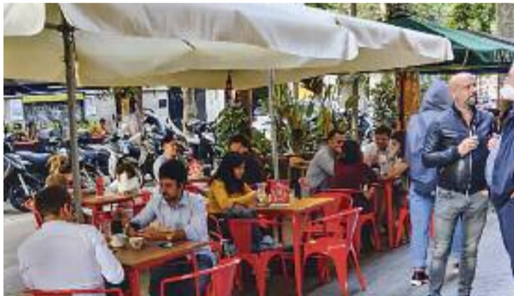
El pla vol evitar els monocultius comercials.