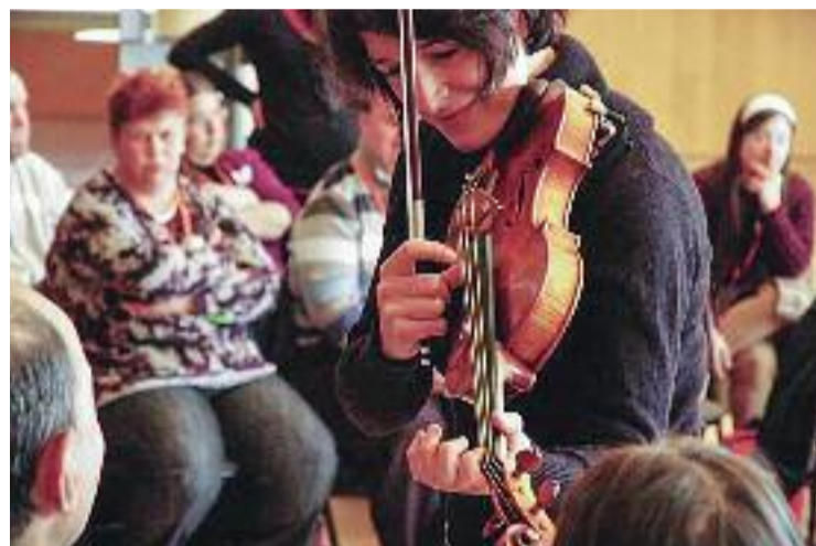
L'Auditori aposta per activitats de perfil social.

D'altra banda, demà i els dies 17 i 24 de març el 'Matí d'Orquestra' serà per a les persones amb discapacitat intel·lectual, que podran participar en una activitat participativa.