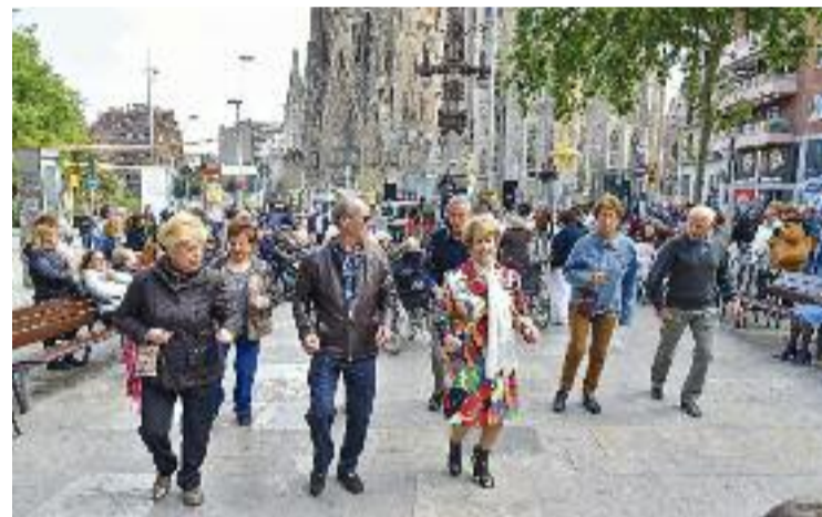
Gent ballant a la Festa Major del 2019

El primer premi de la categoria infantil inclou un xoc de taula i dues entrades per visitar la Sagrada Família, mentre que el guanyador de la categoria d'adults rebrà un val de compra per als Encants Nous per valor de 100 euros i dues entrades per visitar la Sagrada Família. A la categoria infantil hi haurà segon premi i, a la d'adults, segon i tercer.