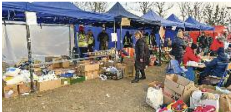
La zona fronterera on ha viatjat el fill del propietari del negoci.

Aquests fets els explica Yaremko des de Polònia, a 100 quilòmetres de la frontera amb Ucraïna, a on s'ha dirigit amb un amic per donar en persona tot el material recaptat. No esperava, reconeix, comptar amb tants productes. "M'ha sorprès molt l'interès