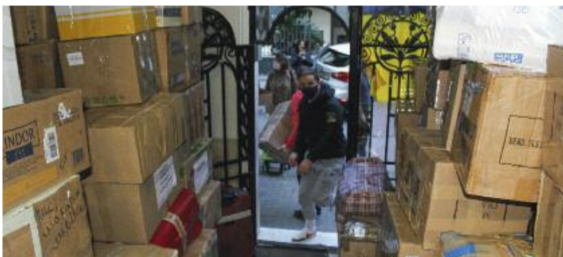
Voluntaris entrant a l'església caps amb material per enviar a Ucraïna.

Les paraules de Popova demostren que aquest espai s'ha convertit en una espècie de refugi mental per suportar el que cap país hauria de viure mai. Tal com recorda, ara hi ha municipis ucraïnesos bombardejats que s'han quedat sense llum, on fa dies que els seus habitants no surten d'un soterrani. I en el seu cas, el pitjor de tot és que la seva família i els seus amics estan atrapats al país. "Ara no es pot sortir perquè és molt perillós moure's per carretera i fa por anar amb tren perquè hi ha tanta gent que es pot acabar aixafat", assegura esperant que no els hi passi res als seus i que la seva ajuda pugui pal·liar la situació de tot el país.