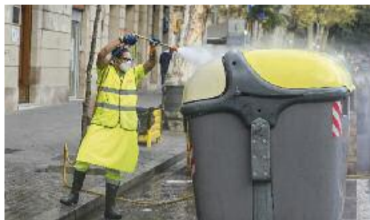
La neteja s'ha intensificat en els darrers mesos.