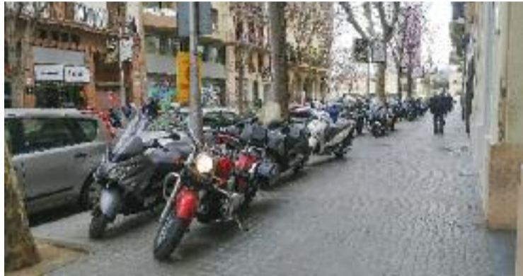
Motos aparcades a la vorera del carrer Consell de Cent.