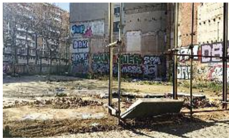
El solar ja és de titularitat municipal des del gener.

Mentre durin aquests treballs, doncs, s'hauran de fer les reunions entre les entitats veïnals i el Districte per definir els usos provisionals d'aquesta finca de l'avinguda Paral·lel, 100-102, on a llarg termini hi haurà pisos socials i un equipament cultural per al barri. En aquest sentit, i a falta de concretar com serà l'espai temporal, Sala té clar que en aquest "mentrestant" el solar s'ha de convertir en un punt de trobada dels veïns.