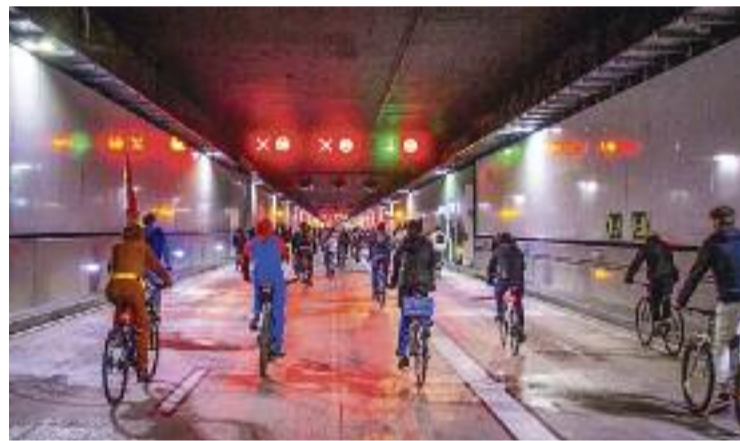
Un moment de la travessa en bici pel túnel de Glòries.

L'acció de Massa Crítica va arribar a provocar retencions de trànsit al túnel cap a dos quarts de deu, segons va publicar beteve , i algunes veu crítiques se n'han queixat a través de les xarxes socials.