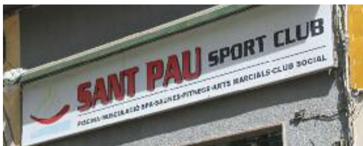
La crisi interna i els problemes econòmics no s'han resolt.

Ara, però, sembla que l'econòmic no ha estat el motiu principal d'aquests acomiadaments. Per a les treballadores que han perdut la feina, la raó és clara: les han fet fora per la seva activitat