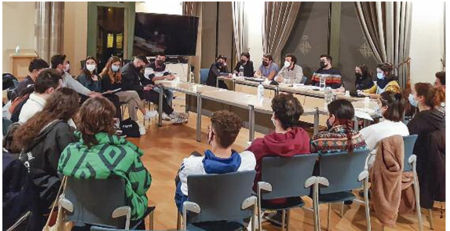
El Districte va escoltar els representants de tretze entitats juvenils en una reunió el dia 2.

També cal tenir en compte que en molts casos no serveix tenir un local qualsevol, sinó que cal tenir-ne un d'adequat. L'exemple de les colles castelleres, com els Esquerdats de l'Esquerra de l'Eixample, és clar. Assagen