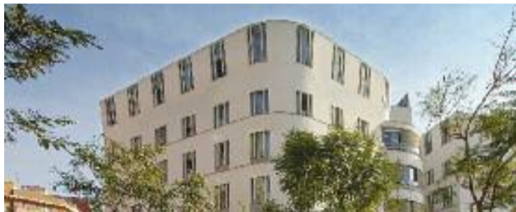
La residència Fort Pienc torna a patir el virus.

Una treballadora, que prefeix mantenir l'anonimat, assegura que la setmana passada hi va haver 15 nous positius entre els residents. Aquesta expansió del virus, segons ella i un altre treballador (que tampoc vol dir el seu nom), té una explicació: tot i que se separen en plantes diferents els usuaris positius i els negatius, els