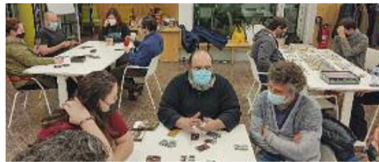
La trobada de Daus del Triangle de divendres passat.