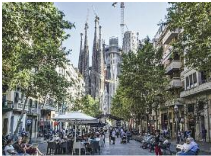
El programa Superilla Barcelona també arribarà al barri.