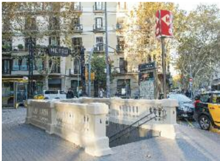
Els fets van tenir lloc al metro d'Urquinaona.

Els tres acusats s'enfronten a cinc anys de presó per un delicte de lesions, amb la motivació per orientació sexual com a agreujant, i a la prohibició d'apropar-se a menys de mil metres de la víctima. L'Observatori contra l'Homofòbia (OCH), que ha acompanyat la víctima des del principi, facilita l'acusació particular i, a més, hi participen tres acusacions populars, que són l'Ajuntament de Barcelona, la Generalitat de Catalunya i el Consorci de Salut i Social de Catalunya.