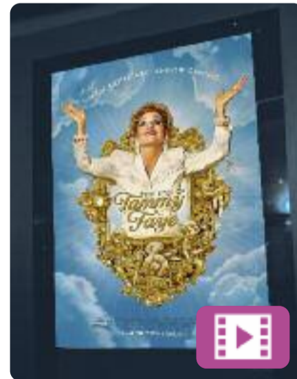
Los ojos de Tammy Faye Michael Showalter

Tammy Faye Bakker (Jessica Chastain) va ser una telepredicadora molt popular als Estats Units dels anys 70 i 80. Ella i el seu marit, Jim Bakker (Andrew Garfield), van crear un imperi del no-res, amb una xarxa de cadenes de televisió religioses i, fins i tot, un parc temàtic. Però les irregularitats financeres, les rivalitats i els escàndols els van fer caure fins a l'infern.