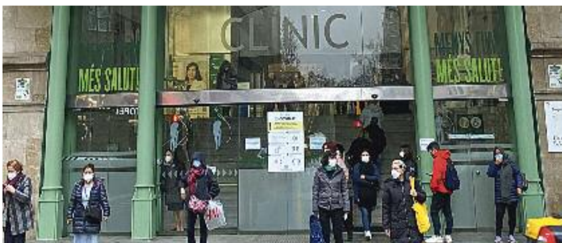
Fa un segle que l'Hospital Clínic és a l'Esquerra de l'Eixample.

Una de les coses que fan sospitar a Escofet que marxarà una part important del Clínic és la poca informació que s'ha donat sobre el tema. "Va sortir la notícia i al cap de res va quedar morta", indica. Per a ell, aquest si-