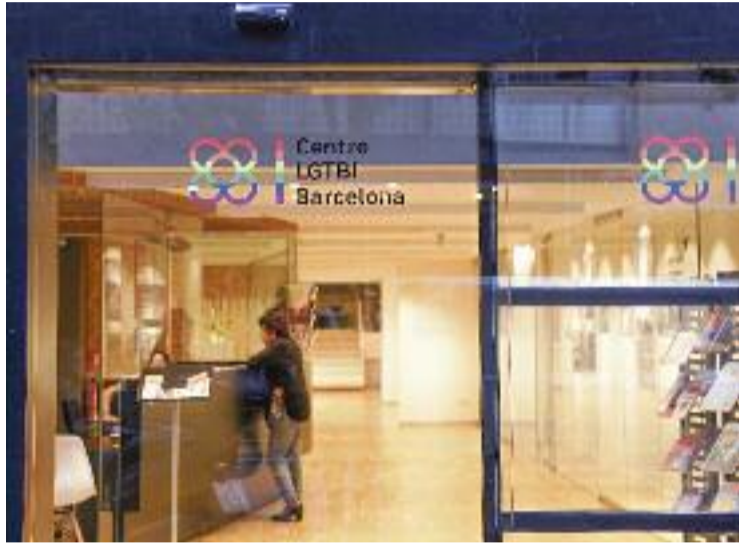
El centre organitza activitats de temàtica LGTBI.

A banda d'aquests serveis que ofereixen suport, en el centre també es fan activitats de diversitat sexual adreçades a tota la ciutadania, com ara debats, presentacions de llibres o exposicions de fotografia. Els objectius que persegueixen estan clarament a favor de totes les maneres d'estimar: trencar l'estigma i apropar la ciutadania a re-