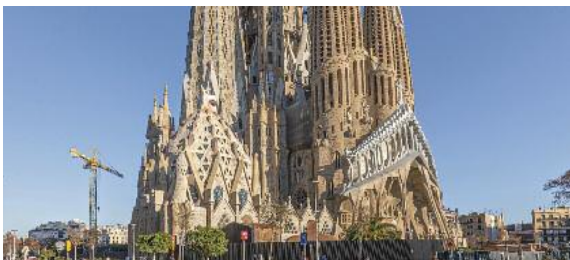
Les obres del temple han fet passos importants en els darrers anys.