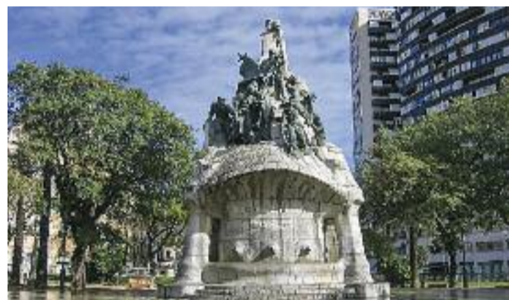
La mobilitat genera conflictes a la plaça.

D'altra banda, el veïnat també ha demanat que s'obri un procés de consulta ciutadana per canviar el nom de l'espai, perquè plaça Tetuan fa referència a la batalla de Tetuan – 1863 – de la guerra colonial d'Àfrica. I, paral·lelament, han tornat a proposar recuperar el Refugi Anti-aeri de la Plaça Tetuan, fet durant la Guerra Civil i amb una capacitat per a 2.500 persones.