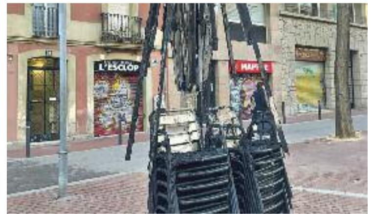
Part de la terrassa de L'Esclop cremada.