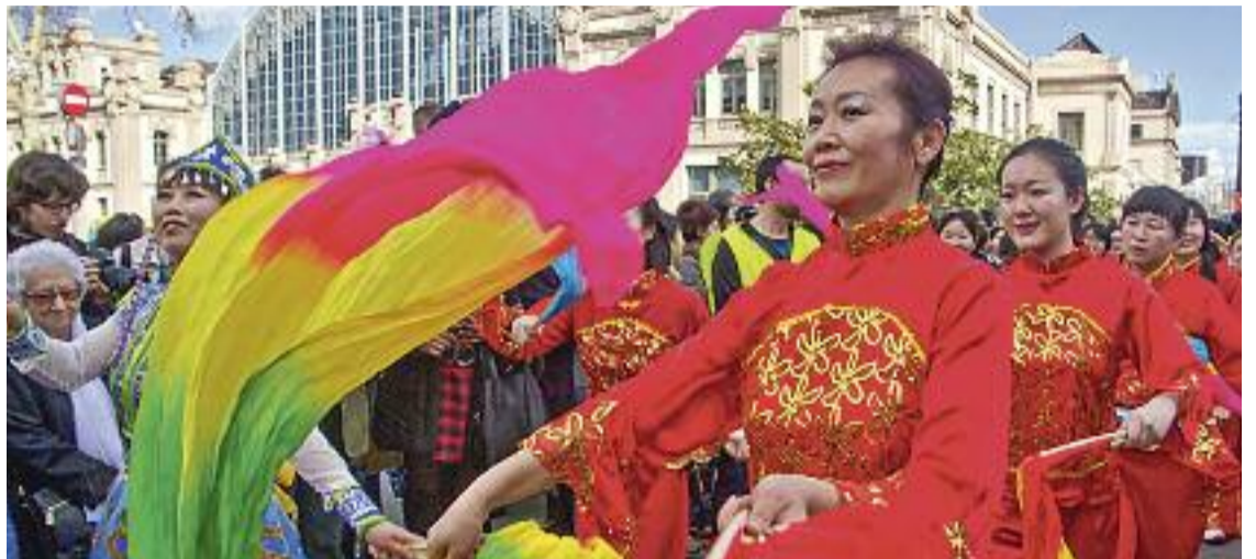
El passat 29 de gener es va celebrar l'Any Nou Xinès al barri.