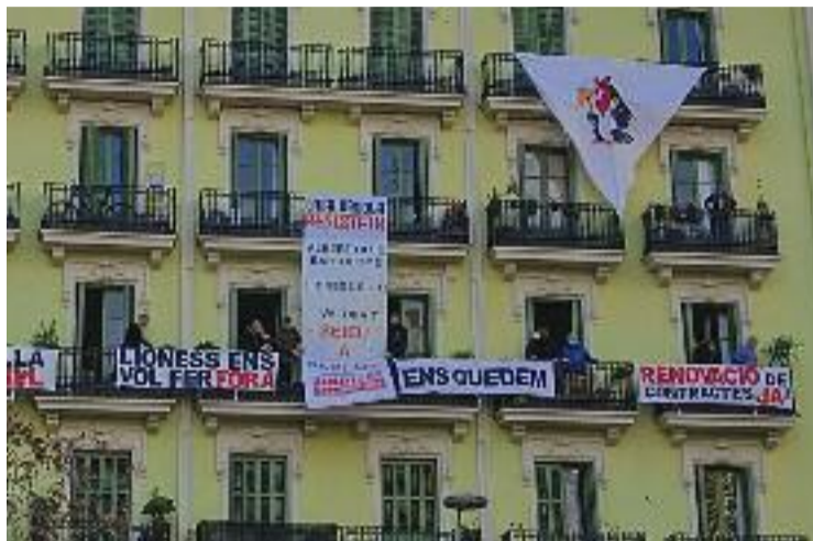
El veïnat vol que es renovin tots els contractes.

Davant l'actitud de Lioness Inversiones, els veïns van proposar-li celebrar una reunió el passat 13 de gener, però, afegeix, encara no n'han sabut res. "Està molt bé que