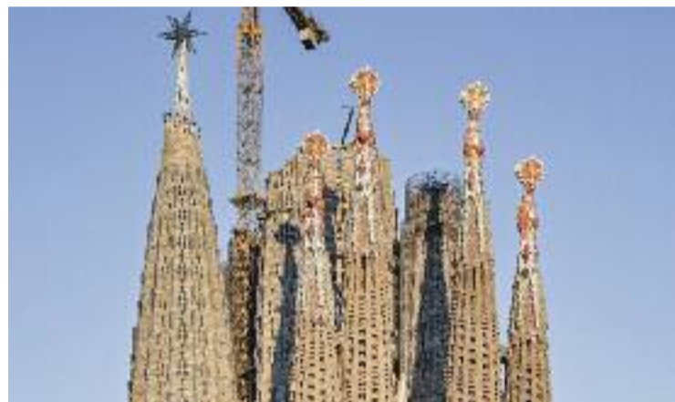
Les quatre torres dels evangelistes.

Aquesta notícia vol dir que la basílica farà un altre gran pas endavant que la farà estar més a prop d'acabar les llargues obres. Enllestir aquestes dues torres és molt important per al projecte d'ampliació del temple, ja que seran les terceres torres més altes del temple i, amb elles, ja estaran acabades tres de les cinc torres de la nau central. La primera va ser la torre de la Verge, inaugurada el passat desembre amb l'encesa d'un gran estel que ara il·lumina al barri i a Barcelona.