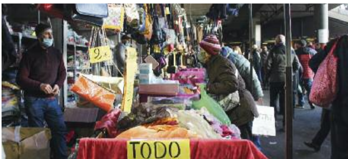
Un dia laboral al Mercat dels Encants.

Les dificultats que comparteix Nebot també s'evidencien parlant amb alguns dels paradistes del mercat. Adbul Chekror, que té una parada de diferents articles de segona mà, recorda que l'augment de casos ha fet baixar força el nombre de clients. I el pit-