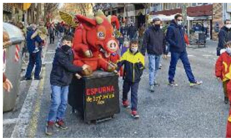
Un moment de la Festa Major de Sant Antoni.

Una bona notícia a dir sobre aquestes festes és que encara no han acabat. Fins al 23 de gener es podrà gaudir de desenes d'activitats que són un fidel reflex de l'esperit i la història de Sant Antoni. 'Comerç al carrer', el correfoc, l'actuació de les Orquestres de l'Escola de Músics o el 'Vermut musical i diabòlic' són algunes d'elles. També són aquelles que podran omplir de força i esperança als qui l'any que ve volen celebrar unes festes més animades, sense angoixes per l'augment de casos ni actes anul·lats per la pandèmia.