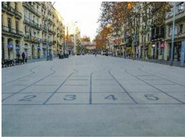
L'ambient al carrer ha caigut amb l'òmicron.