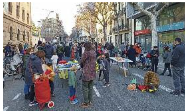
Un dels talls de trànsit de divendres passat. Twitter: (@AFI_Entenca)

materialitzat en talls de trànsit, també en un estudi sobre entorns escolars de Barcelona que fet amb la col·laboració de la Universitat de Barcelona (UB) i la Universitat Autònoma de Barcelona (UAB) i en el qual han participat 83 AFA i més de 4.500 famílies de 180 escoles. Algunes de les dades més importants extretes són que només una de cada tres escoles té carril bici per arribar-hi i que el 85% de les AFA creuen que hi ha problemes d'accés als centres, com per exemple per falta d'elements protectors del trànsit.