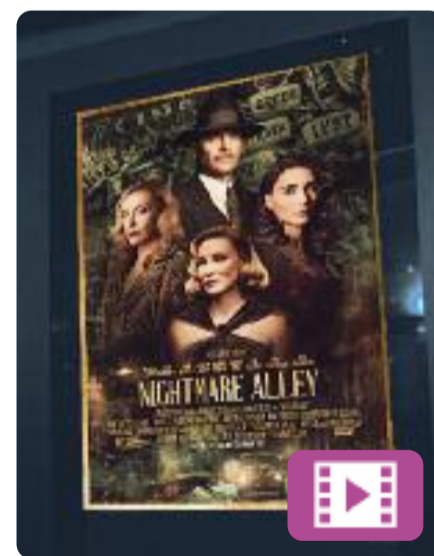
El callejón de las almas perdidas Guillermo del Toro

Guillermo del Toro presenta aquest re-make de la pel·lícula de 1947 El callejón de las almas perdidas , en què Bradley Cooper es posa a la pell d'un home ambició, amb talent per a la manipulació i l'engany. El protagonista coneix una pitonissa tan perillosa com ell, interpretada per Cate Blanchett, que es convertirà en la seva aliada per estafar milionaris.