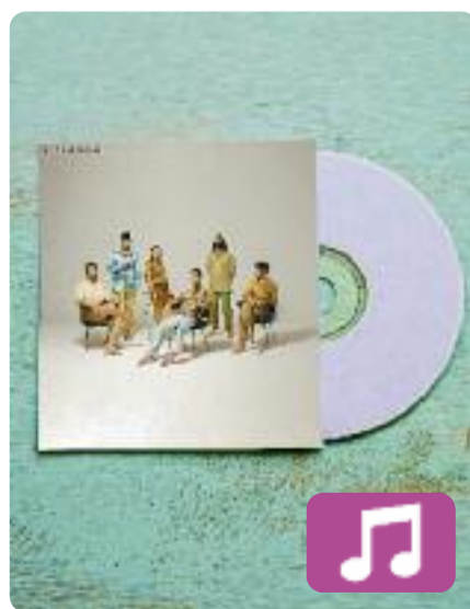
Present El Diluvi

Viure i gaudir aquí i ara: aquesta és la filosofia del quart àlbum del grup El Diluvi. Sota el títol Present (Halley Supernova), la banda de la comarca valenciana de l'Alcoià presenta una quinzena de cançons que demostren les seves ganes d'aprofitar, justament, el present. El disc inclou col·laboracions amb artistes com Guillem Solé, el cantant de Buhos.