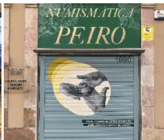
Llobet Òptics i Numismàtica Peiró són dos dels negocis que formen part del projecte.