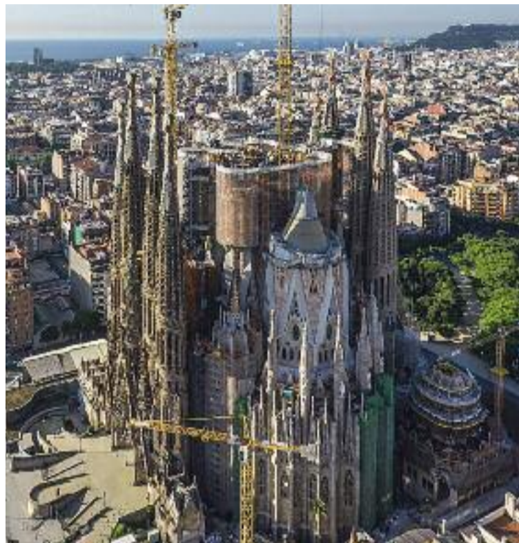
L'ampliació de la Sagrada Família i la possible pèrdua d'una part de l'àrea hospitalària del Clínic preocupen els veïns.

Al barri del costat de Sagrada Família, el Fort Pienc, persegueixen objectius que no tenen res a veure amb l'habitatge, però que també són importants per ga-