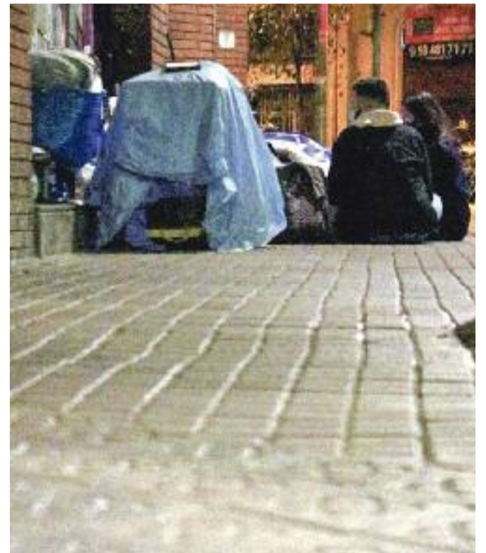
La porta que ha posat el Districte al porxo del mercat (esquerra) i voluntaris d'Arrels atenen persones sense llar (dreta).

fugiar-se al porxo que hi ha entre la biblioteca i el centre cívic, que no protegeix gaire perquè és massa petit. En canvi, a d'altres els han perdut la pista. “Quan els obliguen a desplaçar-se, els fan perdre la petita xarxa que havien construït a la zona, amb els veïns i referents socials que els ajudaven”, lamenta González, que denuncia que això dificulta la tasca d'Arrels.