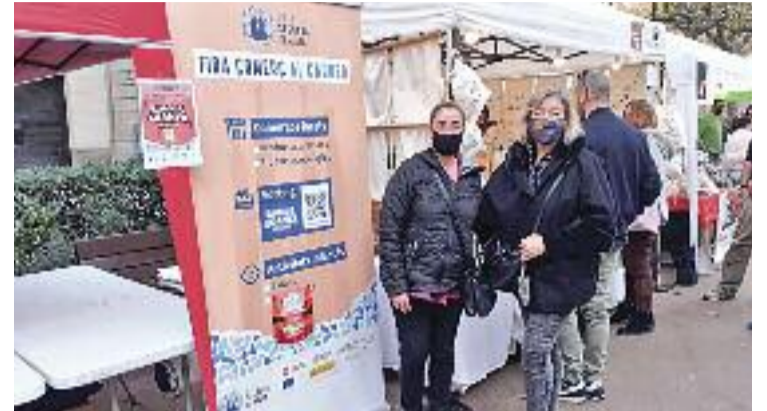
Una imatge de la fira al carrer.