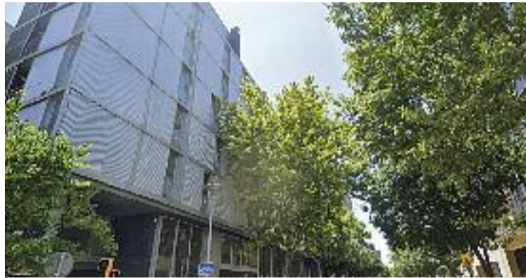
L'edifici permetrà fer l'institut escola.

La cessió de l'edifici és el resultat de l'acord entre les dues institucions que formen el Consorci d'Educació de Barcelona, l'Ajuntament i la Generalitat, que també han acordat pagar a parts iguals les obres d'adequació de l'immoble. El projecte es desenvoluparà en fases i, de moment, el Consorci ja treballa en la redacció del projecte executiu