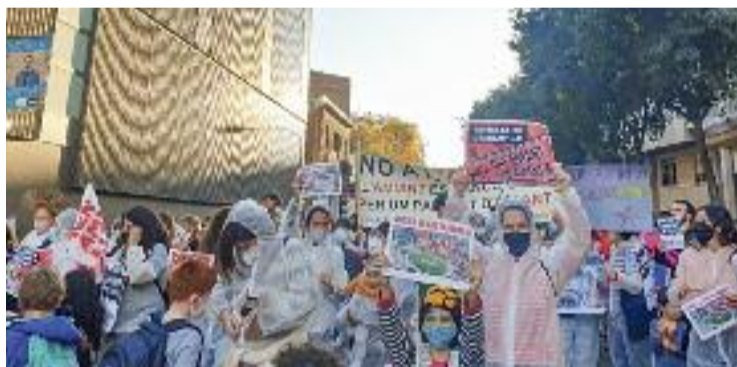
La concentració organitzada per les AFAs divendres passat.

Des de l'AFA de l'escola Encants, Bea Beza explica que fa deu anys que demanen la retirada, i no