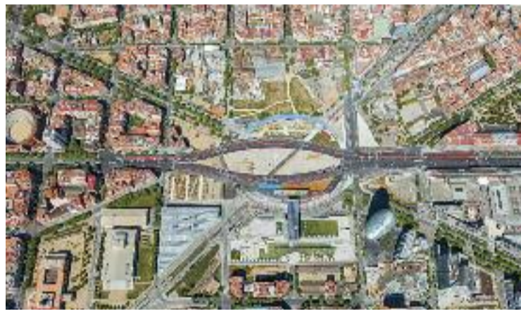
Imatge aèria de les obres de Glòries.

De fet, les associacions de veïns ja van advertir a finals de setembre que farien una mobilització si l'Ajuntament no cedia i es comprometia a accelerar les obres. L'únic compromís que ha assumit el consistori fins ara, però, ha estat el de tenir el projecte executiu i l'obra licitada aquest mandat. Això no convenç els veïns, que asseguren que en principi les obres haviem de començar el segon trimestre de 2021 i que ara no acceptaran més retards.