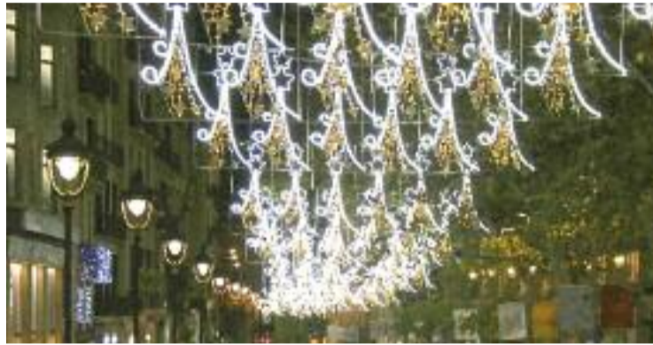
Imatge d'arxiu de l'enllumenat nadalenc de Barcelona.