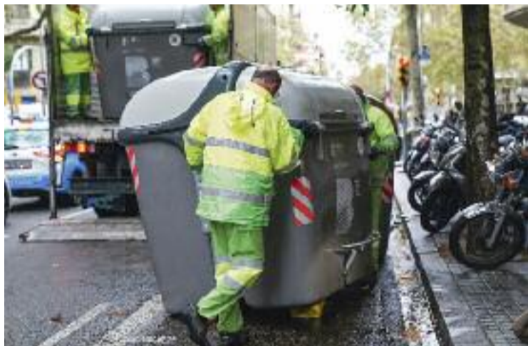
El nou model vol reduir el nombre total de contenidors.