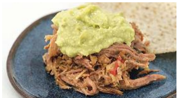
La tapa guanyadora, de la vermuteria Las Vermudas.