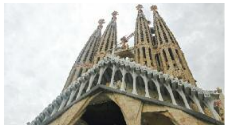
Demanen aturar les obres fins que no s'activi el grup de treball.

Precisament, ahir ERC va presentar una proposta que demana accelerar la retirada d'amiant de les escoles de la ciutat i que va tirar endavant tot i l'abstenció dels comuns i el PSC. Al mateix temps, el consistori va defensar la feina que ja s'ha fet per retirar l'amiant d'aquestes tres escoles.