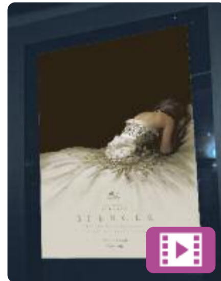
Spencer Pablo Larraín

Kristen Stewart es posa a la pell de Lady Di en aquest biopic que explica un cap de setmana crucial a la vida de la princesa de Gal·les. En aquell moment, a principis dels 90, Diana Spencer va decidir que el seu matrimoni amb el príncep Carles no tenia futur. Van ser tres dies a la finca de Sandringham, en una de les seves últimes vacances de Nadal a la reialesa.