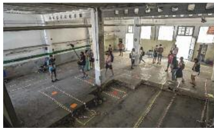
L'obertura serà a principis del 2022.

sembre i que l'obertura del nou establiment sigui durant el primer trimestre del 2022. Serà llavors quan, tal com esperen els ara gairebé 400 socis del supermercat, Foodcoop compti amb els més de 500 que necessita per ser, segons Rovira, "econòmicament viable a llarg termini". I també per fer, en part, realitat una de les raons per les quals Rovira creu que aquesta iniciativa és important. "Les necessitats essencials de les persones no haurien de tenir el lucre com a motor", sentència.