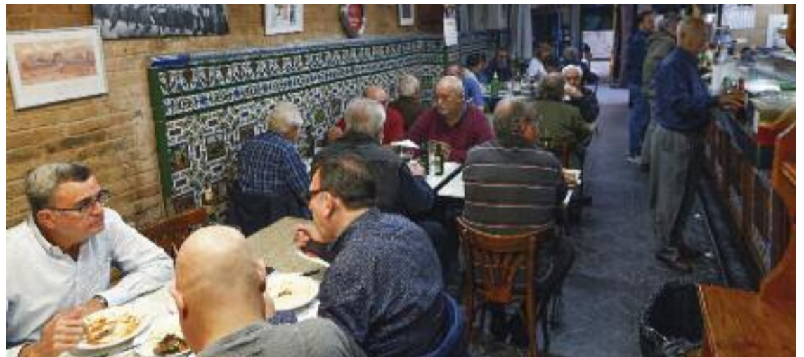
La Bodega d'en Rafel, plena de clients un dia de la setmana passada.

Fa 34 anys, Jordana no imaginava el recorregut que ha acabat fent. "Treballava al món de la pu-