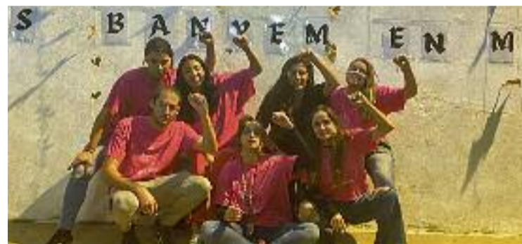
Alguns membres del casal de joves del barri. Foto cedida

cions per la pandèmia vigents aleshores, unes acusacions que des de l'entitat neguen: “El conveni del lleure ens permetia ser més de sis persones i, d'altra banda, ningú ens va demanar que abaixéssim el volum. No estàvem fent res que no estigués permès”, assegura un dels integrants. Per a ell, les multes són una manera de “posar pals a les rodes als moviments organitzatius juvenils”, que han tingut moltes dificultats en l'últim any i mig. En el manifest de la campanya, que signen altres entitats juvenils, lamenten “les múltiples dificultats” dels joves del Fort Pienc “per trobar espais organitzats d'oci accessibles i segurs”.