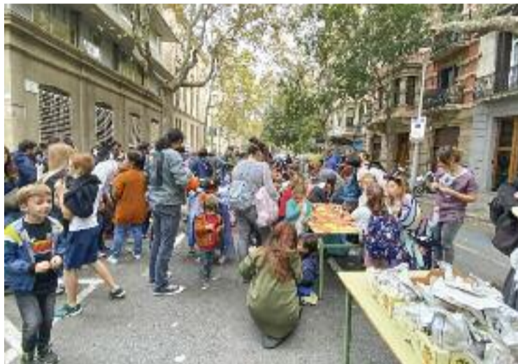
Un moment dels talls del passat divendres 29 d'octubre.

Durant els pròxims mesos, la idea és fer talls un divendres al mes a la sortida de les escoles, tot i que l'estrena de la Revolta Escolar d'aquest curs està marcada per dues jornades de talls consecutives, una que va tenir lloc divendres passat i una segona que es farà aquest divendres 5 de novembre. En el cas de l'Eixample, hi participen un total de dotze centres, quatre dels quals de la Dreta. L'Escola de la Concepció és una d'elles i di-