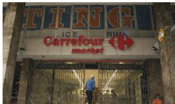
El futur supermercat de la cadena Carrefour.

El tancament va fer que diverses persones lamentessin la pèrdua de la pista de gel fent servir el hashtag #SalvemSkating a les xarxes socials.