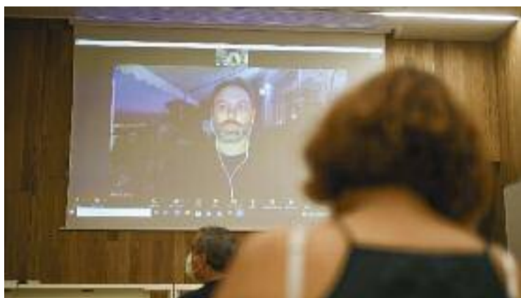
Un moment de la primera xerrada, feta el 20 d'octubre.

Aquesta entitat, tal com recorda Karvala, va néixer l'any 2010 després que el partit d'ultradreta Plataforma per Catalunya obtingués un 2,4% dels vots en les eleccions al Parlament. La UCFR va ser un dels col·lectius que va encapçalar la campanya contra aquesta formació, que