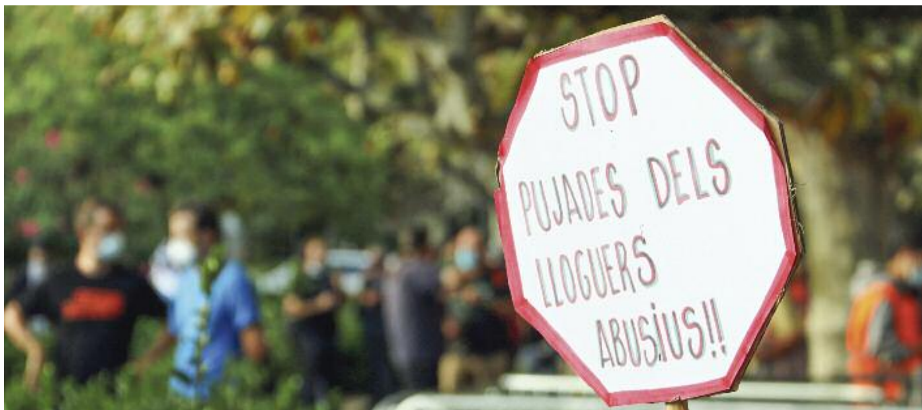
Una pancarta del Sindicat de Llogateres, el setembre de 2020.