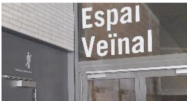
Es preveu que els treballs durin cinc mesos.

El fet d'haver de compartir aquest espai no acaba de convèncer els