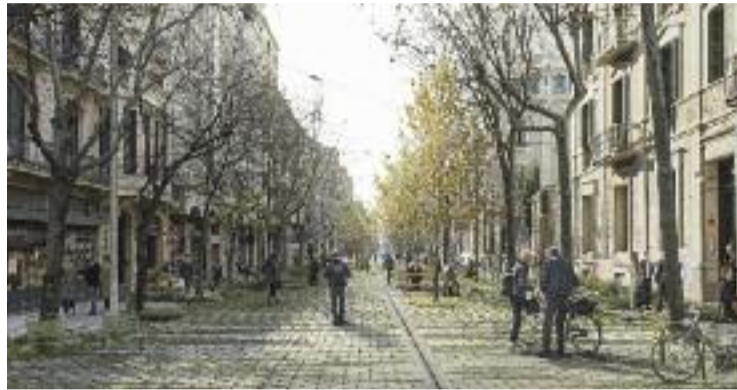
Aquest és l'aspecte que tindrà la futura superilla de l'Eixample.

La superilla de l'Eixample canviarà la imatge del districte, que veurà redissenyats quatre dels seus carrers: Consell de Cent, Rocafort, Comte Borrell i Girona. També s'hi crearan quatre places noves, ubicades als encreuaments del carrer Consell de Cent amb els carrers Girona, Comte Borrell, Rocafort i Enric Granados. L'objectiu del govern municipal és crear un gran espai verd, sense asfalt (tindrà un panot sostenible) i pensat