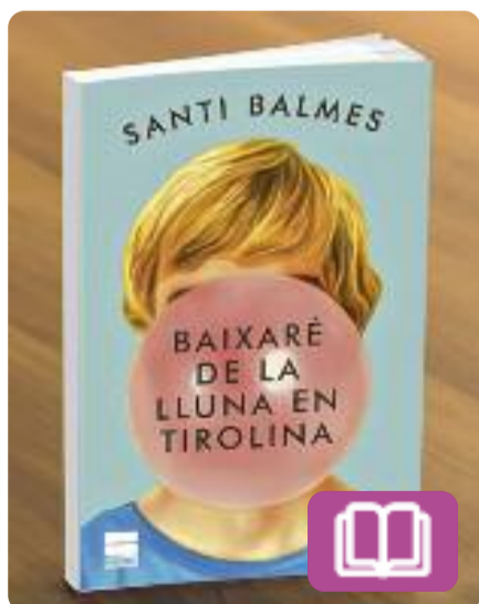
Baixaré de la lluna en tirolina Santi Balmes

El David, o Deivid Weirdo, com li agrada que li diguin, és un preadolescent que veu el món des d'una perspectiva molt diferent de la de la seva família i no està passant pel seu millor moment: els seus pares s'acaben de separar, el seu germà gran ha deixat de parlar-li i no sap per què i, a sobre, s'ha enamorat per primera vegada d'una noia de la qual no en sap ni el nom.