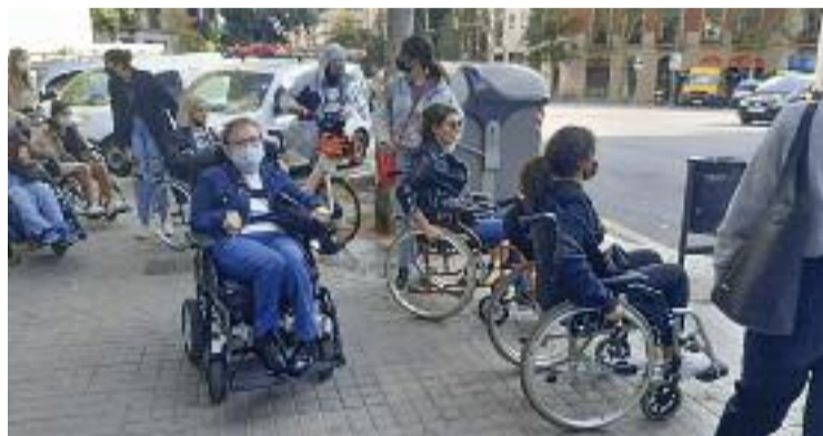
Sortida per comprovar l'accessibilitat de les botigues.

La primera sessió del projecte va ser a les aules de la universitat el dia 13, i l'endemà va arribar el moment de sortir al carrer amb cadires de rodes per comprovar el grau d'accessibilitat dels comerços del barri. "Va ser un exercici de sensibilització perquè els alumnes es possessin a la pell de les persones amb discapacitat", explica la tècnica de l'IMPD que porta el projecte, Maria Castells. "La majoria de les botigues que vam visitar són ac-