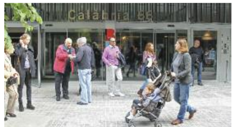
Una imatge de la inauguració de l'espai, ara fa sis anys.

Pensant en el futur, des de l'assemblea volen que el nou local esdevingui un espai per a tots els joves del barri, i no únicament per als vinculats a l'entitat. "Volem fer activitats i tallers en funció del que vulgui el jovent, i també ens agradaria que sorgissin nous grups", avancen.