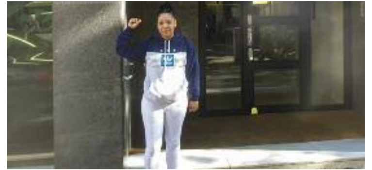
L'Ely, una dona amb dos fills que ha patit violència masclista.

Martí. Pel que fa a la resta d'inversions previstes per a l'any vinent, a banda de la reforma de la Via Laietana, destaquen la connexió del tramvia i els projectes d'urbanització de la Gran Via i l'avinguda Meridiana, entre d'altres. Amb tot, des del govern asseguren que la voluntat és "assolir el màxim consens amb la proposta i donar marge a les negociacions".