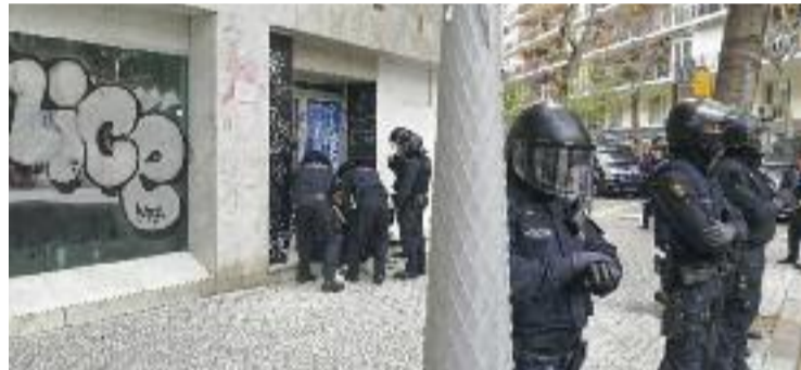
El desallotjament del Rec de finals de 2019.

La defensa del manifestant l'ha portat el col·lectiu d'advocats Alerta Solidària, que insisteix que la detenció del noi es va fer "sense motius" i celebra que s'investigui ara el policia.