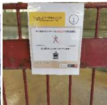
El contrast de les parades a ple rendiment amb les buides i el cartell que indica l'inici de les obres.

gaven entre dos centenars de negocis ara ho han d'assumir menys d'una cinquantena de venedors.