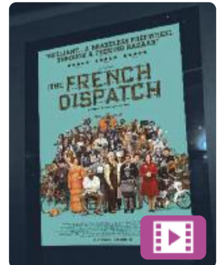
La crònica francesa Wes Anderson

La crònica francesa és la nova pel·lícula de Wes Anderson, ambientada en la redacció d'un diari estatunidenc a una ciutat francesa fictícia durant el segle XX, i presenta tres històries connectades entre elles. Es tracta d'una carta d'amor al món del periodisme. El film es va presentar al Festival de Cannes 2021 i va ser aclamat per la crítica.