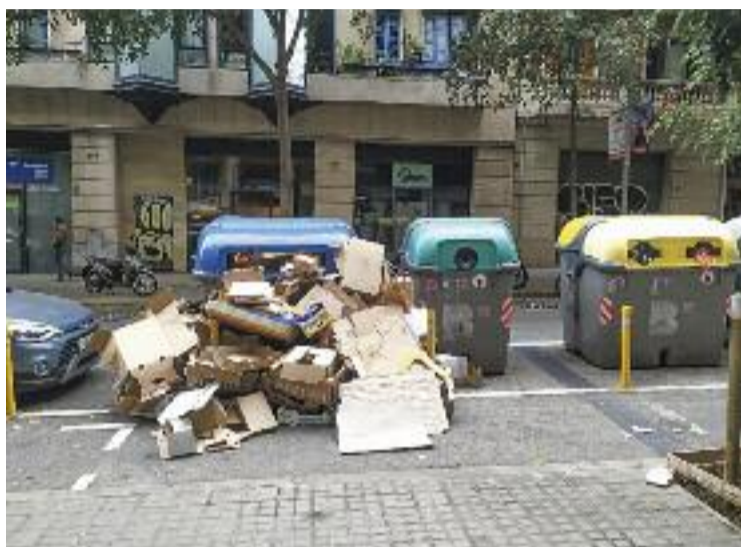
Denuncien que els contenidors de cartó s'omplen a vessar cada dia.