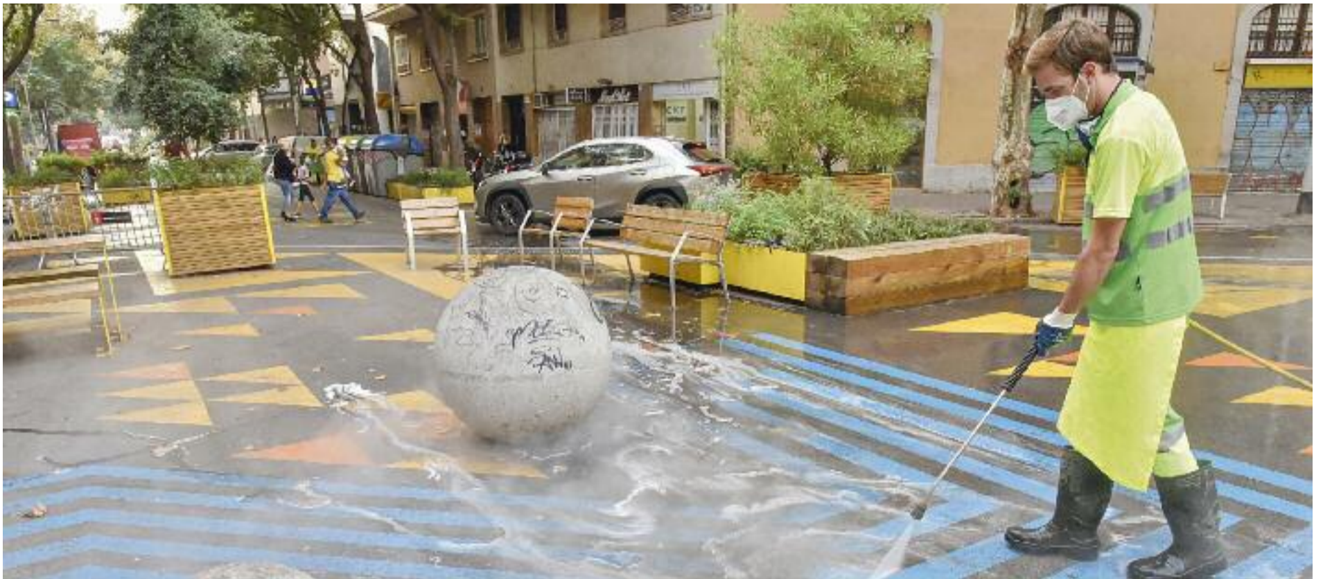
Un dels punts on ja s'ha fet una neteja a fons és a la superilla de Sant Antoni.