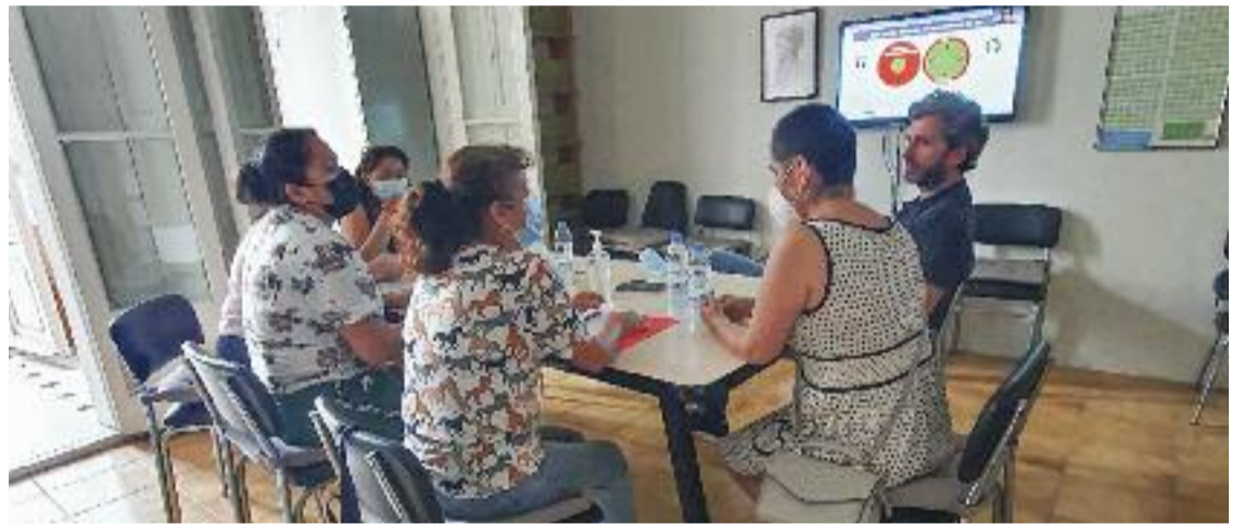
L'ONG ha arribat aquest 2021 a ajudar 58 persones a trobar feina.

"Durant la formació anem parlant amb ells per acompanyar-