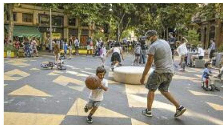
Les superilles, un dels temes del debat.