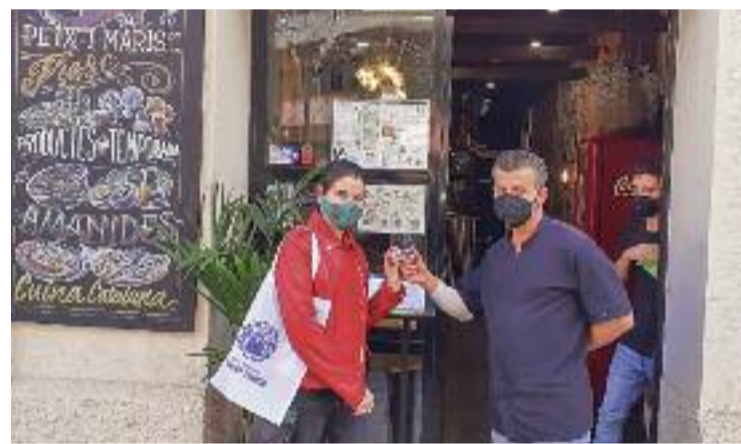
Cada dijous hi ha una cita amb el Tapitast.

A la pàgina web de Tapitast també es poden conèixer tots els bars i restaurants participants i quines són les seves tapes d'especialitat d'aquesta edició.