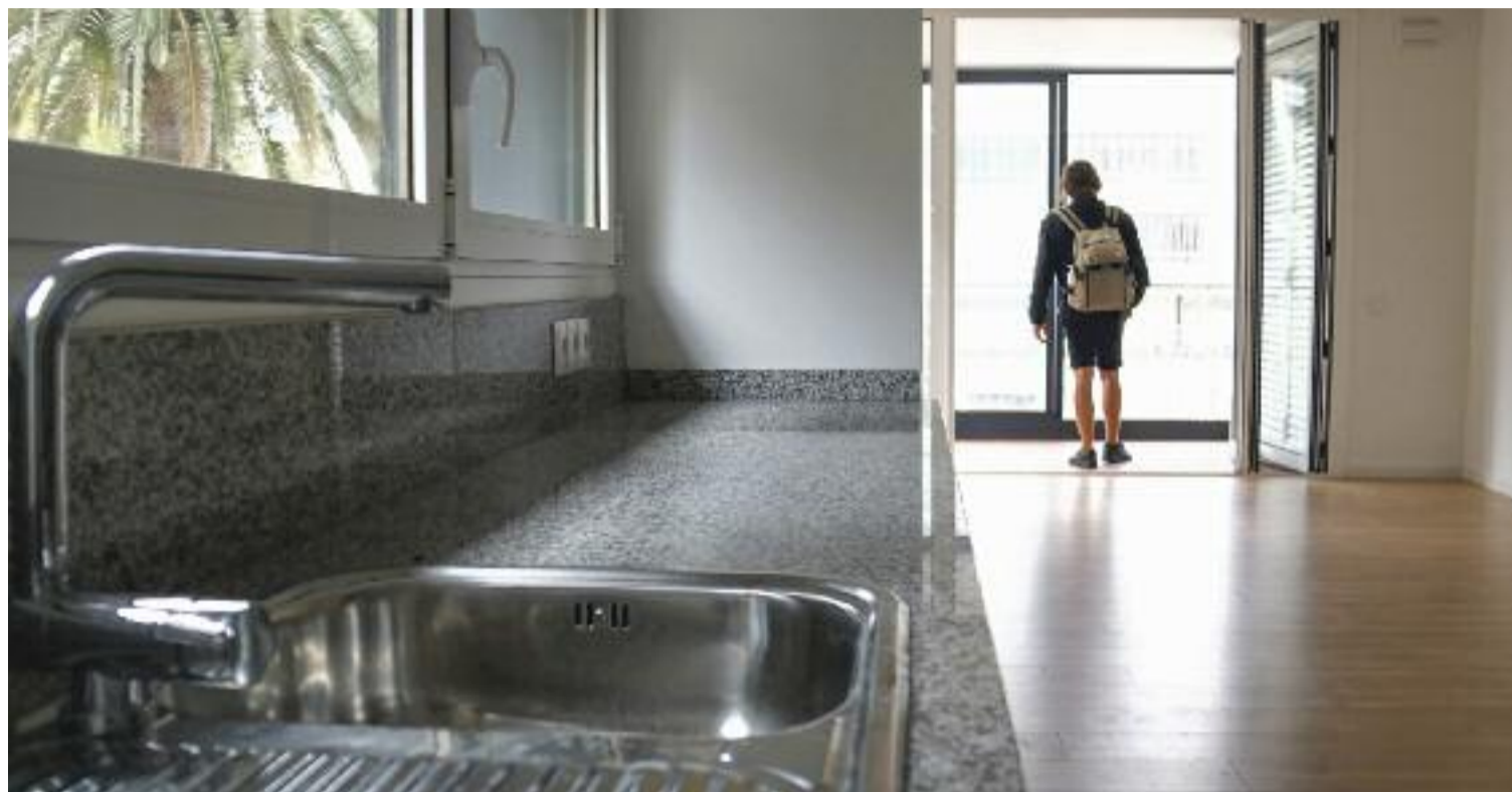
Una persona fent en una visita en un pis per a una possible compra.

Tot feia preveure que els preus de compra d'habitatges a l'àrea metropolitana caurien amb la pandèmia per la baixada del turisme. Més d'un any i mig després, però, això no ha passat. La població ho té avui més complicat per adquirir un immoble i fins i tot per llogar-lo, ja que alhora que els preus de compra de