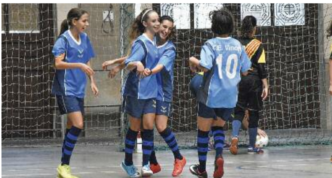
Jugadores del Vincit celebren un gol durant un partit.

El coordinador del club admet que li encanta que els visitin pares i mares que han jugat a l'entitat i, encara més, que hi apuntin la seva mainada. "M'omple que conservin un