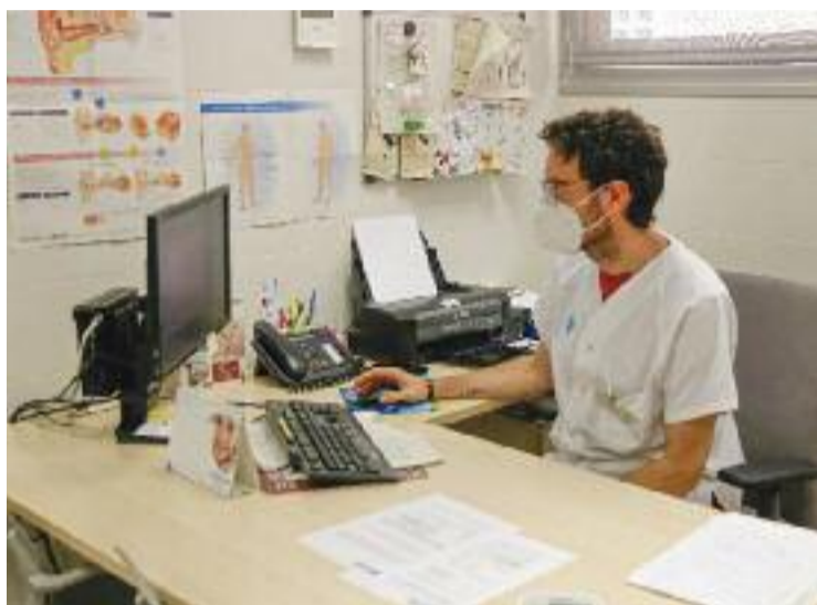
Alguns sanitaris han hagut de doblar tornos.

Pel que fa a la salut mental, assegura que mai havia vist tants companys amb ansietat o que s'han hagut d'agafar la baixa. "Durant la cinquena onada vam doblar tornos per garantir-nos les vacances. Mai les havia començat tan cremada. La pri-