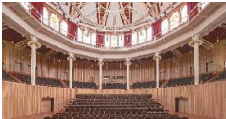
L'espai emblemàtic portava dècades en desús.

La rehabilitació del Paranimf ha fet que es recuperin els seus elements originals, com la fusta