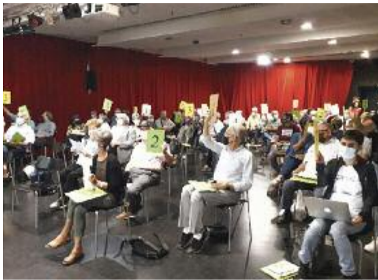
El Centre Cívic va acollir l'assemblea de la FAVB.