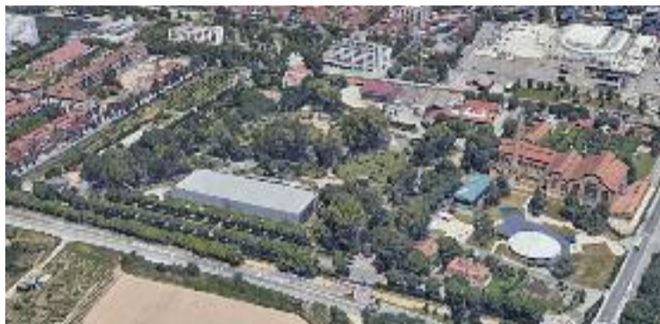
Vista aèria dels terrenys del Museu de les Aigües.

De moment, en aquells terrenys hi ha el Museu de les Aigües i unes instal·lacions de bombeig d'aigua que són allà des de finals del segle XIX. Ara, l'empresa vol traslladar-hi la seva seu i l'anomenat Centre Tecnològic de l'Aigua per unificar la seva activitat en un mateix espai. La modificació del PGM,