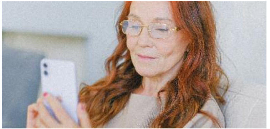
A través d'un simple SMS pots accedir a molts serveis de la Seguretat Social.

El mateix mètode d'identificació via SMS permet fer tràmits com altes, baixes i modificar dades en el Sistema Especial d'Ocupació a la Llar; altes, baixes i canvis de la base de cotització d'autònoms; fer un