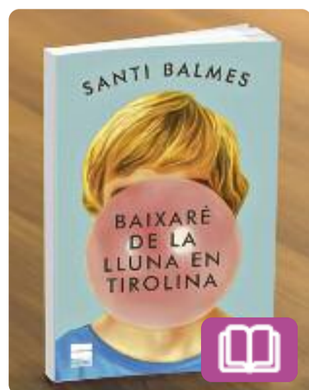
Baixaré de la lluna en tirolina Santi Balmes

El David, o Deivid Weirdo, com li agrada que li diguin, és un preadolescent que veu el món des d'una perspectiva molt diferent de la de la seva família i no està passant pel seu millor moment: els seus pares s'acaben de separar, el seu germà gran ha deixat de parlar-li i no sap per què i, a sobre, s'ha enamorat per primera vegada d'una noia de la qual no en sap ni el nom.