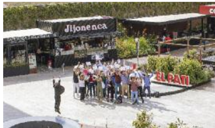
El programa forma cada any desenes de joves en atur.

Jaime Tamayo, gerent de l'Splau, afirma que amb el Work@Splau volen "reforçar el compromís amb la comunitat i l'entorn més pròxim".