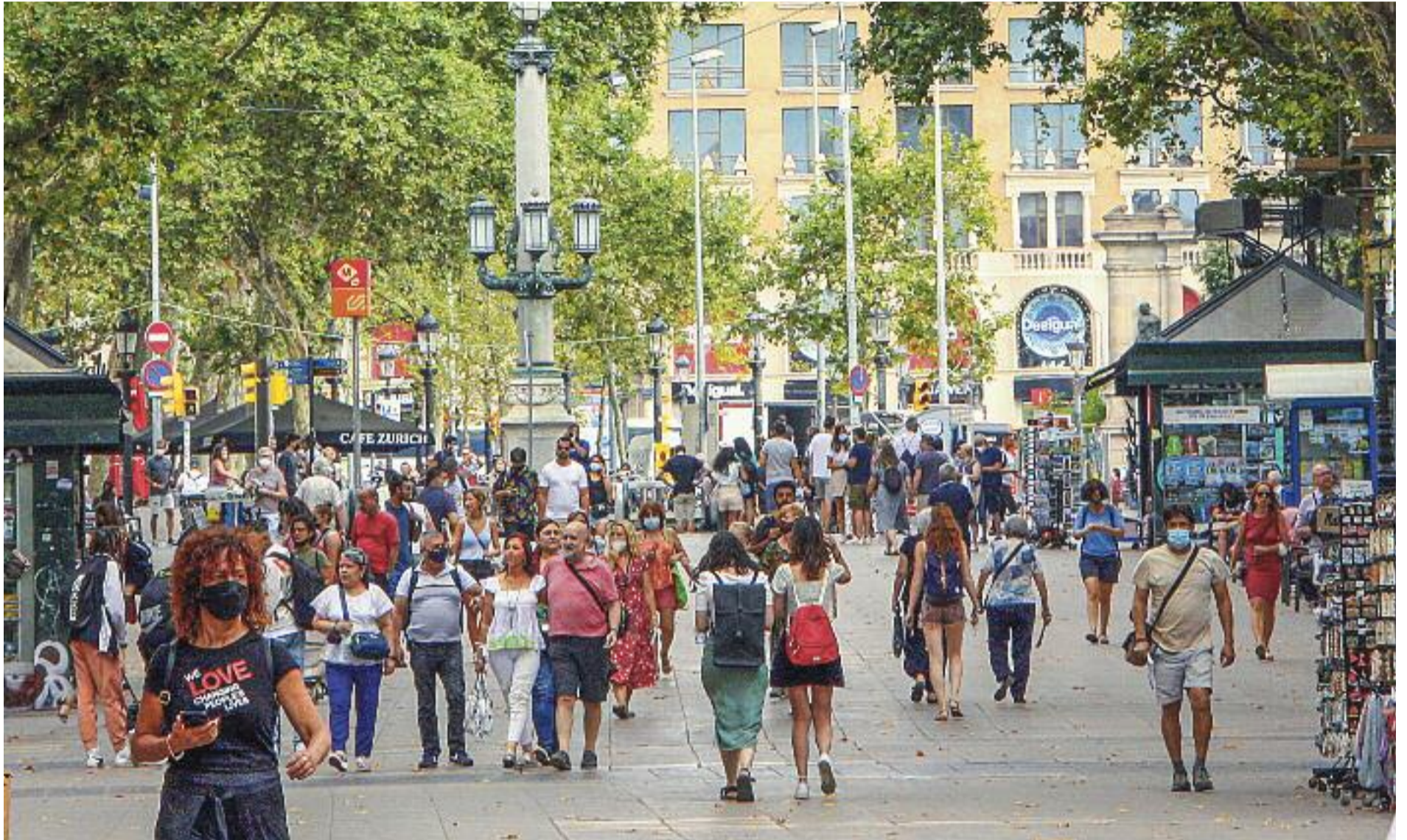
Un avantatge de la renda és que permet evitar l'estigmatització dels perceptors.

» Es farà una prova pilot durant dos anys per veure com es podria aplicar a tota Catalunya aquesta ajuda universal, individual i no condicionada a cap requisit