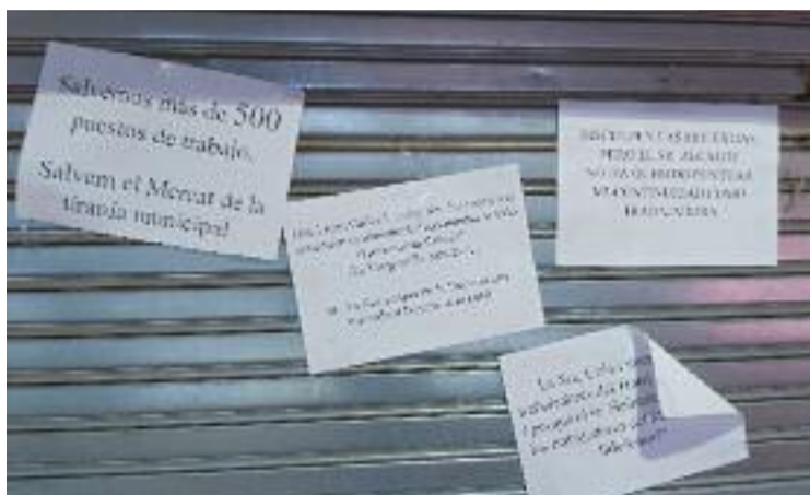
Algunes parades del mercat ja han abaixat la persiana.

Rambla assenyala que el preu de les parades és just, però que els 12.000 euros que demanen pels magatzems, un 70% a pagar els primers anys, és una "bogeria". I és que la crisi de la covid no ha