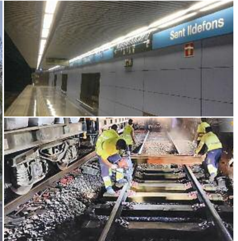
A l'esquerra, una de les zones afectades, entre l'Hospitalet i Cornellà. A baix a la dreta, treballs de TMB a les vies malmeses.

primer i tremola el llit”, denuncia Alvear, que avisa dels problemes d'ansietat que pateixen alguns veïns, que viuen “amb el soroll ficat al cap contínuament”. I és que en alguns pisos les molèsties no es queden en les vibracions, ja que poden arribar a sentir grinyolar els trens.