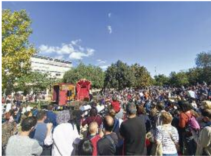
El festival va comptar amb una bona entrada.

Igualment, durant tot el matí es van celebrar actuacions itinerants de la Martingala Band i tallers a càrrec de la companyia Pessic de Circ, que es van encarregar d'animar