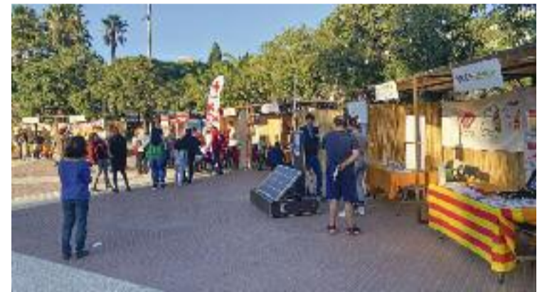
Les entitats van mostrar la seva feina als veïns.

Coincidint amb la fira, la plataforma Cornellà Solidari està a punt d'enviar un carregament de material d'oficina i altres productes cap a l'illa de Cuba.