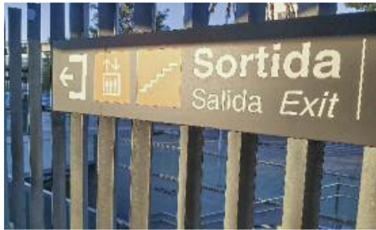
Per anar cap al nord de la ciutat cal fer una bona volta.

Aquesta incomoditat la viuen milers de passatgers diàriament. El 2016, el Síndic de Greuges,