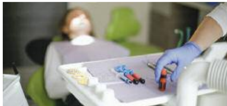
Diverses consultes de la ciutat s'han adherit al programa.

AJUDES ▶ L'Ajuntament posarà en marxa el Programa de Suport a la Salut Bucodental, una iniciativa adreçada a infants, adolescents i joves de famílies vulnerables que necessiten tractament odontològic, però que no poden assumir-ne el cost.