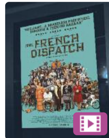
La crònica francesa Wes Anderson

La crònica francesa és la nova pel·lícula de Wes Anderson, ambientada en la redacció d'un diari estatunidenc a una ciutat francesa fictícia durant el segle XX, i presenta tres històries connectades entre elles. Es tracta d'una carta d'amor al món del periodisme. El film es va presentar al Festival de Cannes 2021 i va ser aclamat per la crítica.