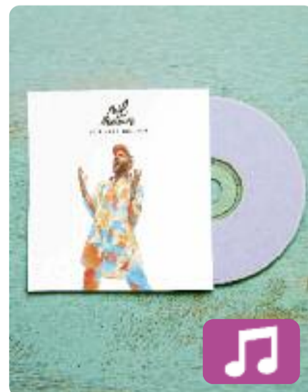
Un secreto al que gritar Nil Moliner

Un secreto al que gritar és el segon àlbum de Nil Moliner, que s'acaba de publicar. El cantant de Sant Feliu de Llobregat presenta en aquest nou treball discogràfic un total d'onze cançons, entre les quals hi ha dues col·laboracions: Me quedo , amb Ana Mena, i Se me va , amb Danny Romero. També hi ha inclòs una cançó en català, Som ocells .