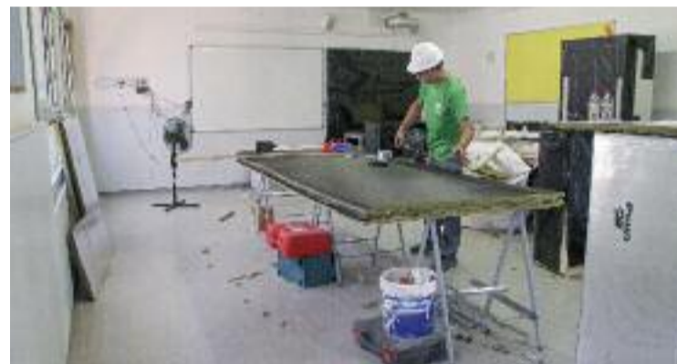
Obres de climatització a l'escola Els Llorers de Barcelona.

En relació amb els terminis de les obres, l'objectiu és que les escoles puguin obrir el 9 de setembre, encara que no totes tindran els treballs enllestits. Segons Collboni, en alguns casos les obres s'allargaran durant tot el darrer trimestre d'aquest any i després es plantejarà el pròxim paquet d'escoles a millorar.