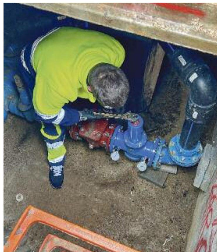
Imatge d'arxiu d'un operari en una canonada.

Pel que fa a la distribució dels 100 milions, la Diputació ha adjudicat d'entrada 100.000 euros a cada ajuntament, partida que suma 31 milions d'euros, mentre que els 69 milions restants els distribuirà entre els municipis "en funció d'un conjunt de variables i sota criteris objectius d'equitat".