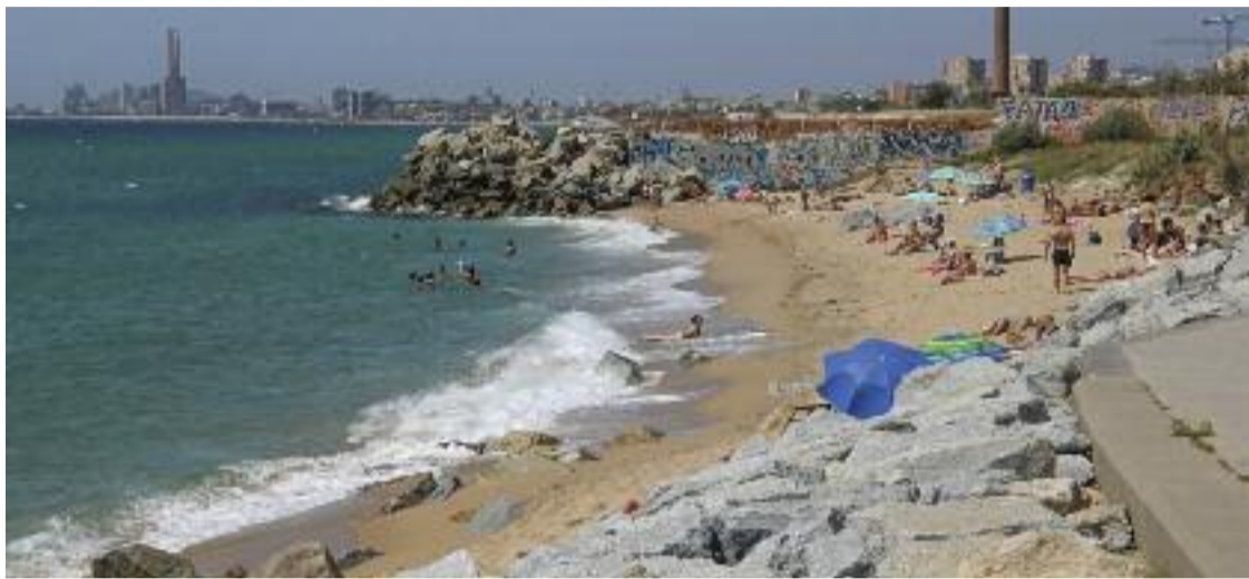
Imatge d'arxiu d'una platja de Montgat aquest estiu.

Al mateix temps, Torra assegura que el litoral de l'àrea me-