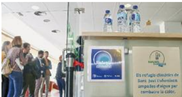
Refugi climàtic a Sant Just Desvern.