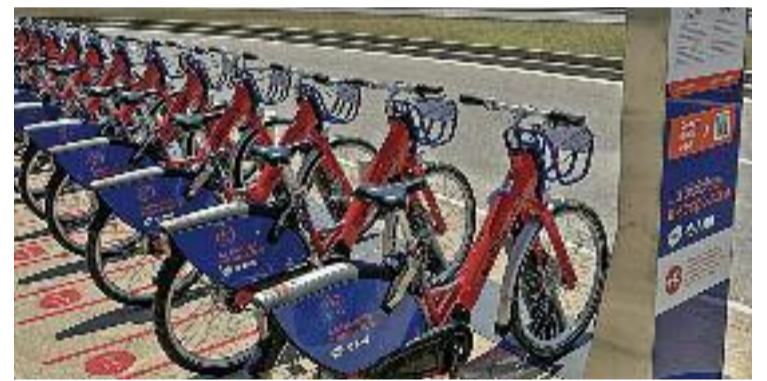
Nou aparcament +P a Castelldefels.

BICICLETA ▶ Alguns usuaris del servei AMBici, titularitat de l'Àrea Metropolitana de Barcelona (AMB), es troben que, en algunes de les estacions amb més demanda, i sobretot en les que estan situades a la platja ara que és estiu, no hi ha lloc per aparcar la bicicleta quan acaben el seu trajecte, fet que els obliga a esperar un lloc o a continuar pedalejant fins a una altra estació. Amb l'objectiu de solucionar aquest problema i facilitar la mobilitat en aquest mitjà de transport, l'AMBici ha estrenat 280 aparcaments nous.