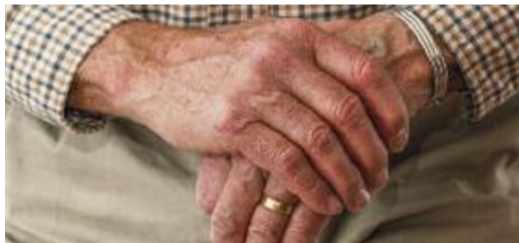
L'atenció a la gent gran dependent és un pilar de la fundació.

SERVEIS ▶ La Fundació per a l'Atenció a Persones Dependents, una iniciativa creada el 2005 per l'Ajuntament, la Diputació, Creu Roja i Tecsal SA, va atendre 8.790 persones el 2021, que es van beneficiar dels seus serveis i programes. En concret, es van atendre i orientar 1.585 famílies, mentre que es van repartir 12.434 àpats a domicili.