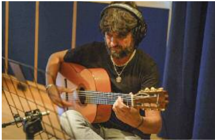
Una imatge del documental.