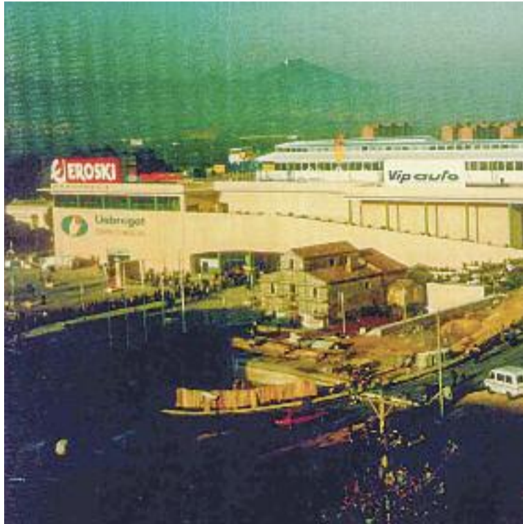
Passat i present: a l'esquerra, imatge del dia de la inauguració del centre, l'1 de desembre del 1994. A la dreta, foto de l'actualitat.

Mentrestant, els comerços es preparen per fer front al tancament, que es farà efectiu el 8 de gener, després de Nadal. “Els