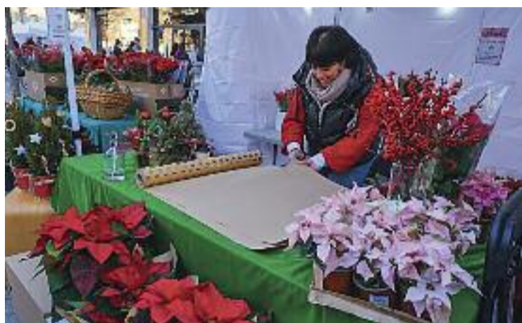
Els comerciants esperen Nadal amb candeletes.

Pel que fa al Mercat Marsans, el dia 22 de desembre estarà obert de vuit a dues del migdia.