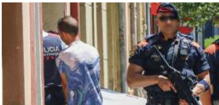
Els Mossos porten l'acusat a casa seva en un registre del 2019.

El veredict, fet públic dimarts dia 20 a la tarda a l'Au-