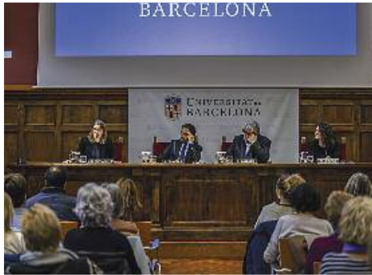
Presentació de la càtedra a l'Aula Magna de la UB.

"UNA SOCIETAT MÉS JUSTA" Per la seva banda, Guàrdia va destacar el potencial que té l'activitat acadèmica "per contribuir