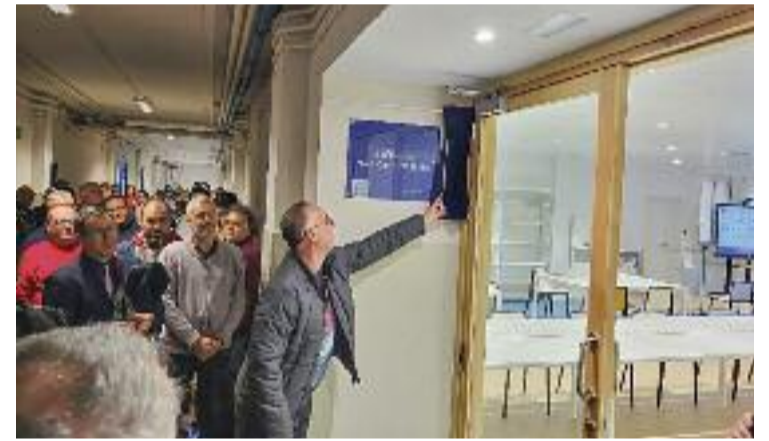
Acte de descoberta de la placa commemorativa.

Totes les taules tenen connexió elèctrica per treballar amb ordinadors i tots els elements són mòbils per facilitar la multifuncionalitat de la sala.