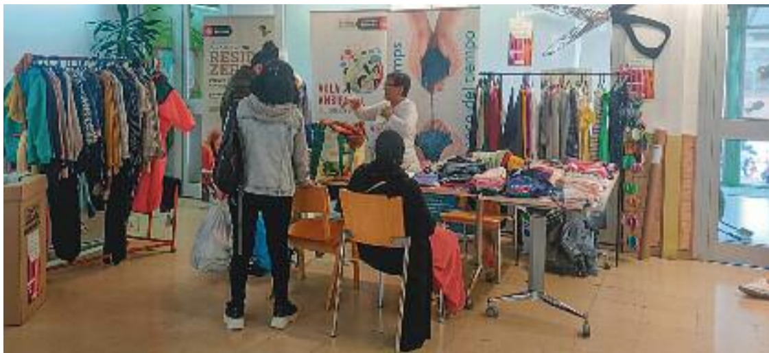
Punt d'intercanvi de roba al districte de Sant Andreu de Barcelona.

El tèxtil és un sector que genera a la Unió Europea 12,6 tones de residus l'any, cosa que suposa uns 12 quilos per persona. El mercat de segona mà o l'intercanvi de productes són algunes de les al-