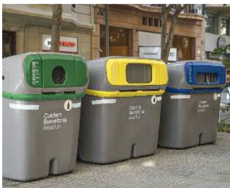
Un web et pot ajudar a triar el contenidor que toca.