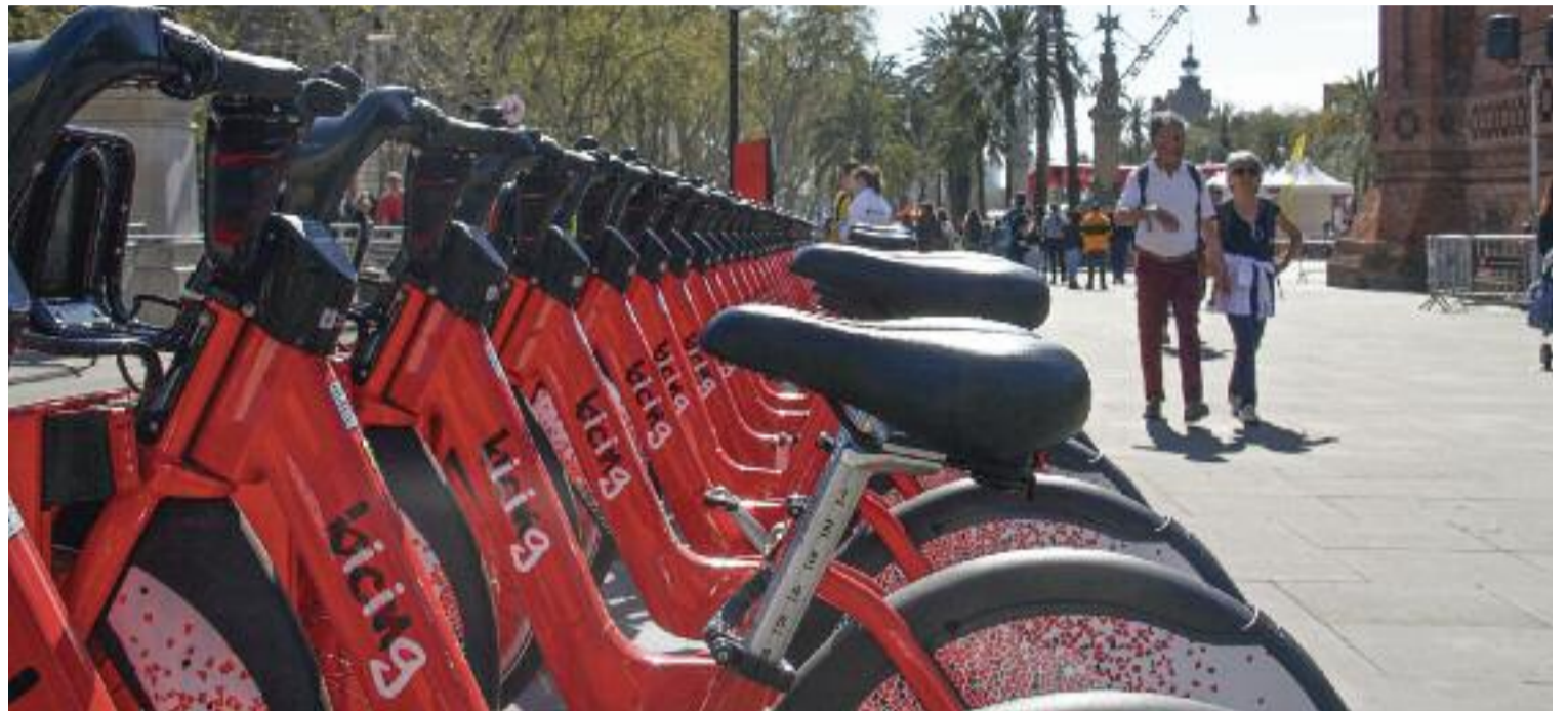
Imatge d'arxiu d'una parada del Bicing, a Barcelona.

D'altra banda, els que vulguin fer servir aquest mitjà de transport fora de Barcelona disposen del servei de bicicleta pública metropolitana AMBici, que funciona en onze municipis metropolitans i que, pròximament, arribarà fins a un total de quinze localitats. Des que al gener es va posar en marxa, s'han