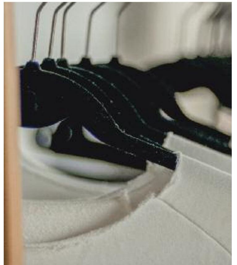
Els penjadors de roba s'han de portar a la deixalleria.

Finalment, per evitar-nos maldecaps, potser el millor és utilitzar productes reutilitzables o retornables, com ampolles de vidre o bolquers de roba.