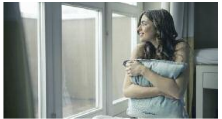
Canviar les finestres és un pas per tenir una llar més sostenible.

Amb els fons europeus Next Generation, i en col·laboració amb l'Institut Català d'Energia, els propietaris –particulars, empreses o administracions– d'habitatges unifamiliars o blocs de pisos ubicats en municipis catalans de menys de 5.000 habitants poden accedir a un ajut per rehabilitar els seus immobles. Gràcies a la campanya #EstrenaEdifici, els beneficiaris poden aconseguir el finançament d'entre un 40% i un 100% de la inversió que requereixi la rehabilitació.