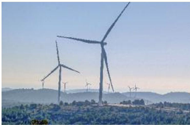
S'han multiplicat els megawatts d'energia renovable.

En aquest sentit, Aragonès va destacar que, en només dos anys, des que es va aprovar el decret de l'any 2021, s'han tramitat 110 noves instal·lacions d'energia eòlica i fotovoltaica. Un cop estiguin a ple rendiment, suposaran 1.600 megawatts (MW) més d'energies renovables. La dada crida especialment l'atenció si es té en compte que, tal com va recordar el president de la Generalitat, en els deu anys anteriors només se n'havien