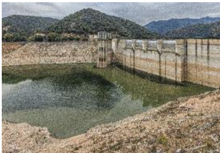
El Pantà de Sau, amb el nivell d'aigua molt baix.