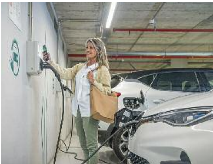
Un punt de recàrrega de cotxes elèctrics.