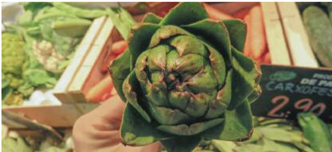
No s'han de jutjar els aliments pel seu aspecte perquè són bons igualment.

El discurs contra el canvi climàtic i, en aquest cas, el malbaratament alimentari se centra, en bona part, en les petites accions. És per això que les administracions, eixos comercials i entitats relacionades amb l'alimentació insisteixen en el consum de proximitat i de productes de quilòmetre zero per afavorir el consum responsable.