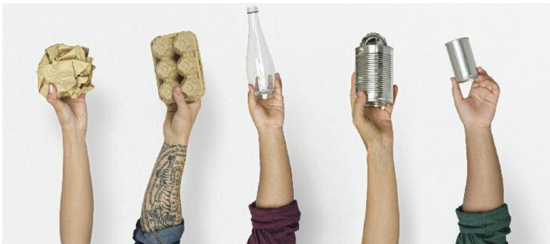
Ho indiquen les dades i així hi insisteixen les administracions: en reciclatge hi ha molt marge de millora i tenim molts deures per fer.