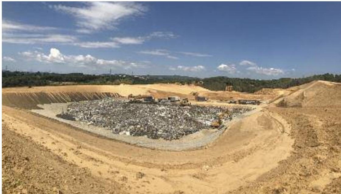
Una part dels residus va a l'abocador d'Hostalets de Pierola.

» Quan no reciclem, part de les deixalles acaba en abocadors » Cada ciutadà genera gairebé 450 quilos de residus l'any