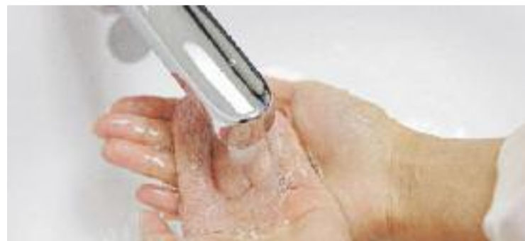
Tots podem contribuir a l'estalvi d'aigua.

L'aigua de cuina, per altra banda, la que fem servir per rentar els aliments, es pot reutilitzar per regar, sempre que no tingui sal ni condiments. En aquesta línia, rentar els plats amb el rentavaixelles ajuda a estalviar aigua, així com prioritzar els programes d'estalvi de les rentadores i netejar el cotxe en establiments comercials amb sistemes de recirculació de l'aigua.