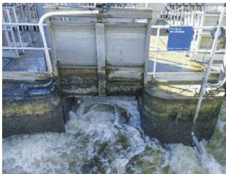
Aigua en procés de regeneració a la depuradora del Prat.