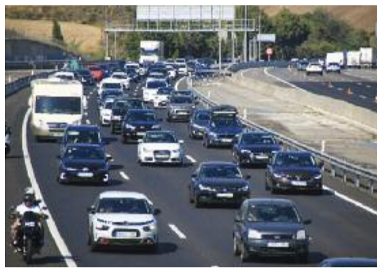
L'ús del vehicle privat impacta en la qualitat de l'aire.

Una mesura original és la targeta T-verda, que permet als ciutadans metropolitans que hagin donat de baixa i desballestat un vehicle sense etiqueta ambiental fer servir de manera il·limitada i gratuïta els serveis de transport públic integrats en una zona tarifària delimitada durant tres anys.