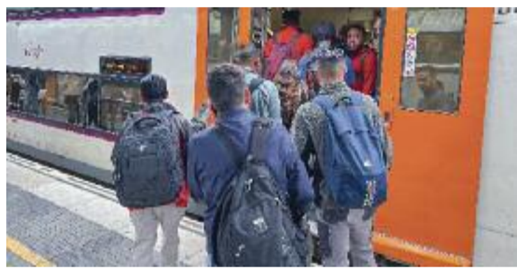
Passatgers pugen a un tren de Gavà.

REPTES ▶ "No podem demanar consciència ecològica si no oferim unes connexions que puguin competir amb la mobilitat privada". Són paraules de l'alcalde de Gavà, Gemma Badia, durant una entrevista a l' Espai Línia de finals de març, en clara referència a la millora de la connectivitat en tren a la metròpoli. En aquest sentit, el servei de Rodalies és un element clau per avançar cap a un horitzó de reducció de l'ús del vehicle privat.