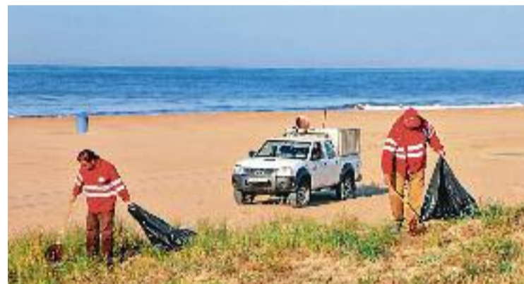
La majoria dels residus recollits a les platges s'acaben reciclant.

D'altra banda, des de fa uns anys, l'AMB també s'ocupa de garantir que la sorra estigui bé i setmanalment fa una anàlisi per controlar-ne la qualitat.