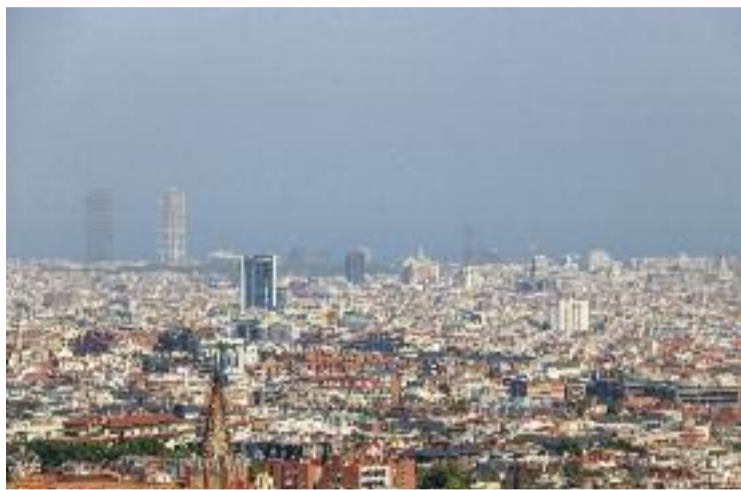
La contaminació és un dels reptes de la metròpoli.

Conscients d'això, les administracions de la conurbació de Barcelona s'han posat les piles darrerament per millorar la situació. La mesura estrella en aquest sentit ha estat la Zona de Baixes Emissions (ZBE), impulsada per l'Àrea Metropolitana de Barcelona (AMB) i els cinc ajuntaments que integren la ZBE: Barcelona, l'Hospitalet de Llobregat, Sant Adrià de Besòs, Cornellà de Llobregat i Esplugues de Llobregat.