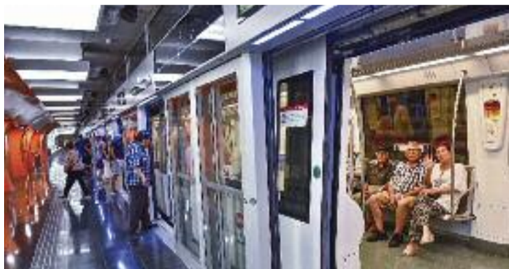
Un comboi de la línia L10 a l'estació de Foneria.

Hi ha desenes de projectes i accions en el marc d'aquest pla, tot i que entre tots destaca l'optimització de la conducció automàtica dels trens, fet que permet reduir 27 GWh l'any i evitar l'e-