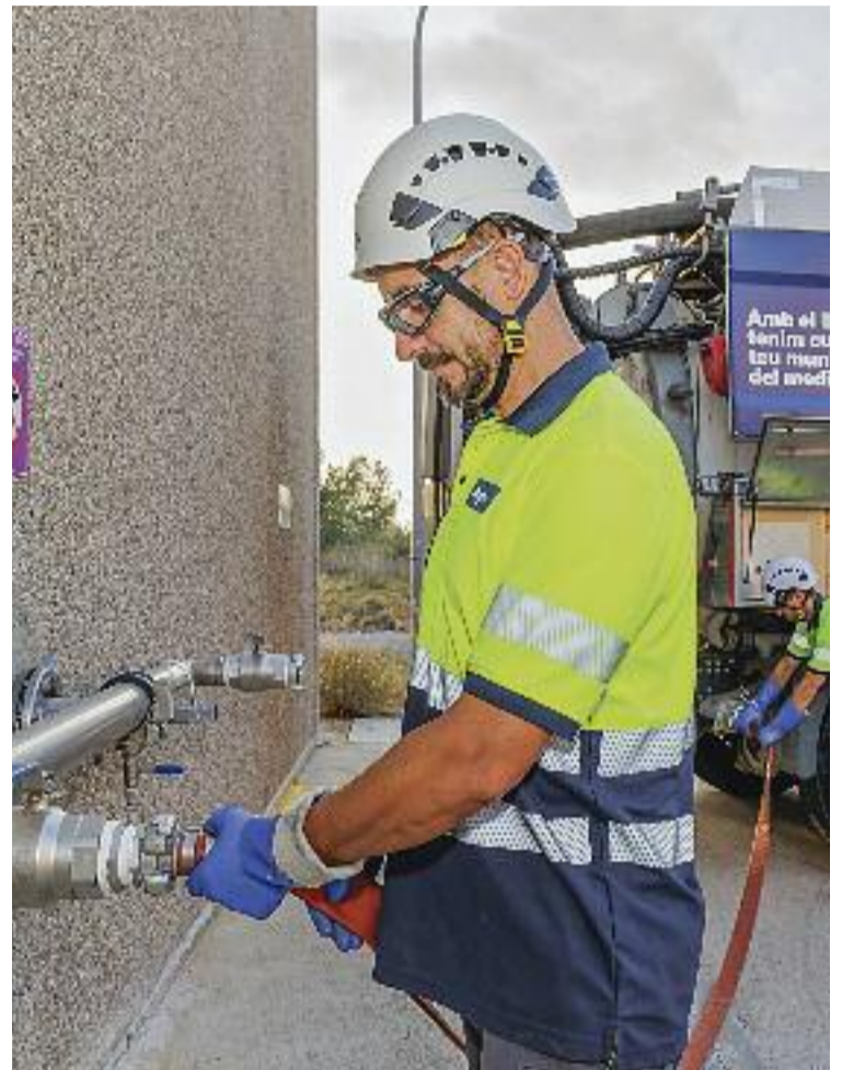
L'aigua regenerada permet assegurar la disponibilitat i la qualitat dels recursos hídrics sense dependre de la pluja.

► La sequera s'ha instal·lat a casa nostra. Catalunya pateix la situació més greu dels darrers 50 anys, la qual cosa ha obligat l'Agència Catalana de l'Aigua a decretar l'estat d'excepcionalitat, una mesura que afecta uns 6 milions de persones d'un total de 495 municipis. Fa més de dos anys que no hi ha un règim normal de pluges. La sequera és un fenomen recurrent a la conca mediterrània, però amb el canvi climàtic cada vegada hi ha més episodis i són més llargs i intensos. La manca d'aigua té un impacte clar en l'estat dels boscos i el risc d'incendis i sectors econòmics claus com l'agricultura, la ramaderia o el turisme.