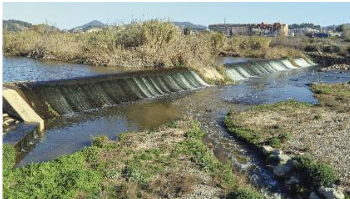
Un canal d'aigua regenerada desembocant al Llobregat.

» Un 25% de l'aigua de l'àrea metropolitana ja és aigua regenerada » L'AMB vol evitar la falta d'aigua que preveu que hi haurà el 2050