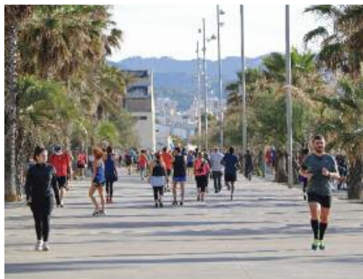
Respirar un aire contaminat afecta la salut.