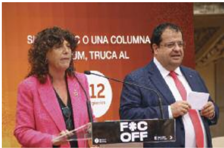
Teresa Jordà i Joan Ignasi Elena.

En l'acte de presentació de la campanya hi van participar el conseller d'Interior, Joan Ignasi Elena, i l'aleshores consellera d'Acció Climàtica, Teresa Jordà. Ambdós van fer una crida a la conscienciació i a la col·laboració ciutadana per prevenir incendis.