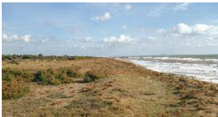
Les dunes redueixen l'impacte de l'erosió causada pel mar i el vent.

Segons l'AMB, l'acció humana i el canvi climàtic han portat a la pèrdua de la majoria dels ecosistemes que hi havia a les platges. En especial, però, preocupa la pèrdua de les dunes, que fan una funció clau per mitigar els efectes del canvi climàtic i evitar el retrocés de la sorra, ja que redueixen l'impacte de l'erosió causada pel mar i el vent. En aquest sentit, des de l'AMB asseguren que actualment hi ha un 15% de la costa me-