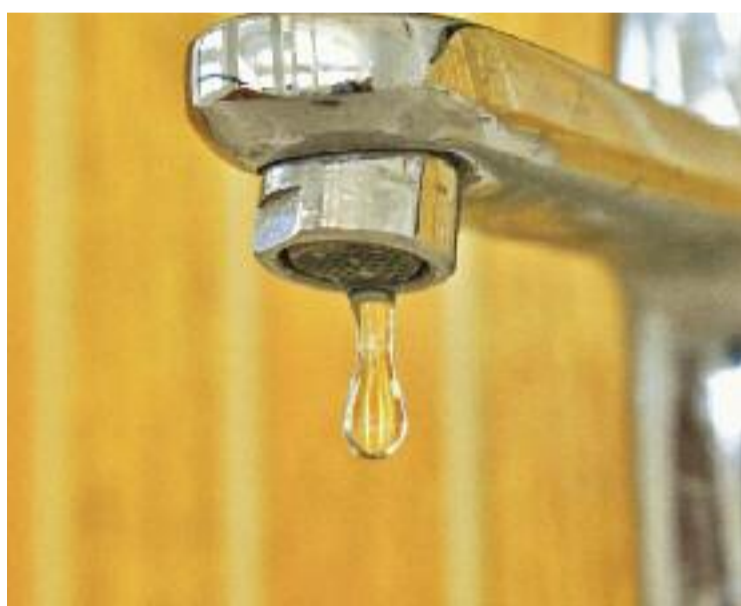
Gastar menys aigua ha de ser la primera resposta a la sequera.