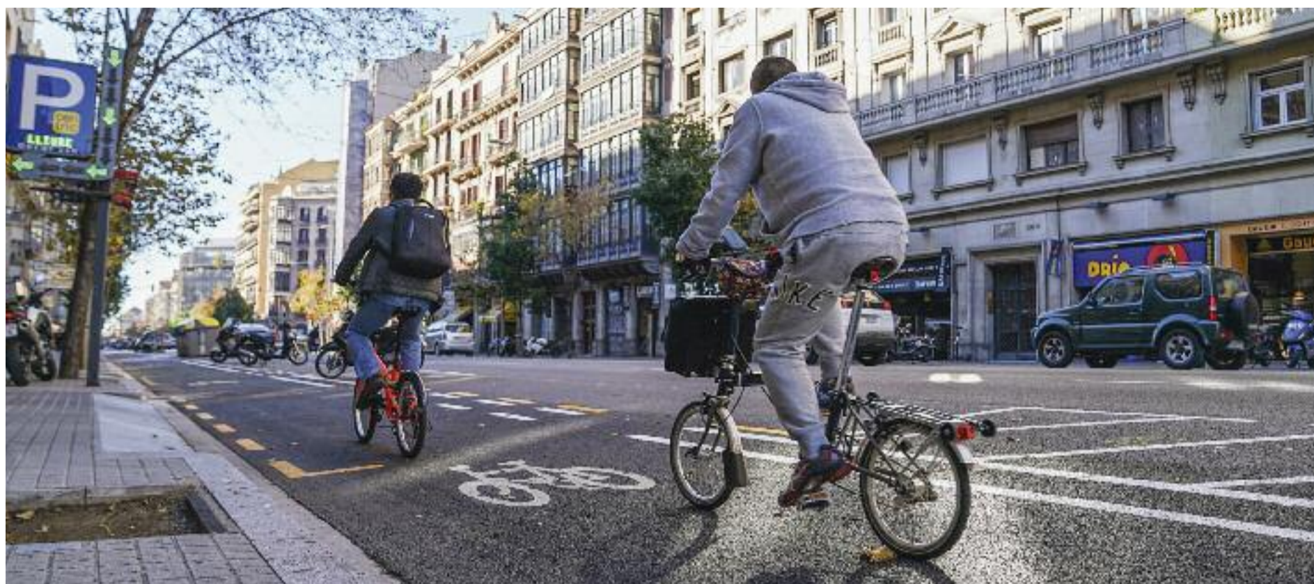
Fomentar la mobilitat sostenible, com la que es fa en bicicleta, és un dels objectius compartits per les diverses administracions.