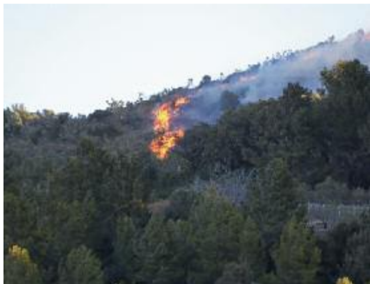
El Govern dona recomanacions per evitar incendis.