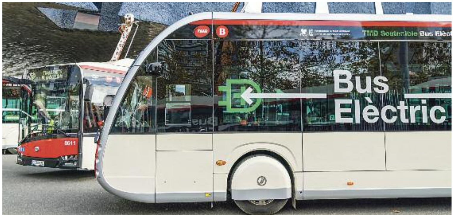
La incorporació de nous vectors energètics com l'electricitat va convertint la flota d'autobusos en una flota verda.

de la flota de metro també s'està portant a terme amb la incorporació de nous trens més accessibles i sostenibles, com les 50 noves unitats de les sèries 7000 i 8000 per a les línies 3 i 1.