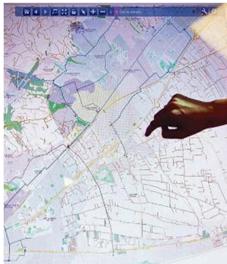
Centre de Control Operatiu d'Aigües de Barcelona.

RESSONA opta a una subvenció del Projecte Estratègic per a la Recuperació i Transformació Econòmica (PERTE) centrat en la digitalització del cycle de l'aigua, impulsat pel Ministeri per a la Transició Ecològica i el Repte Demogràfic en el marc dels fons europeus Next Generation. Concretament, opta a una subvenció de deu milions d'euros que cobriria el 50% del pressupost del projecte.