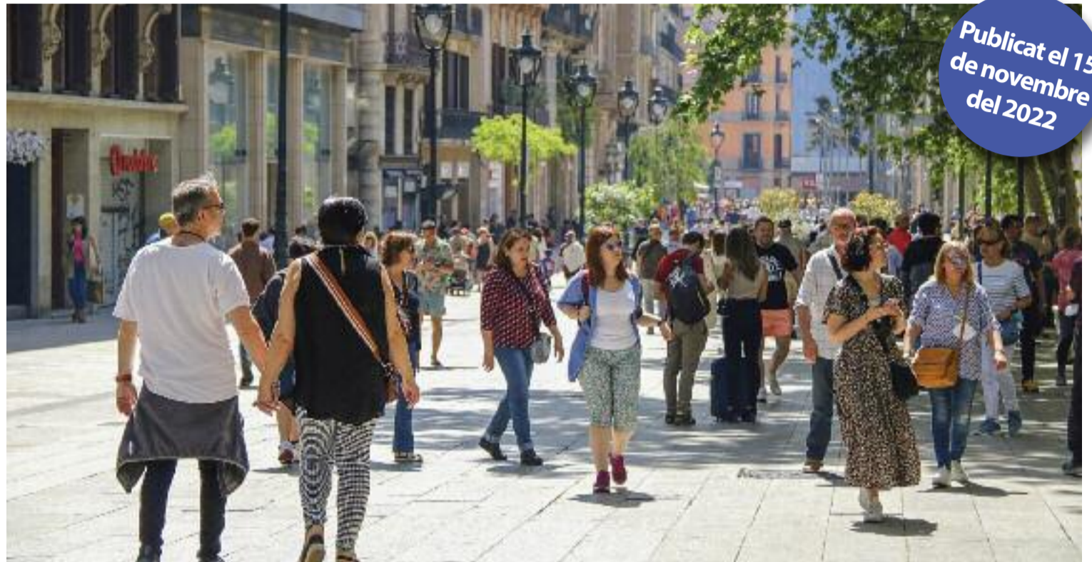
El català és la llengua minoritària entre els joves als deu districtes de Barcelona.