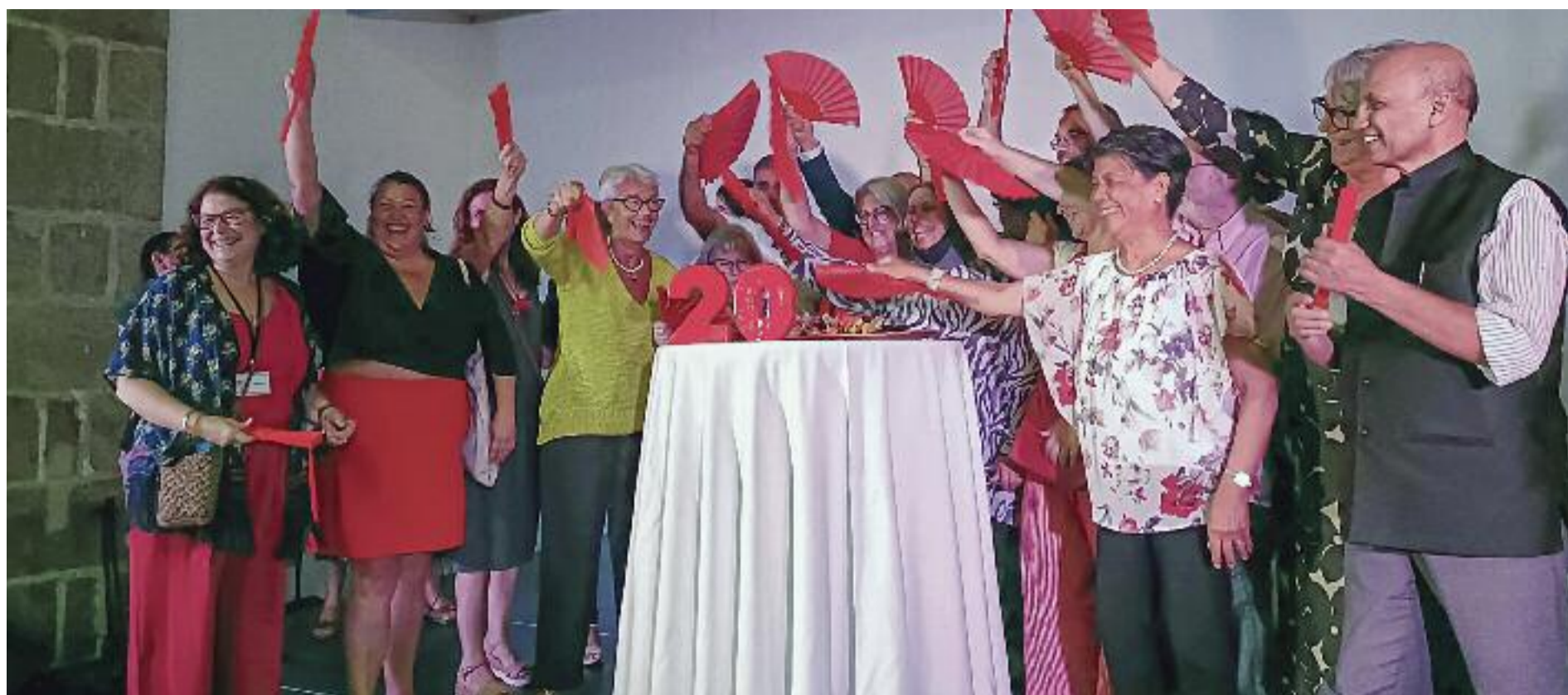
Un moment de l'acte de celebració del 20è aniversari de la fundació, que va tenir lloc al Museu Marítim de Barcelona.