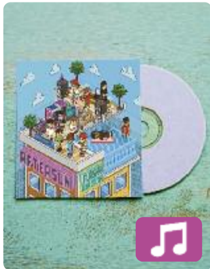
Aftersun Flashy Ice Cream

El grup de trap en català Flashy Ice Cream torna aquest estiu amb un EP. Aftersun (Delirics) és el títol d'aquest nou treball que, segons la seva companyia discogràfica, "és el camí a la llum després de tanta foscor". Els de Sabadell presenten en aquest disc cinc cançons, entre les quals hi ha col·laboracions amb 31 FAM o Sexenni, entre altres.