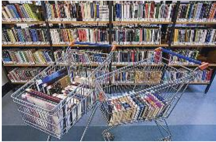
La llibreria es dedicarà només a la venda online.