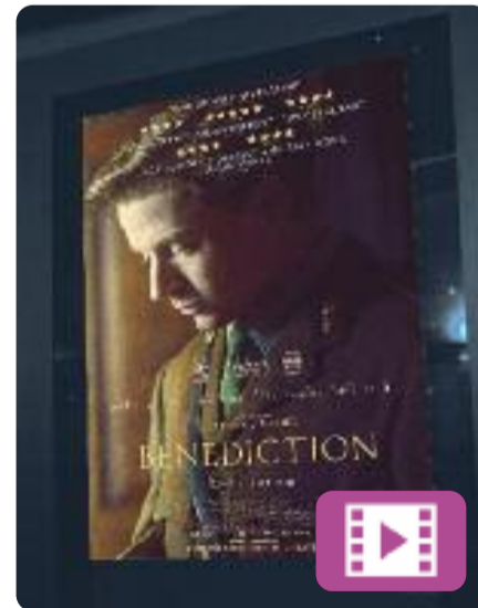
Benediction Terence Davies

Siegfried Sassoon va ser un home complex que va sobreviure a la Primera Guerra Mundial i va ser condecorat per la seva valentia. Va escriure poesia inspirant-se en el que havia viscut i va ser idolatrat a Londres. Va mantenir relacions amb diversos homes mentre intentava acceptar la seva homosexualitat i va intentar buscar respostes en el matrimoni i la religió.