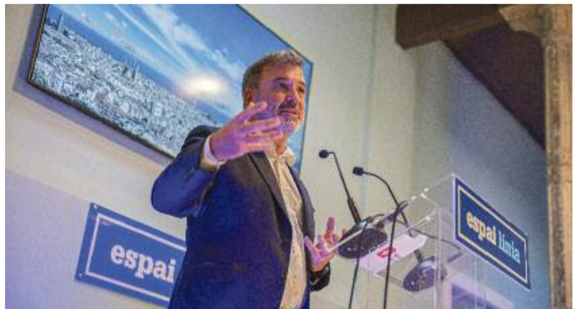
El primer tinent d'alcaldia de l'Ajuntament de Barcelona, Jaume Collboni, intervenint en l'acte.