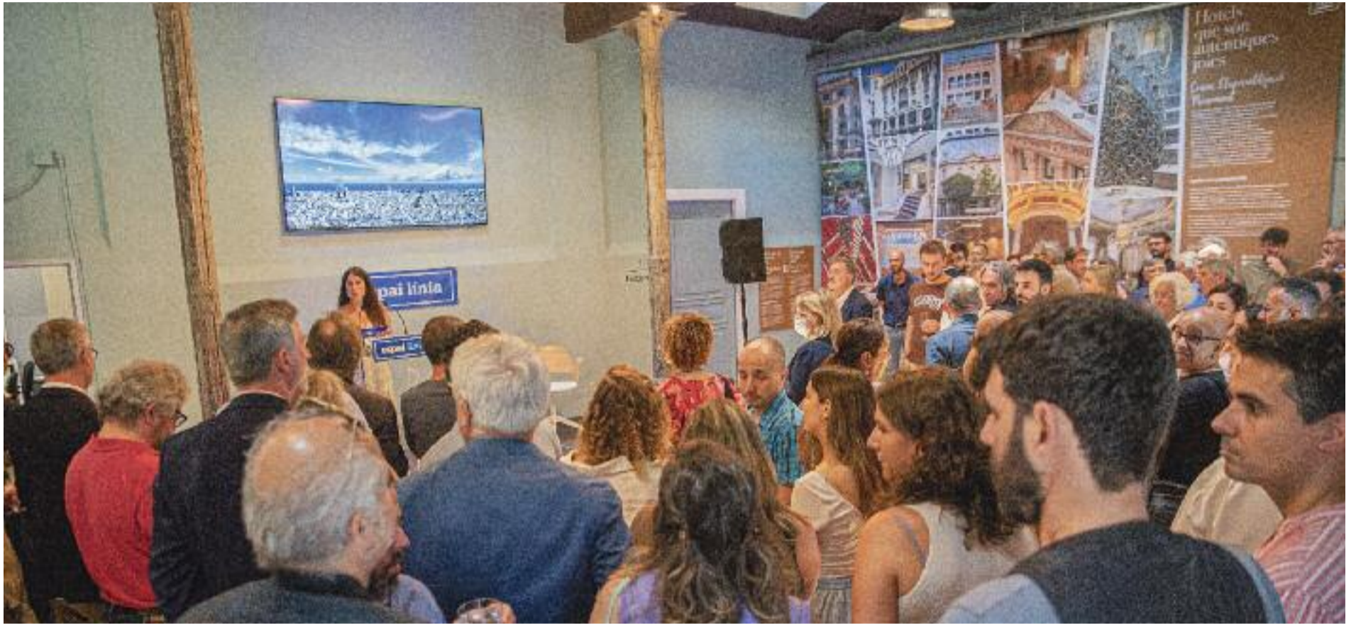
Prop de 150 persones van assistir a l'acte inaugural.

E strena llúida. Divendres 15 de juliol, en plena onada de calor, Espai Línia es va omplir de gom a gom en el dia de la inauguració d'aquest primer Centre de Comunicació de Proximitat impulsat pels diaris Línia i Comunicació 21 al carrer Girona, 52 de Barcelona.