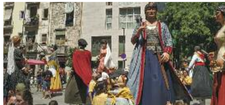
Les festes es van celebrar amb normalitat.

TRADICIÓ ▶ Després de dos anys sense gaudir de la Festa Major del Raval amb normalitat, entre el passat 14 i 17 de juliol va tornar al 100%. Va haver-hi, entre altres, un vermut popular de la Xarxa Veïnal del Raval, concerts de música brasilera a la rambla del Raval i una cercavila de colles bastoneres de Barcelona i fora de la ciutat.