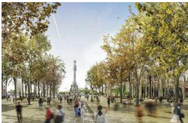
Una imatge virtual de la futura Rambla.

Davant d'això, indica, fa falta més inversió perquè les obres va-