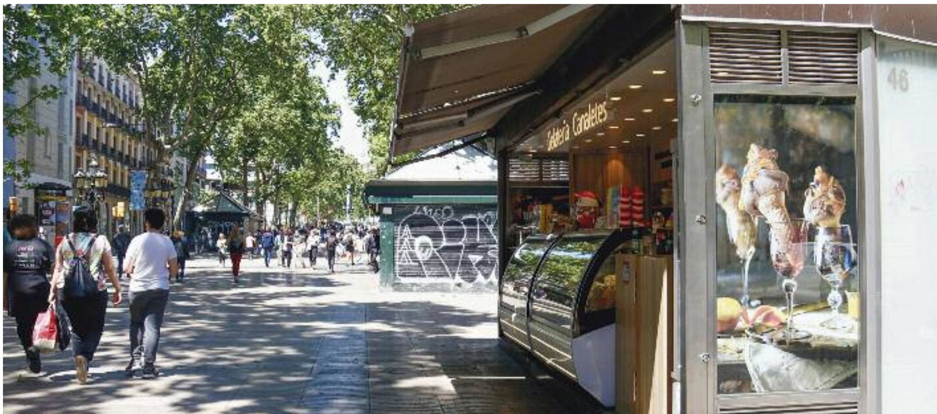
Les casetes dels antics ocellaires són actualment negocis com per exemple gelateries.