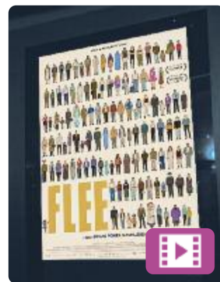
Flee Jonas Poher Rasmussen

Flee ha fet història als Oscars ja abans de la gala, que se celebrarà el 27 de març: l'han nominat alhora a les categories de pel·lícula documental, pel·lícula d'animació i pel·lícula internacional. Aquest film danès, estrenat amb èxit al Festival de Cinema de Sundance, explica la història d'un refugiad afganès homosexual que va haver de fugir del seu país.