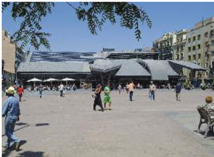
El comerç espera que la recuperació arribi en uns mesos.