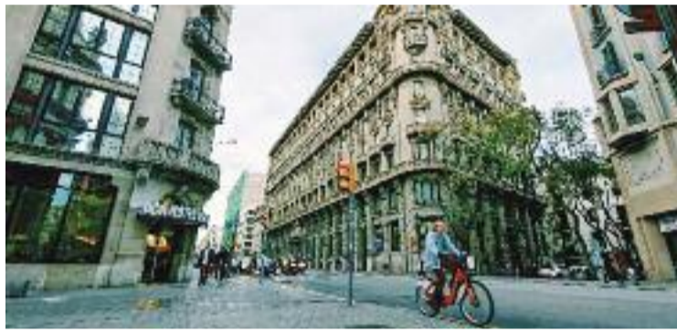
El trasllat serà als antics jutjats de la Via Laietana.

Des de l'Associació de Veïns del Gòtic aplaudeixen la mesura, ja que asseguren que convertir edificis públics en habitatges és una demanda "històrica". Però, recorden, en el pla hi ha 40 pisos públics menys del que es preveia. Les seves paraules estan basades en promeses recents. L'Ajuntament, recorden, es va comprometre fa uns anys a fer els pisos públics als jutjats de la Via Laietana, i llavors es va dir que la xifra seria de 110.