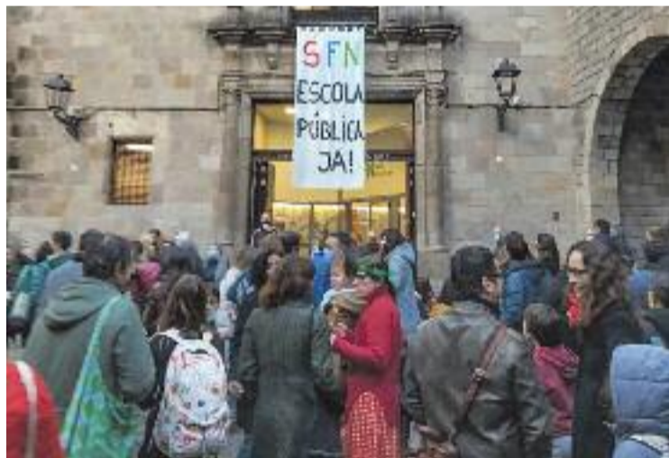
Una concentració davant de l'escola.