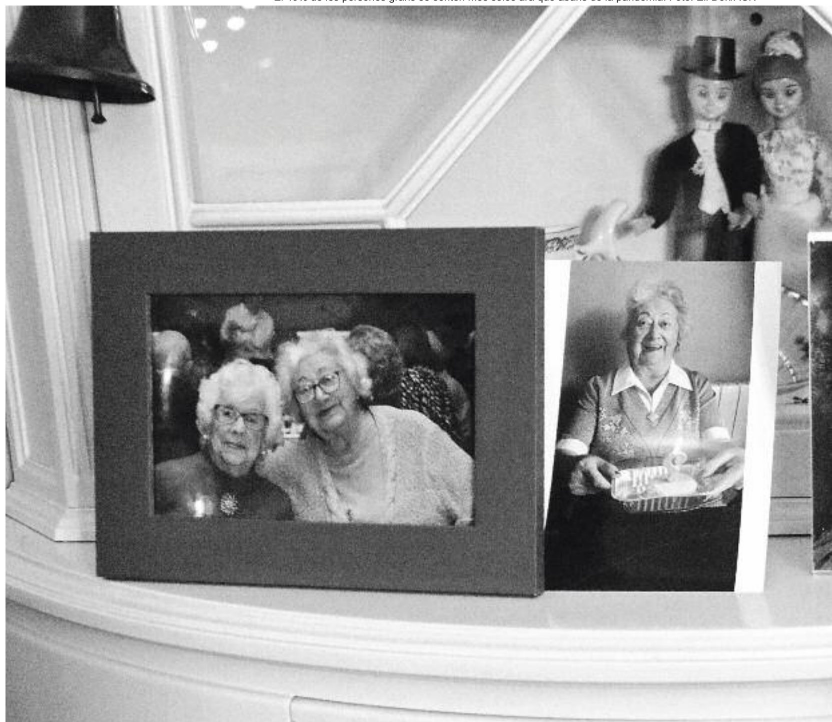
El 40% de les persones grans se senten més soles ara que abans de la pandèmia.