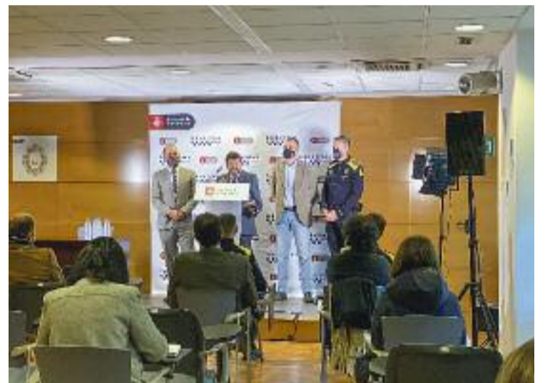
La comissaria estarà al carrer Tàpies.

Per la seva banda, el primer tinent d'alcalde Jaume Collboni va assegurar el passat 14 de febrer que l'obertura de la nova comissaria és una "magnífica notícia en termes de servei públic, proximitat i reforç de la infraestructura". Collboni també va destacar que la instal·lació serà realitzada amb una inversió d'1,2 milions d'euros. Es preveu que tingui capacitat per a 500 agents, mentre ara hi ha 410 treballant a tot el districte.