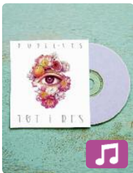
Tot i res Pupil·les

Amor, optimisme i alegria són tres ingredients molt presents al nou àlbum de Pupil·les, Tot i res (Halley Records). El segon disc d'aquestes dues valencianes homenatja el poeta Joan Vinyoli amb el títol i aplega una desena de cançons que s'allunyen una mica del rap més dur que feien abans, i s'inclinen per melodies i ritmes més festius.